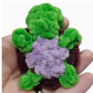
Sotto del corpo