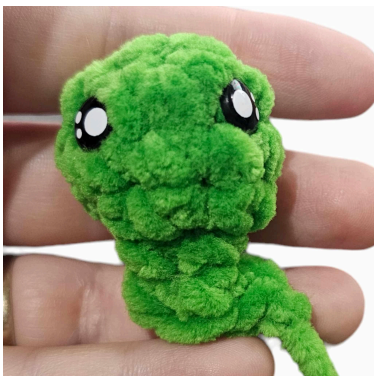
Testa del cucciolo