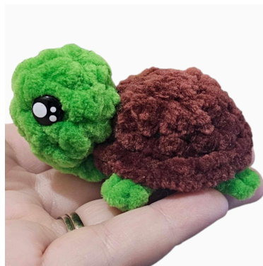
Corpo del cucciolo