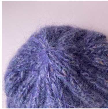
Dettaglio: parte superiore