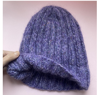
Dettaglio: bordo ripiegato

Il tuo berretto è ora pronto per essere indossato :)