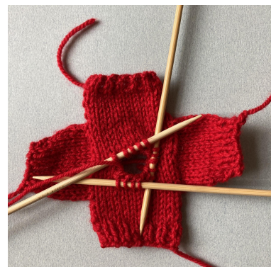
Riprendere le m per il colletto