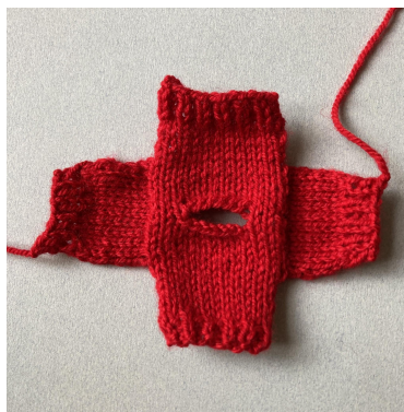
Le maniche sono finite