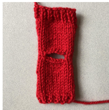
Dietr and front panels finished