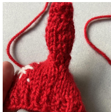
Cucitura laterale finita