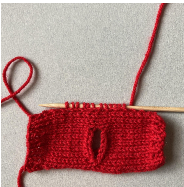
Riprendere le m per la manica