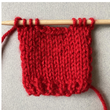
Pannello frontale, chiusura per il collo

Intrecciare per il collo: 4 dir, intrecciare 6 m, 4 dir