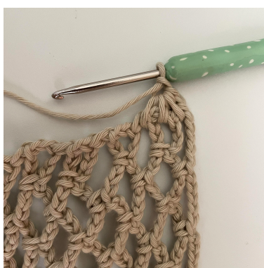
La foto mostra l'inizio del giro 1.

Giro 1 (LD): Lavora lungo i bordi laterali. Ruota il tuo lavoro di 90° gradi. Lavora attorno a ogni arco. 1 cat, mb nel primo gruppo di cat-5 sp *(3 mma ins, 1 cat). Rip da *( ) fino alla fine. Mb alla fine. Gira. (20m)