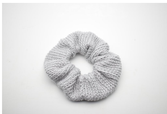
16. Taglia il filo e intrecciare alle estremità.