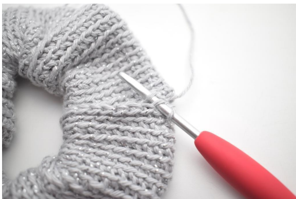
13. Lavorare 1 mbss attraverso la m post successiva e i successivi anelli.