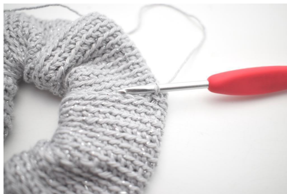
14. In questo modo.