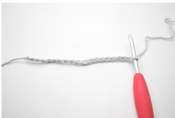
1. 20 cat.