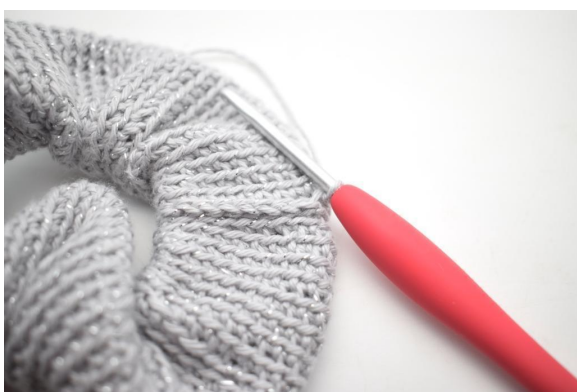
15. Ripetere per tutto il giro.