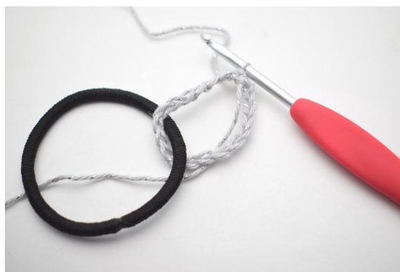
2. Con le catenelle appena create fai un anello attorno all'elastico con 1 mbss.