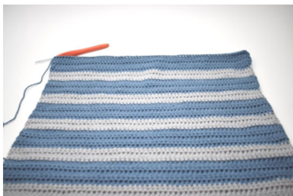
Gira e 1 cat.