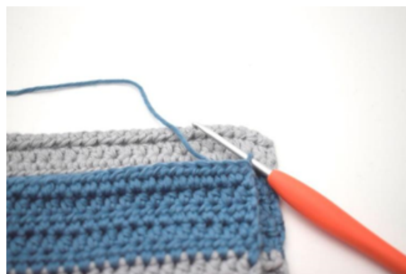
Unire i due lati più corti usando mbss.