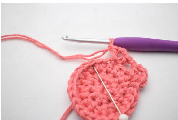
11. “Saltare 2 m lavora 1 mma, 2 cat e 1 mma nella m succ. 1 cat”.