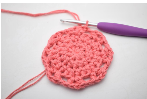
13. Ripetere da “a” fino alla fine del giro. Termina con 1 mbss.