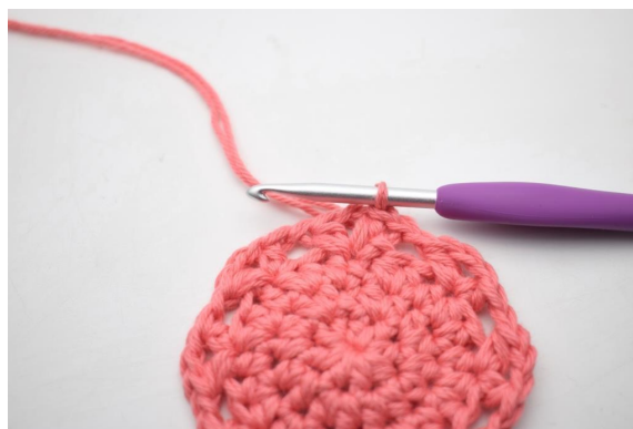
15. In questo modo.