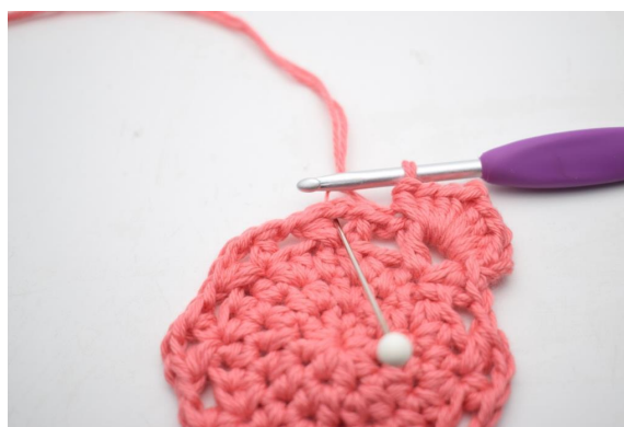
19. “Lavora 4 mma, 1 cat e 4 mma nel arch”.