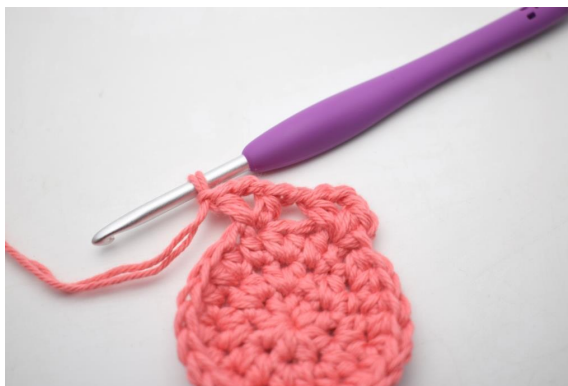
10. In questo modo.