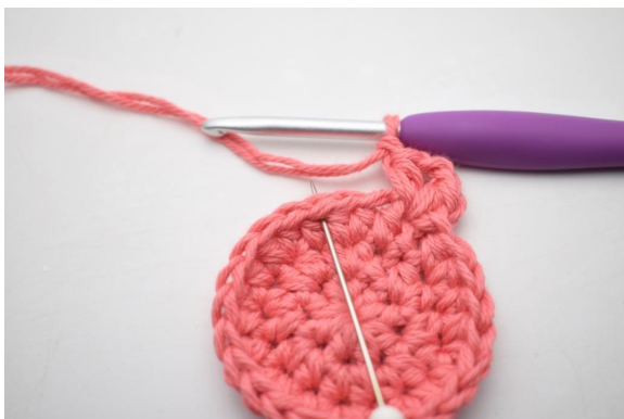
9. “Saltare 2 m lavora 1 mma, 2 cat e 1 mma nella m succ. 1 cat”.