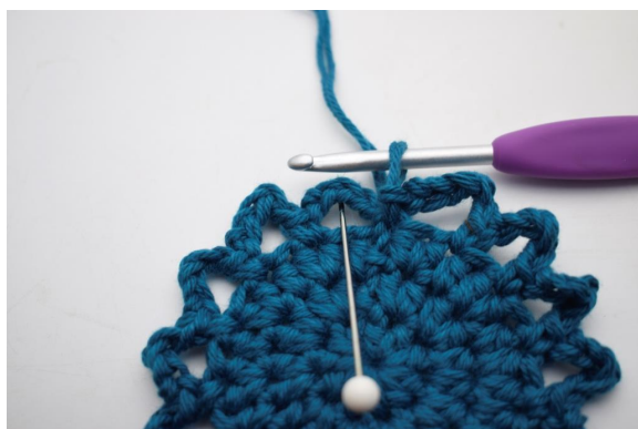
14. Lavora 3 mbss lungo il primo arco di cat per iniziare al centro dello spazio.