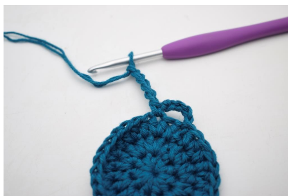
8. "5 cat.