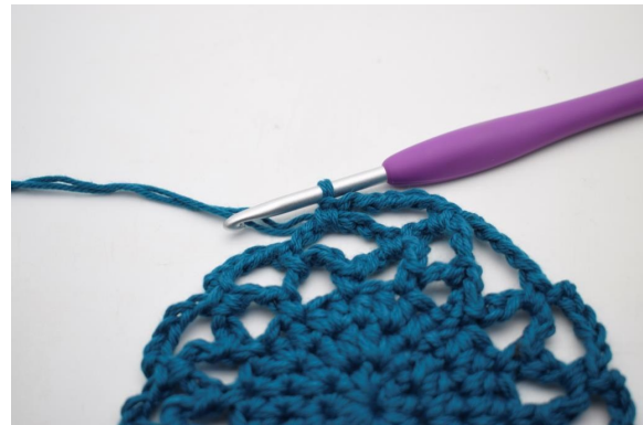
23. In questo modo.