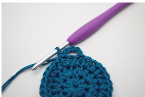
7. In questo modo.