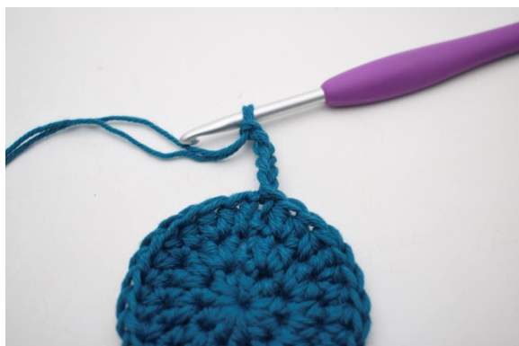
5. "5 cat,