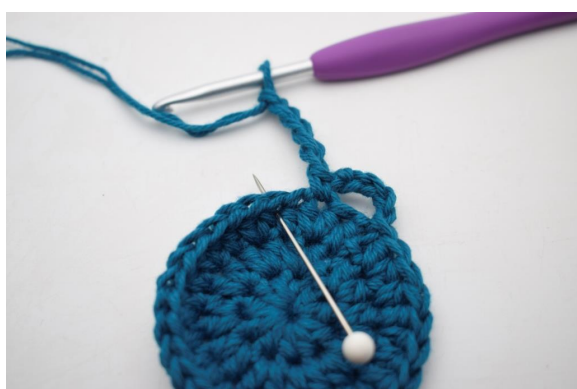
9. Saltare 1 m e lavora 1 mb nella m succ".