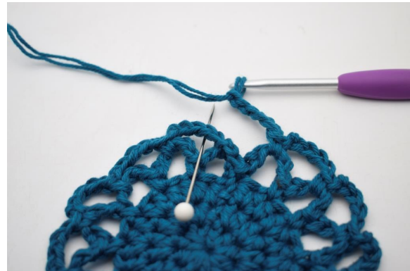
20. Per terminare il giro, lavorare 1 mb nel primo arco di cat fatto in questo stesso giro.