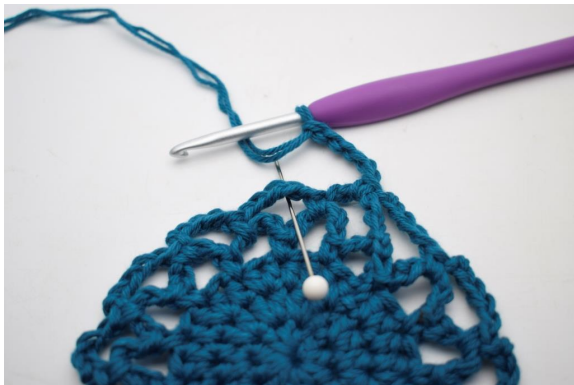
22. "5 cat, lavora 1 mb nel succ arc"