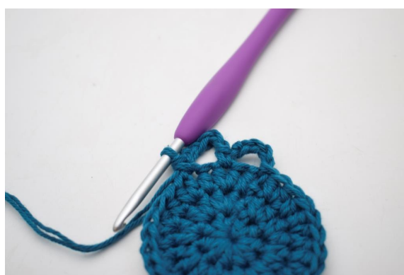
10. In questo modo.