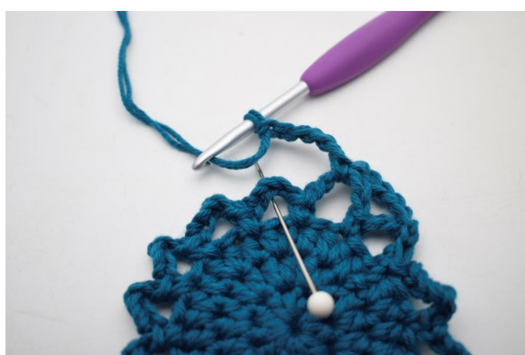
18. "5 cat, lavora 1 mb nel succ arc"