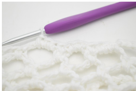
30."Lavorare 1 mb nella m succ, lavorare 3 mb nell'arc di cat seguente".