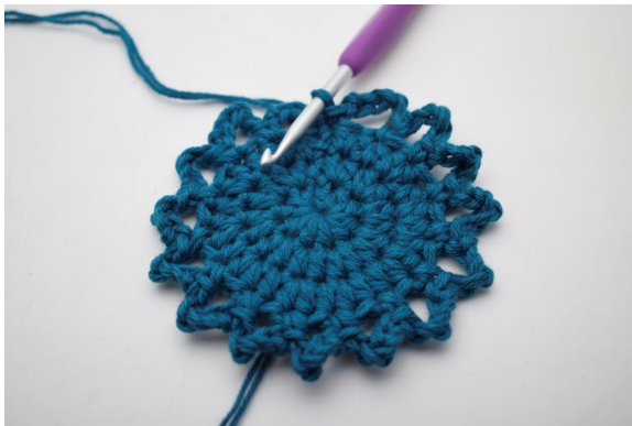
13. In questo modo. (15 arc)