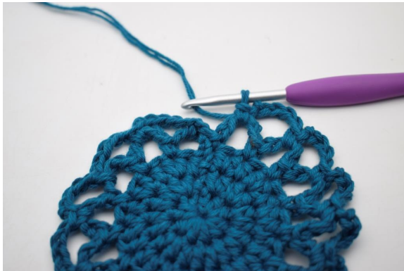
20. Ripetere da "a" fino alla fine del giro.