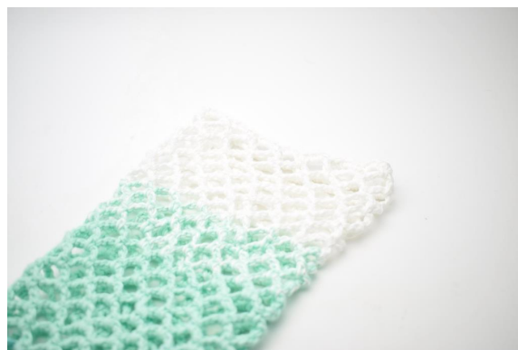
32. Taglia il filo e intreccia le estremità.