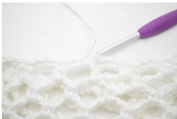
31. Ripetere da "a" fino alla fine del giro. Termina con una mbss. Taglia il filo e intreccia le estremità.