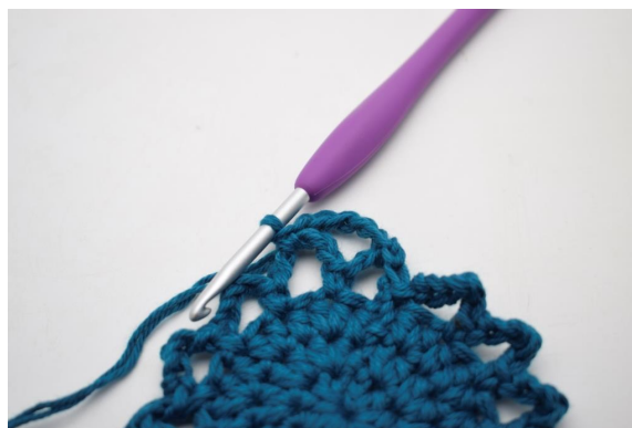
17. In questo modo.