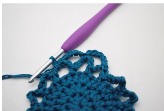
19. In questo modo.