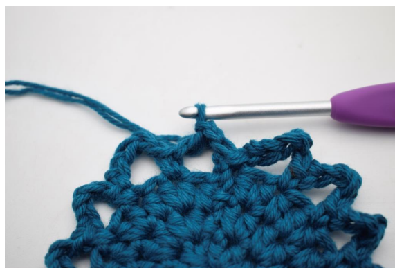
15. In questo modo.