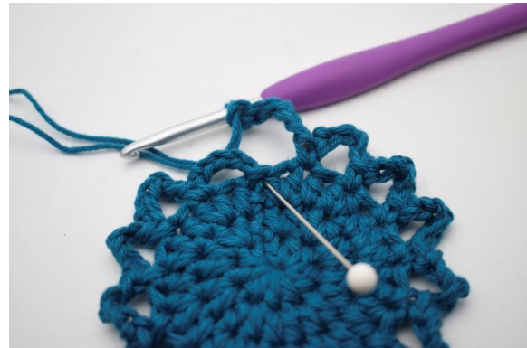
12. Termina con 1 mbss.