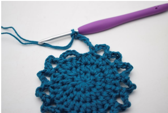
11. "5 cat, saltare 1 m e lavora 1 mb nella m succ". Ripetere da "a" fino alla fine del giro.