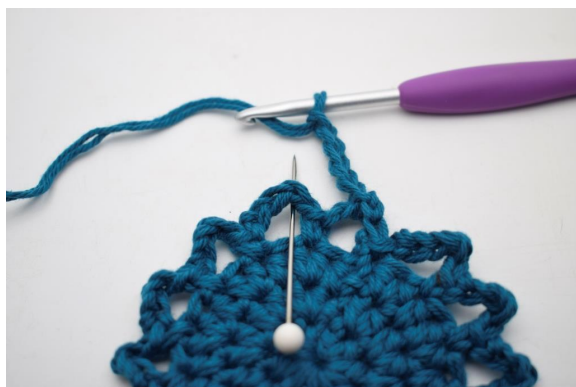
16. "5 cat, lavora 1 mb nel succ arc"