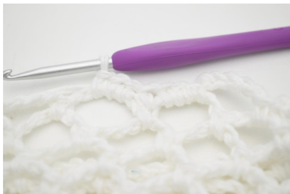
29. Lavorare 3 mb nell'arc di cat seguente".