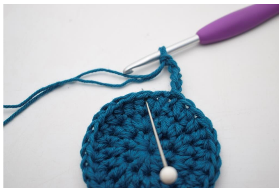
6. Saltare 1 m e lavora 1 mb nella m succ".