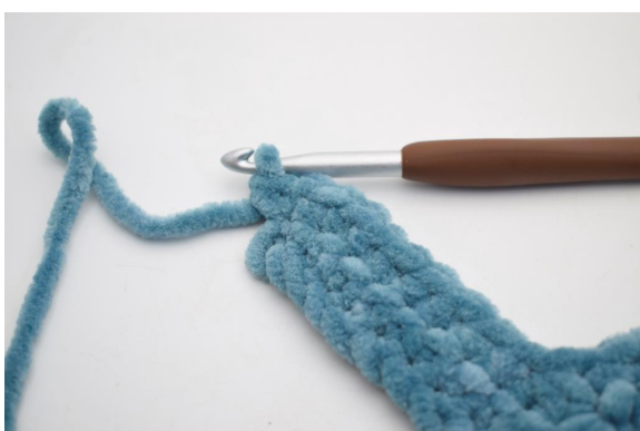
26. Lavora 2 mb nell'ultima m.