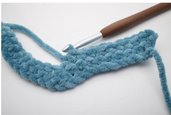
18. "Lavora 1 mb nelle succ 8 m.