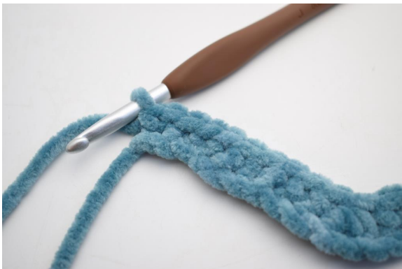
15. Lavora 2 mb nell'ultima cat.