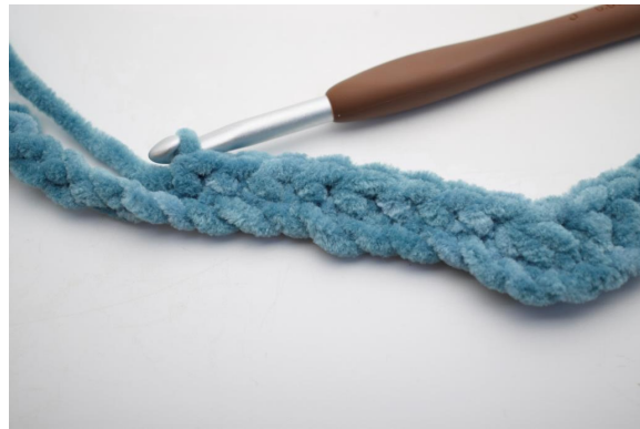
6. Lavora 1 mb nelle succ 8 cat.