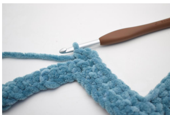
21. Lavora 3 mb nella m seguente".