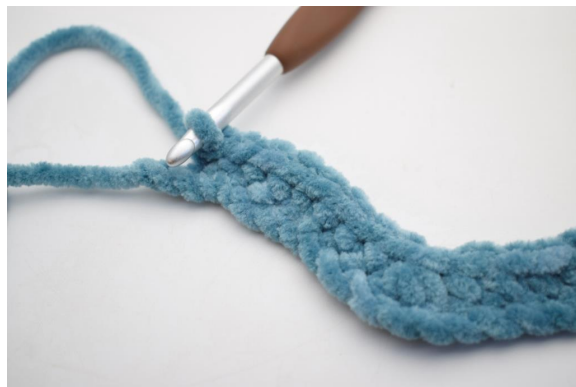
14. Lavora 1 mb nelle succ 8 cat.