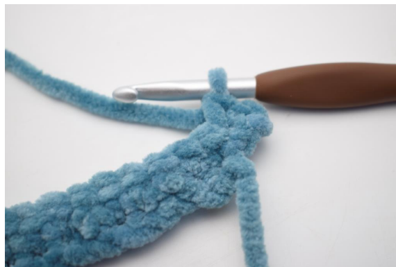
17. Lavora 2 mb nella prima m.