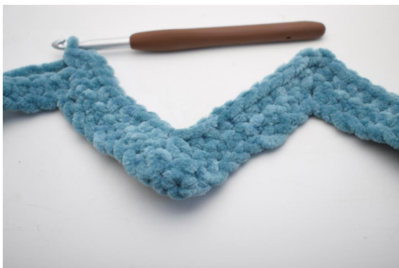
22. "Lavora 1 mb nelle succ 8 m, lavora 3 mb ins. Lavora 1 mb nelle succ 8 m, 3 mb nella m seguente".