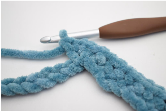
11. Lavora 3 mb nella seguente cat".