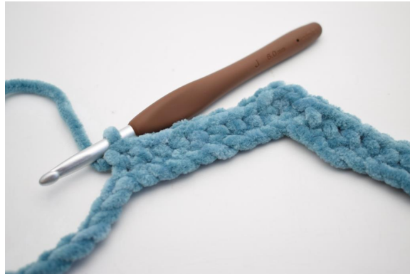
12. Lavora 1 mb nelle succ 8 cat.