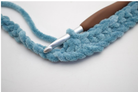
9. Lavora 3 mb ins.