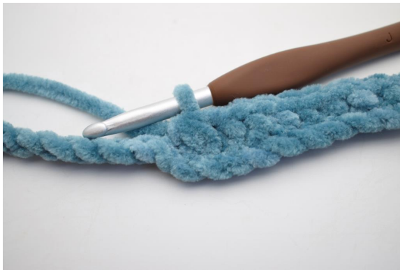
5. Lavora 3 mb ins.