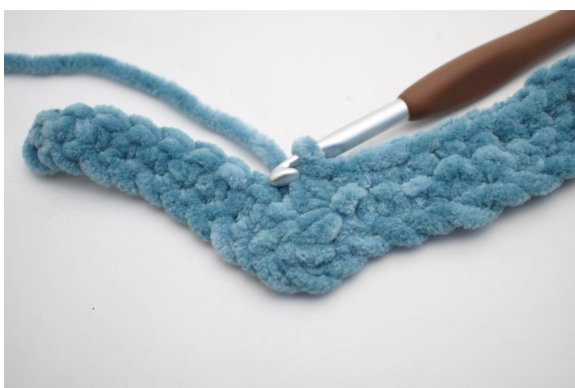
24. Lavora 3 mb ins.