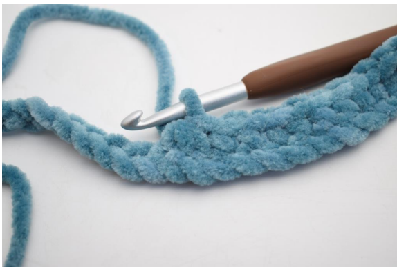
13. Lavora 3 mb ins.