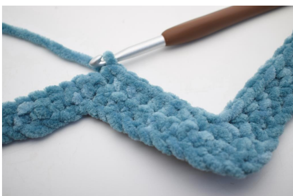
20. Lavora 1 mb nelle succ 8 m.