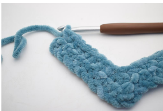
25. Lavora 1 mb nelle succ 8 m.