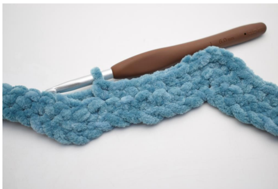
23. Lavora 1 mb nelle succ 8 m.