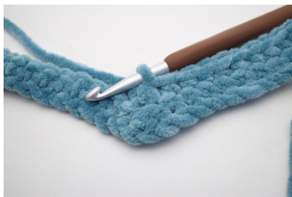
19. Lavora 3 mb ins.