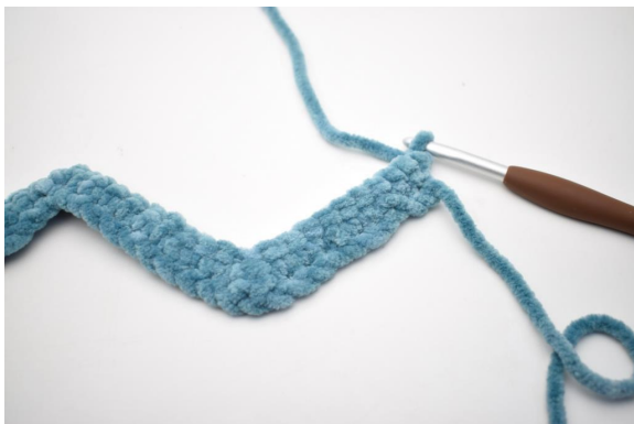
16. 1 cat e gira.