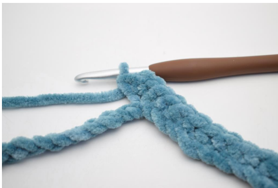
7. Lavora 3 mb nella seguente cat".