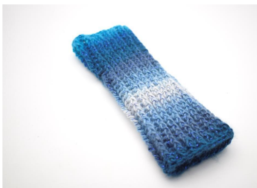
31. Taglia il filo e nascondilo.