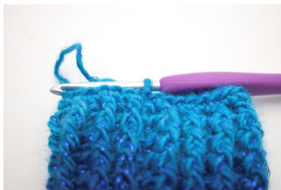
30. Lavora a mb e termina con una m.bss.= 32 (34).