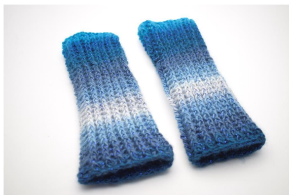
32. Realizzane 1 identico a questo.