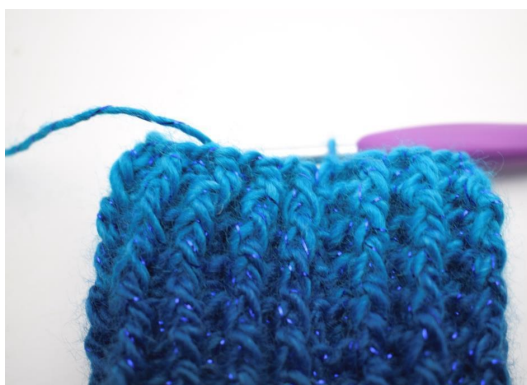
29. Cat 1.