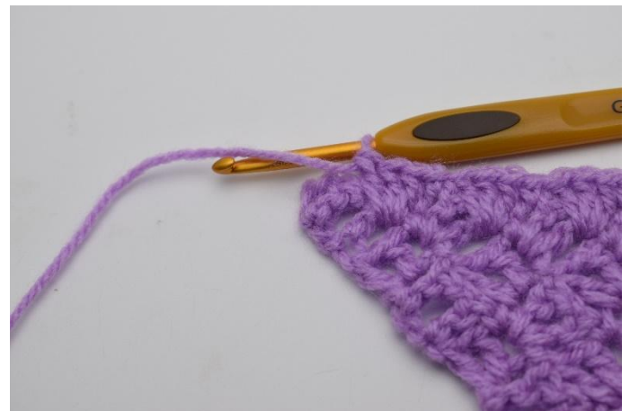
10. Ripeti fino alla fine del giro.