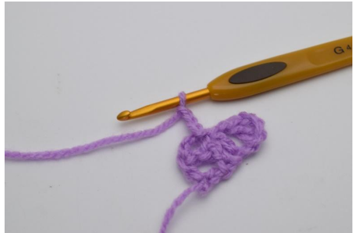
6. 3 Cat.