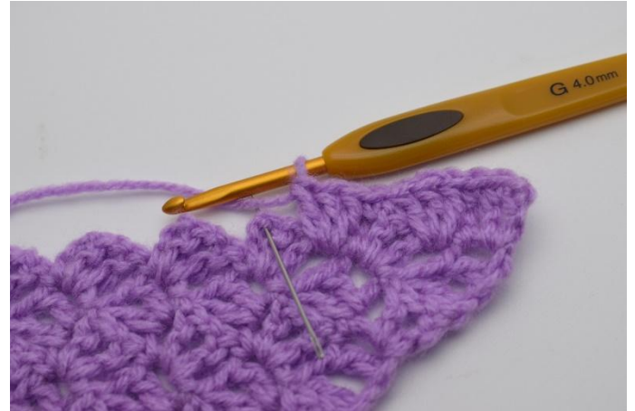
8. Salta 2 ma e lavora 1 mb nell'arco della cat.