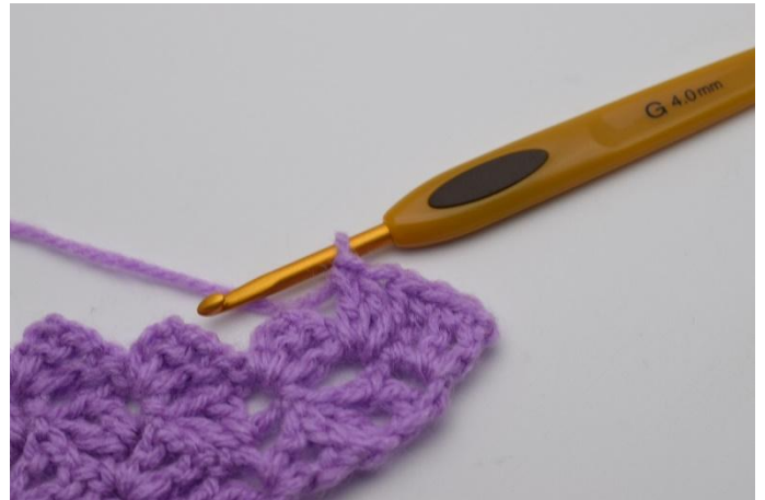
4. Lavora 3 ma.