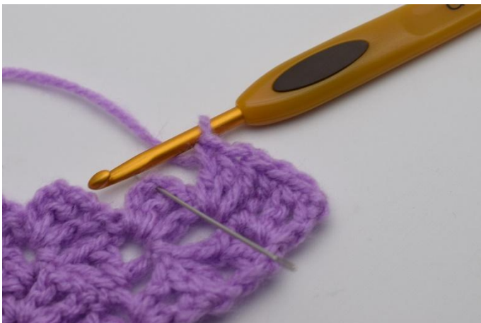
5. Salta 2 ma e lavora 1 mb nell'arco della cat.