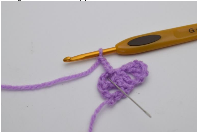
7. Lavora "1 ma, 1 cat e 1 ma" nell'arco della cat dove hai appena fatto una m.bss.