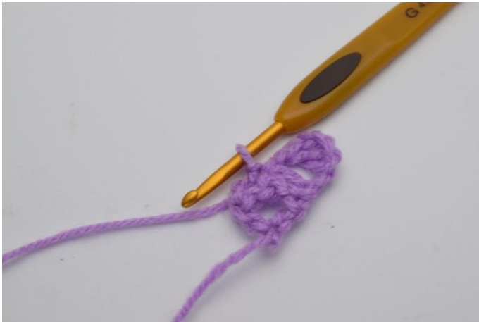
5. Questo è come apparirà.