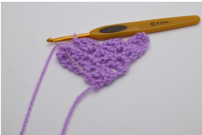
7. Lavora 1 m.bss nel quadrato sotto.