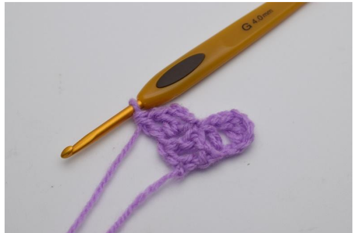
8. Ora hai realizzato un altro "quadrato". E ora hai 2 "quadrati" sul giro 2.