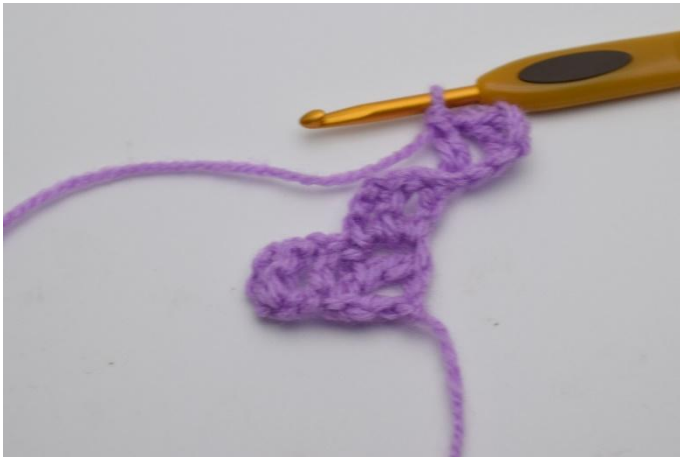
3. 1 Cat e lavora 1 ma nell'ultima cat.