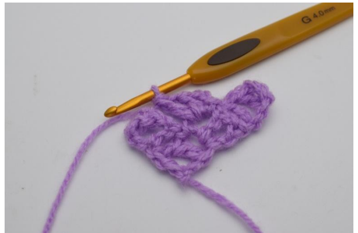
6. Lavora "1 ma, 1 cat e 1 ma" nell'arco della cat dove hai appena fatto una m.bss.