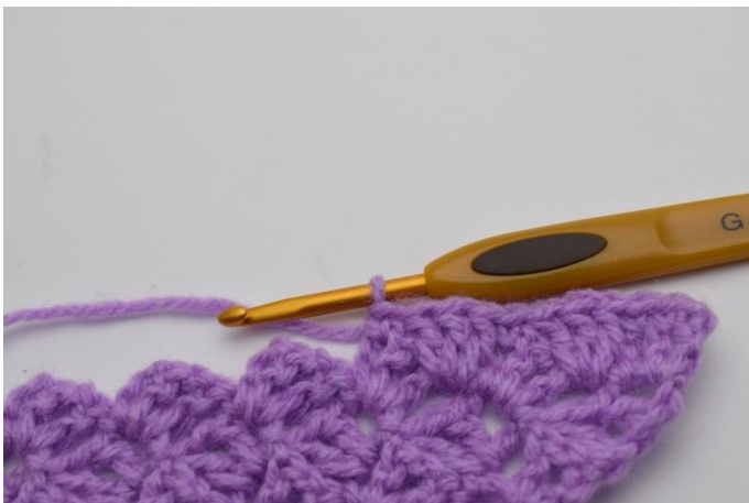
9. Questo è come apparirà.