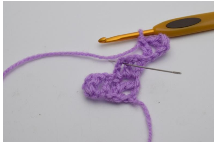
4. Lavora 1 m.bss nel quadrato sotto. L'ago indica dove lavorare la m.bss.