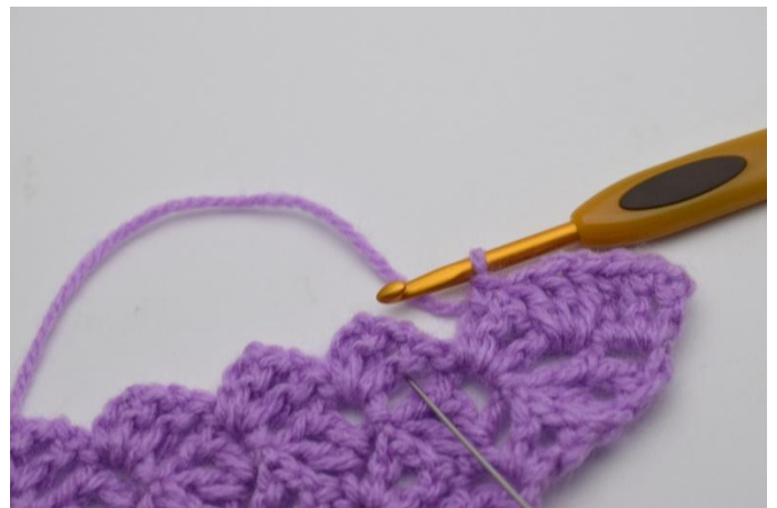
6. Questo è come apparirà. Lavora 3 ma tra i "quadrati" dei precedenti 2 giri. L'ago mostra dove lavorare.