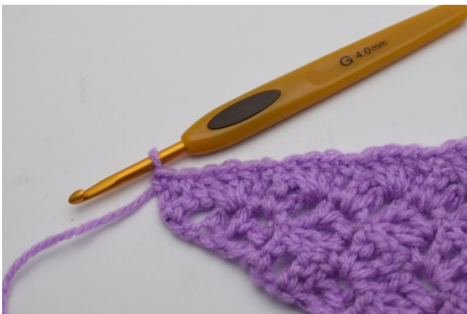
11. Termina con mb nelle ultime ma. Taglia il filo e nascondilo.