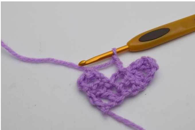
5. 3 cat.