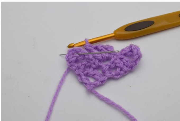
7. Lavora 1 m.bss nel quadrato sotto. L'ago indica dove lavorare la m.bss.