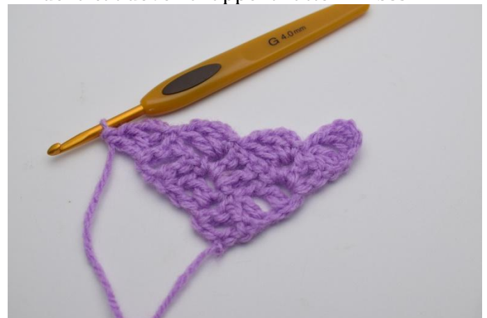
8. 3 Cat e lavora 1 ma, 1 cat e 1 ma giù nell'arco della cat dove hai appena fatto 1 m.bss.