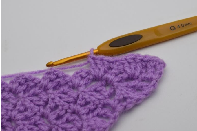
7. Questo è come apparirà.