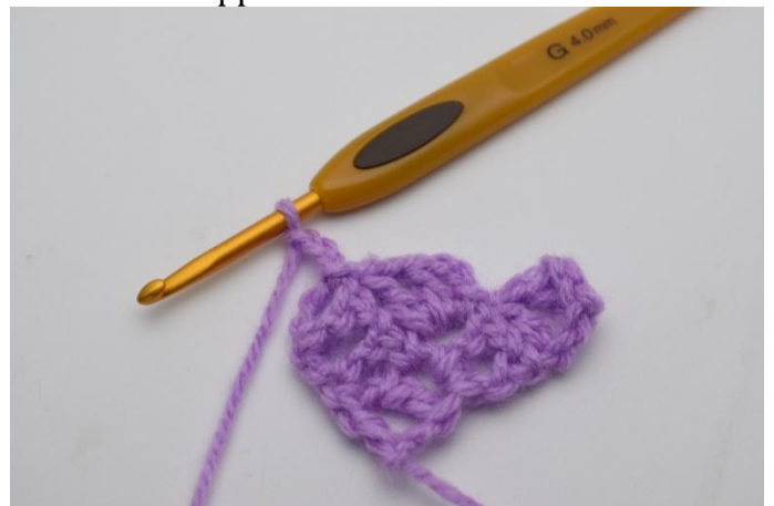
8. 3 Cat.