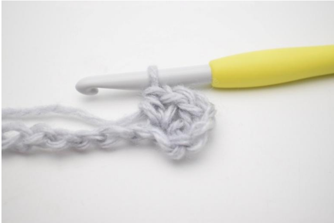
3. In questo modo.