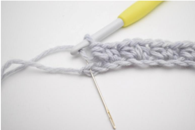
9. Saltare 1 cat e lavorare 1 mma nell'ultima m.