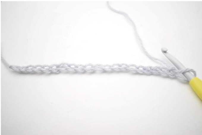
1. Lavora la catenella di base.