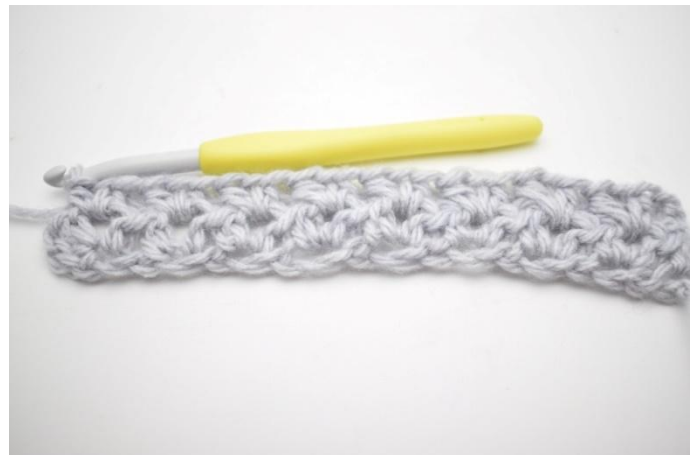
6. Ripetere da "a" fino alla fine del giro.