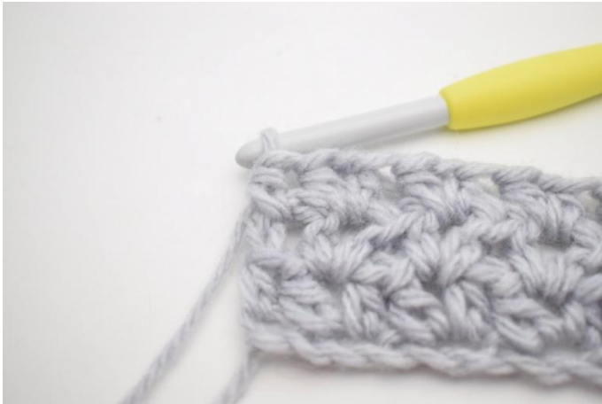
5. In questo modo.