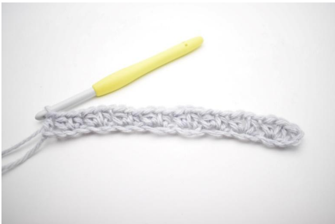
11. Questo è il primo giro.