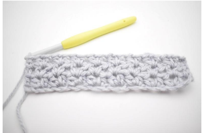
6. Questo è il terzo giro.