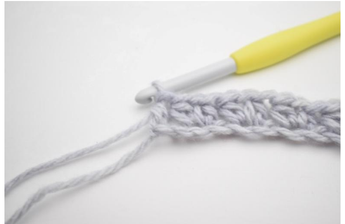
10. In questo modo.