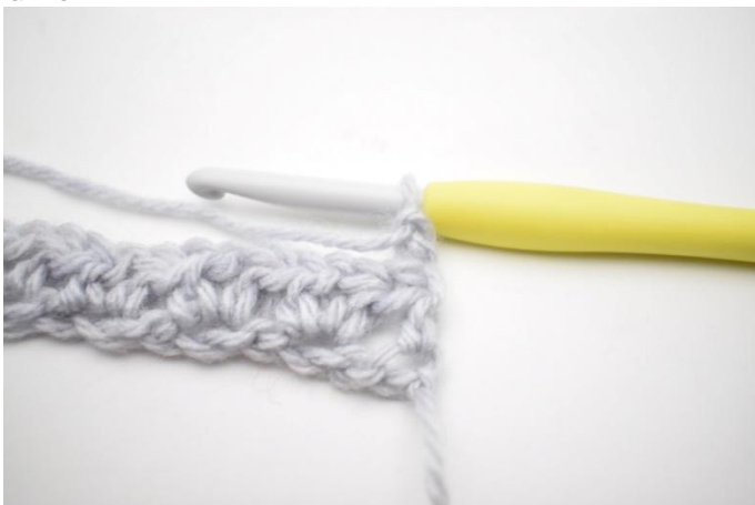
1. Gira e 2 cat.