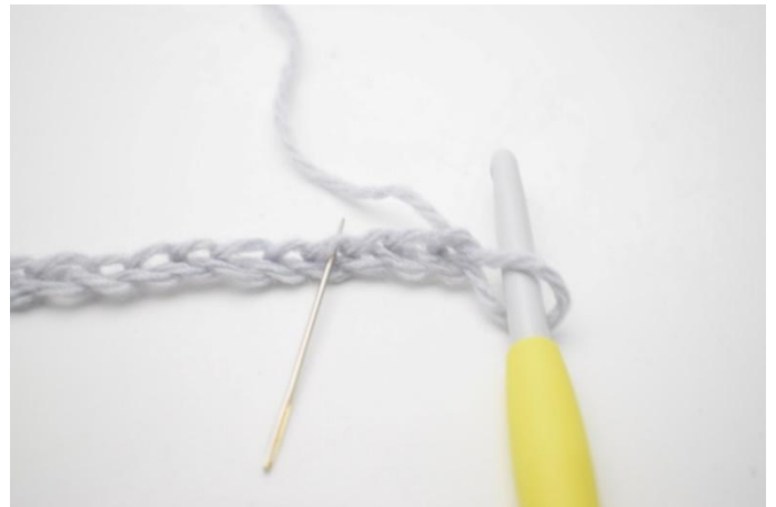
2. Lavora nella 4a cat dell'uncinetto, 1 mma 1 cat e 1 mma. L'ago indica dove lavorare la m.