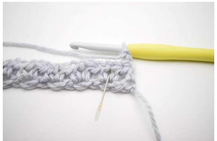
2. "Lavora 1 mma, 1 cat e 1 mma nell'arch. del giro precedente". L'ago indica dove lavorare la maglia.