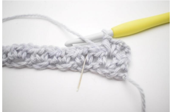
4. "Lavora 1 mma, 1 cat e 1 mma nell'arch. del giro precedente."