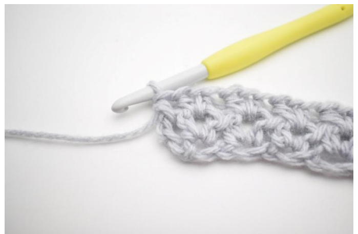
8. In questo modo.