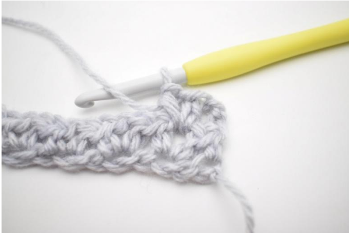
3. In questo modo.