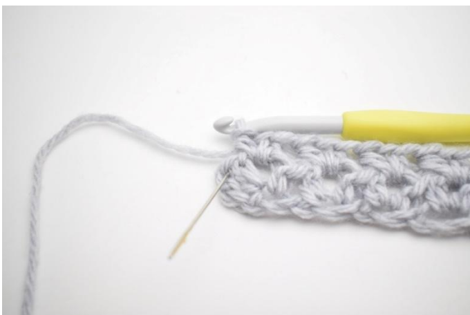
7. Lavora 1 mma nell'ultima m.