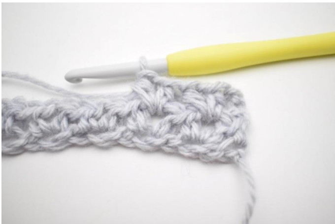
5. In questo modo.