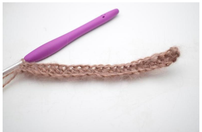
4. Lavora mma fino alla fine del giro. = 76(81)86 m.