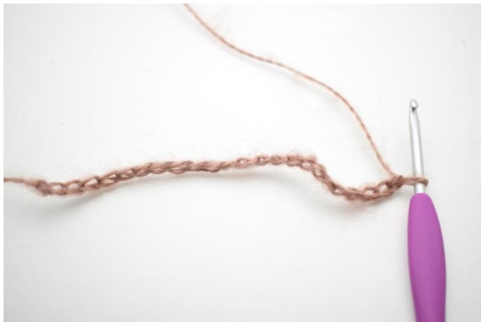
1. Cat 77(82)87.