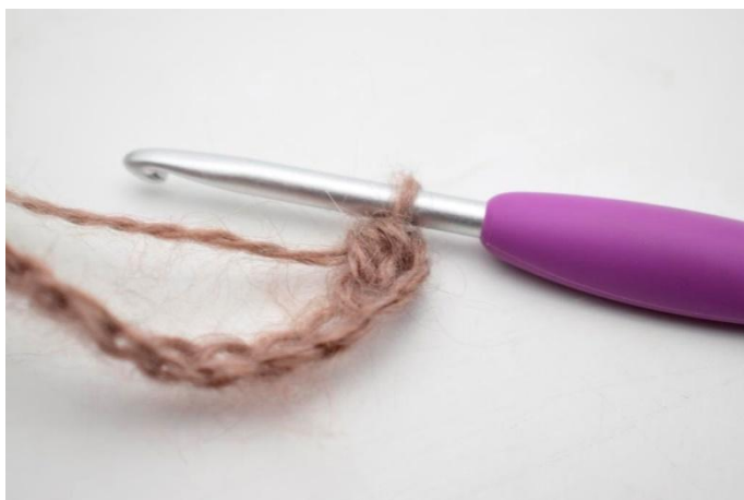
3. Ecco come apparirà.