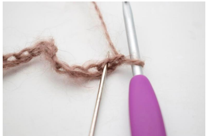
2. Lavora 1 mma nella 2° cat dall'uncinetto.