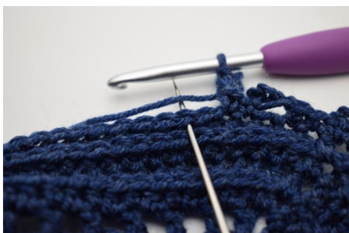
17. Salta 1 m e lavora 1 mb nella m succ”.