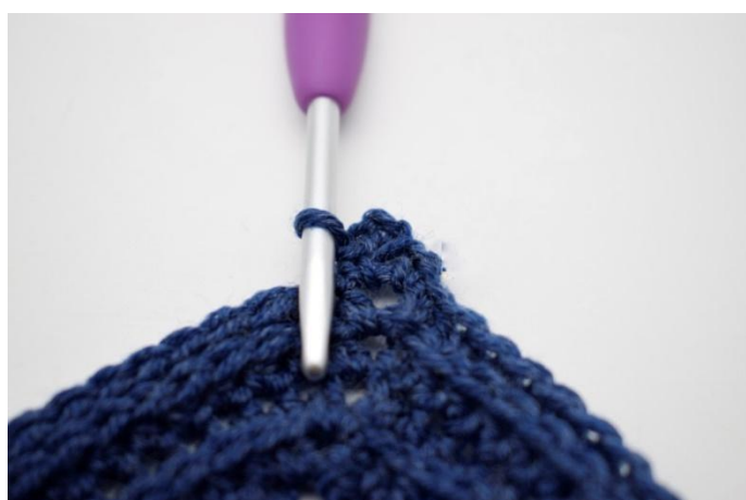
6. Lavora 1 mb nello spazio di cat- angolo.