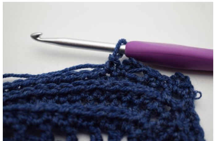
14. "Lavora 1 mb nella m succ.