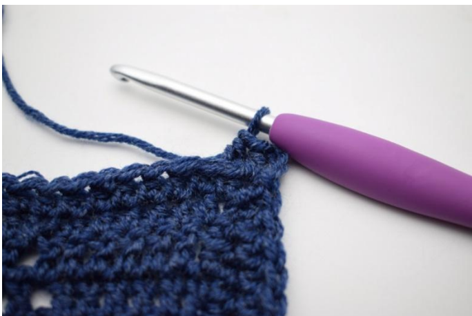
5. In questo modo.