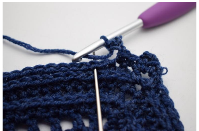
12. Salta 1 m e lavora 1 mb nella m succ”.