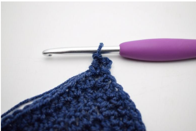
3. Lavora 1 mma nello spazio di cat-angolo