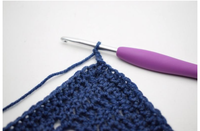
2. 3 cat.