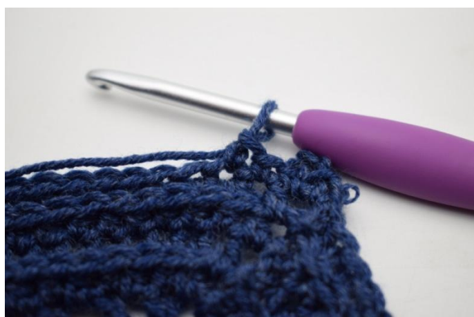
8. "Lavora 1 mb nella m succ.