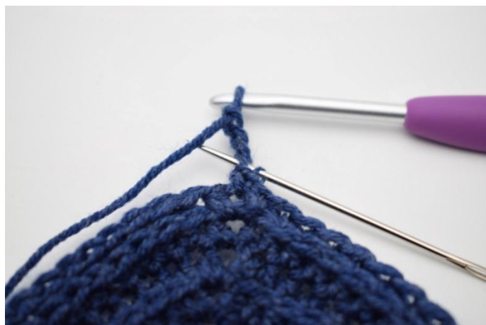
4. Lavora 1 mbss nello spazio di cat- angolo.