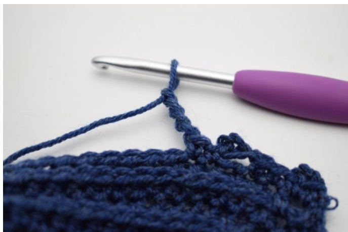
15. 4 cat.