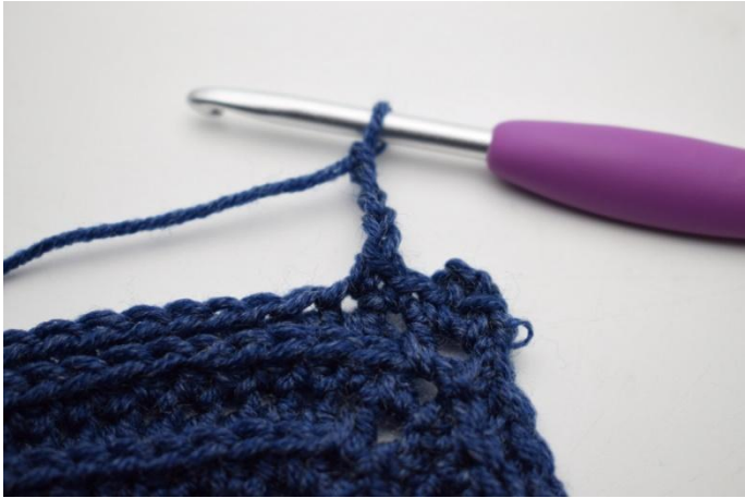
9. 4 cat.