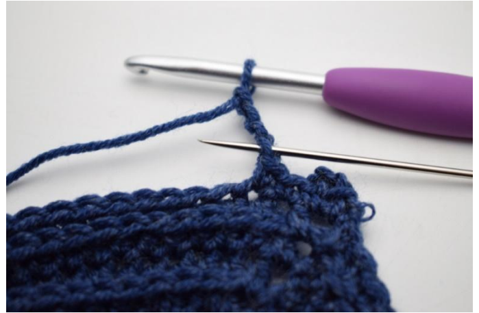
10. Lavora 1 mbss nella 1a cat.