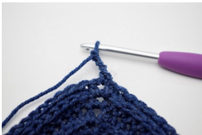
3. 4 cat.