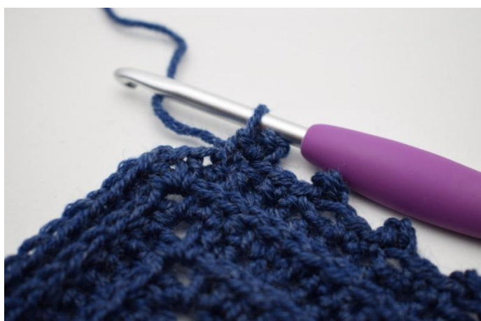
19. Ripetere ”per” 59 volte in totale.