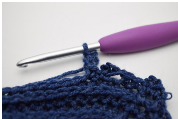
16. Lavora 1 mbss nella 1a cat.