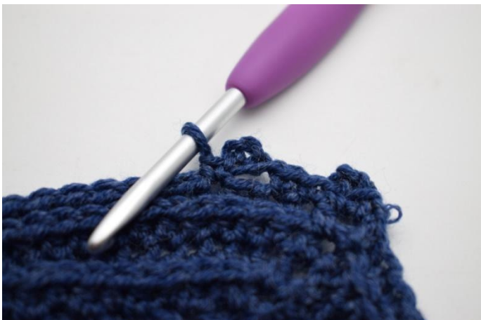
13. In questo modo.