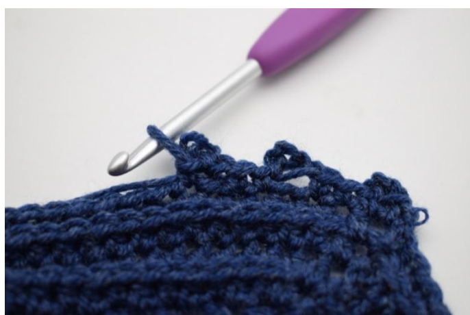
18. In questo modo.