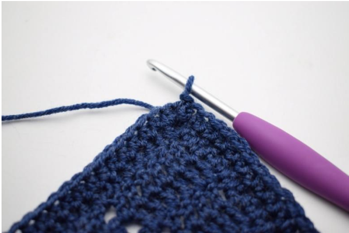
1. Lavora 1 mbss nello spazio di cat-angolo