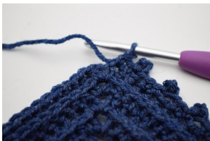
20. Lavora 1 mb nella m succ.