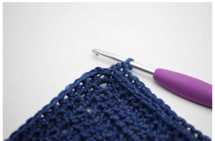
6. "Lavora 1 mma post nelle 161 m fino all'angolo.