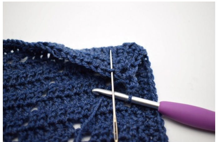
4. Lavora 1 mma post. È l'asola posizionata dietro a l'asola anteriore. Qui, l'ago indica dove lavorare 1 mma.