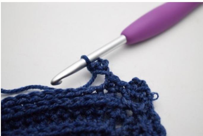
11. In questo modo.