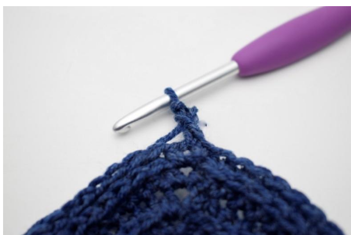
5. In questo modo.