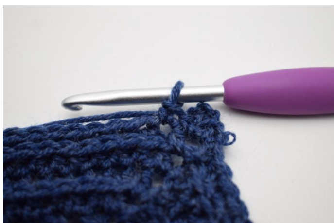
7. (Lavora 1 mb nella 1a m.