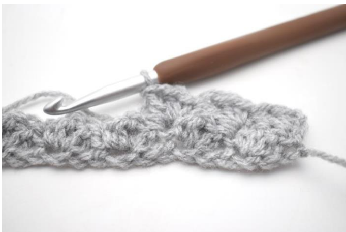
17. In questo modo.