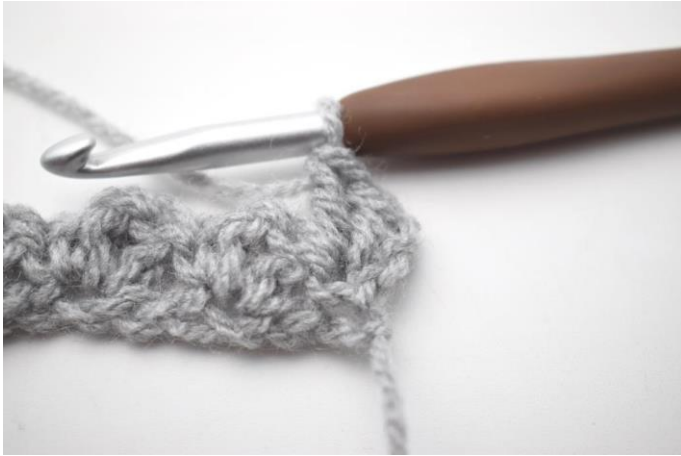
13. In questo modo