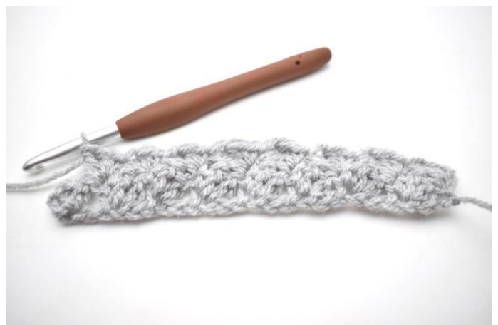
18. * Saltare 2 m, fare 1 mb e 2 ma nella m succ *. Ripetere da *a* fino alla fine del giro.