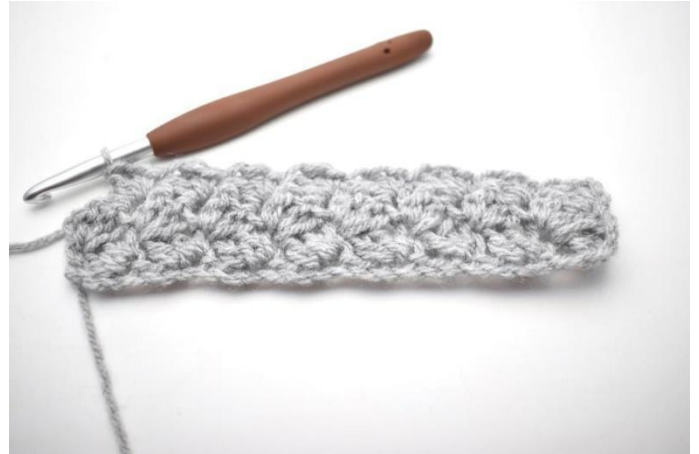
26. Saltare 2 m, fare 1 mb e 2 ma nella m succ *. Ripetere da *a* fino alla fine del giro.