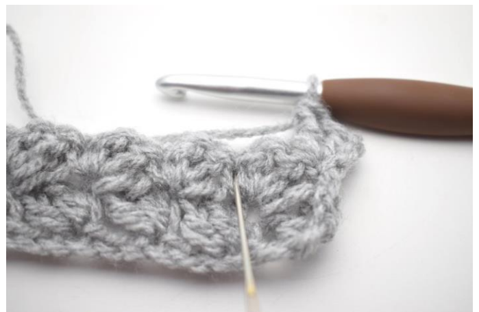
24. * Saltare 2 m, fare 1 mb e 2 ma nella m succ *.