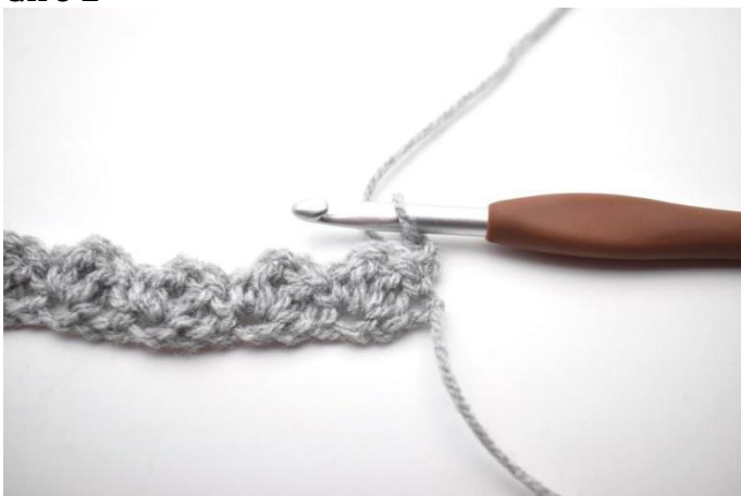
11. Giro con 2 cat.