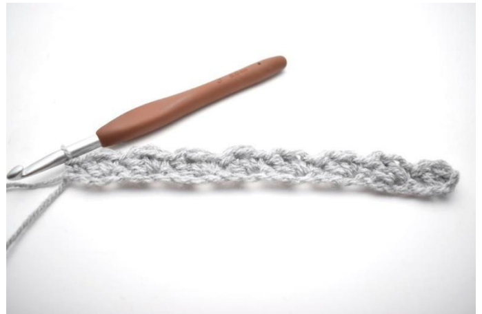
10. In questo modo.