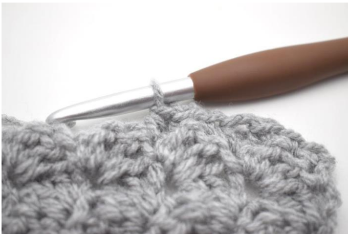
34. mma nella m succ *,