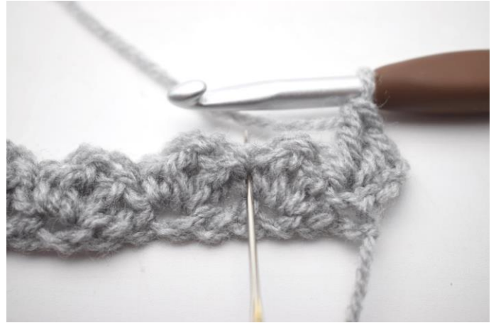
14. * Saltare 2 m, fare 1 mb e 2 ma nella m succ*.