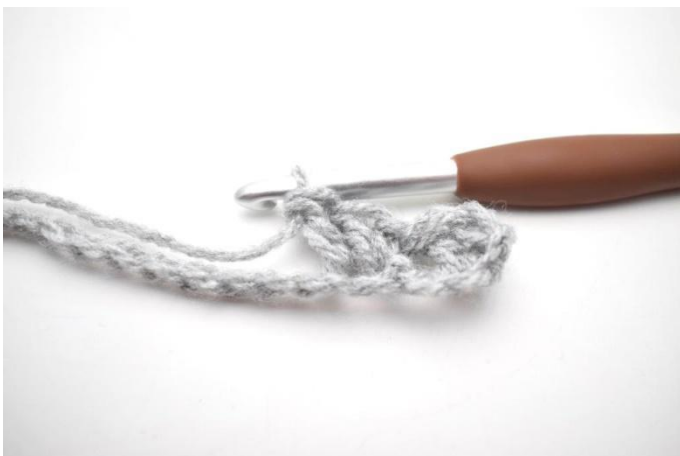
5. In questo modo.