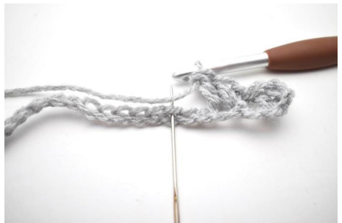
6. * Saltare 2 m, fare 1 mb e 2 ma nella m succ *.