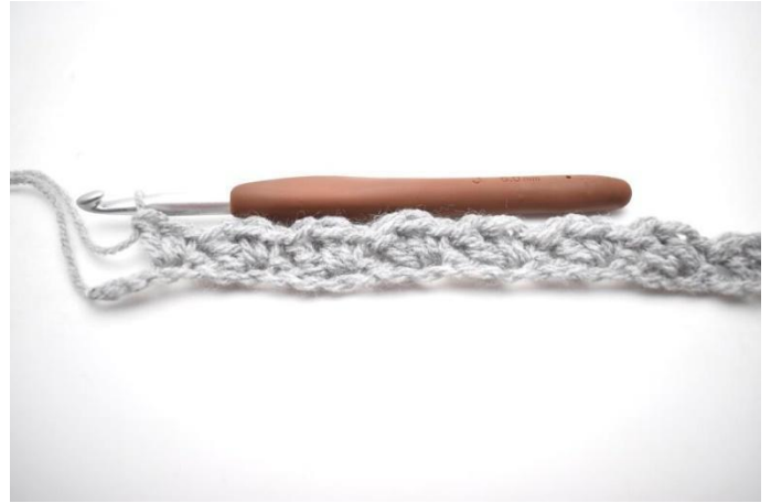
8. Ripetere da *a* fino a quando rimangono 2 m sul giro.