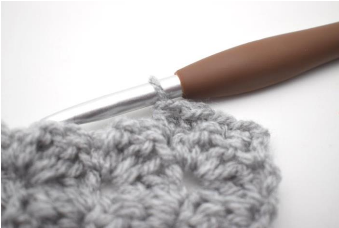
32. mma nella m succ.