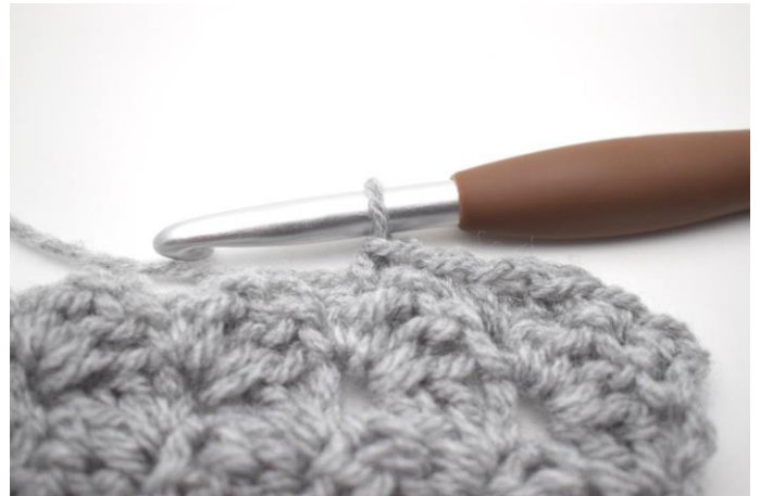
33. * mb nelle 2 m succ,