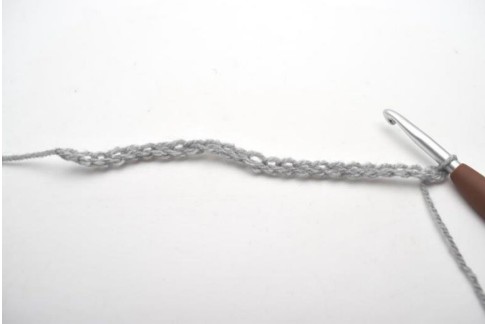
1. 206 cat.