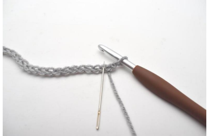
2. Fare 2 ma nella 3a cat dell'uncinetto.