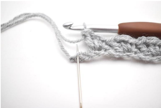
9. Saltare 1 m e mb nell'ultima m.