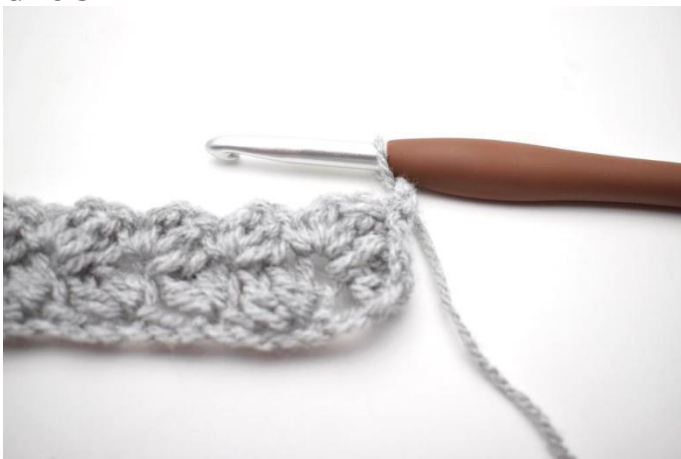
21. Lavora questo giro come il giro 2. Gira con 2 cat.