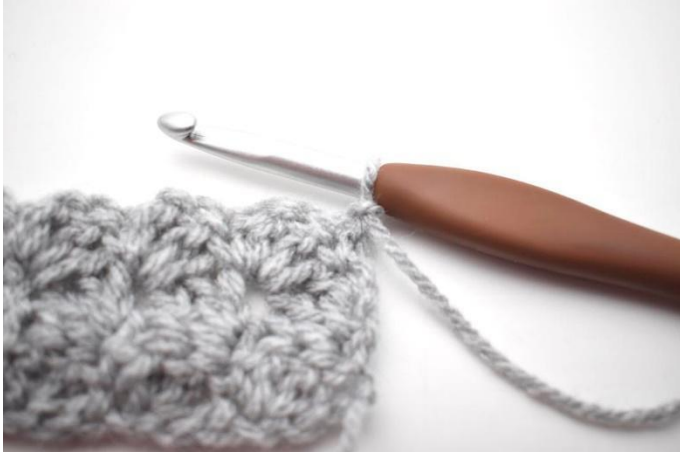
30. Gira il lavoro e fai 1 cat.