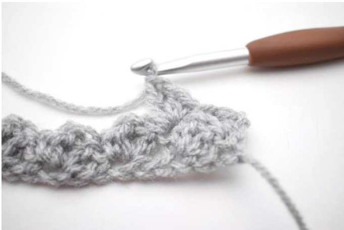
15. In questo modo.