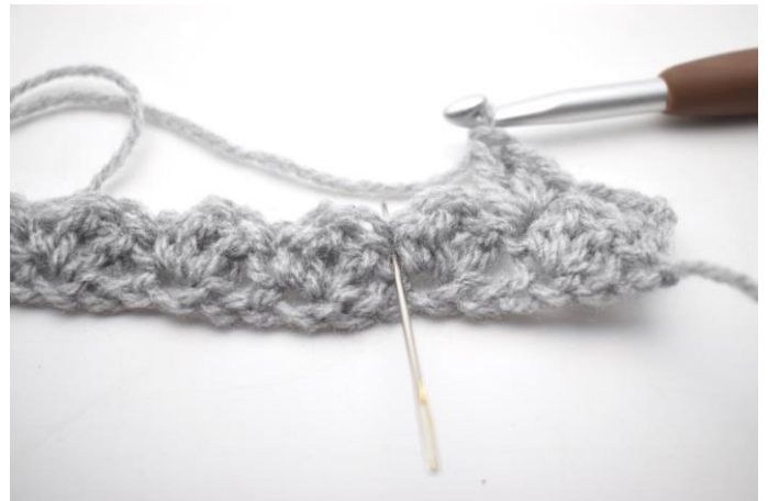
16. * Saltare 2 m, fare 1 mb e 2 ma nella m succ*.