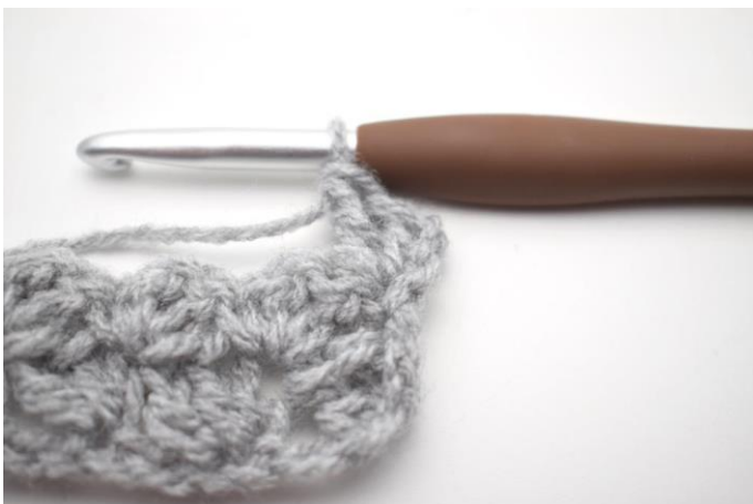
23. In questo modo.