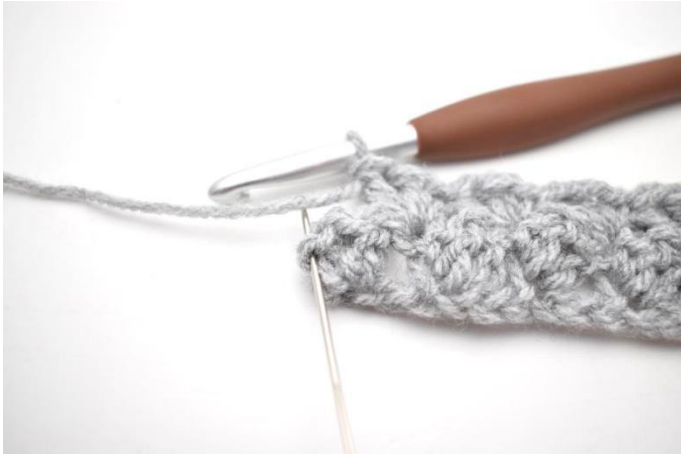
19. Fare 1 mb nell'ultima m.