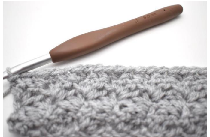
35. * mb nelle 2 m succ, mma nella m succ *. Ripetere da *a* fino alla fine del giro. Taglia il filo e intrecciare le estremità.