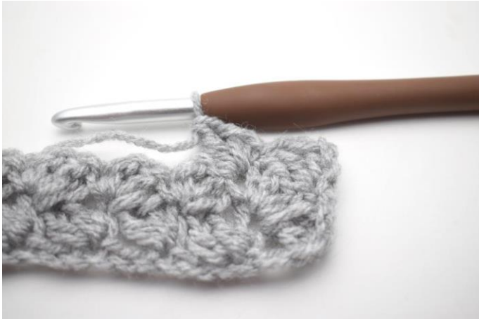
25. In questo modo.