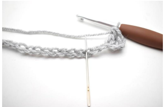
4. * Saltare 2 m, fare 1 mb e 2 ma nella m succ *.