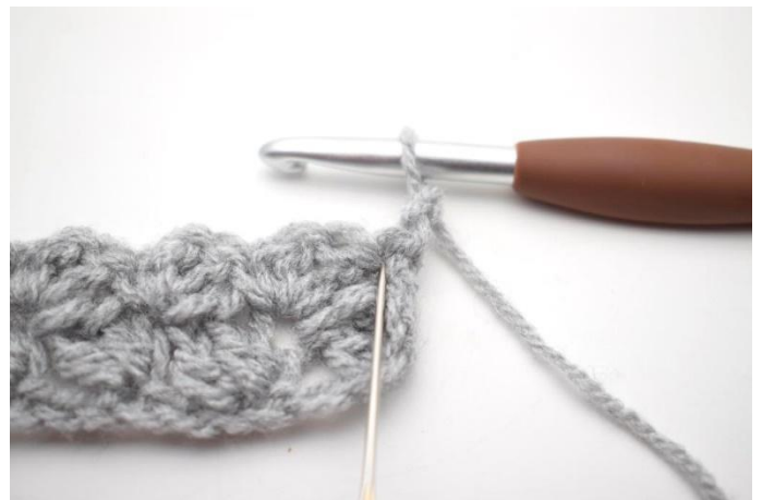
22. Fare 2 ma nella prima m.