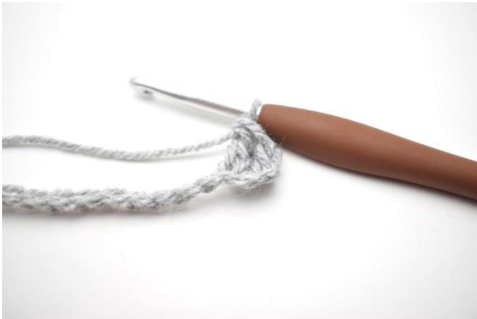
3. In questo modo.