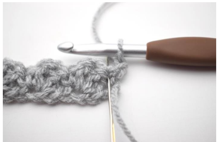
12. Fare 2 ma nella prima m.