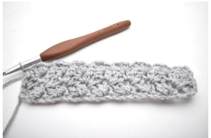
28. In questo modo.