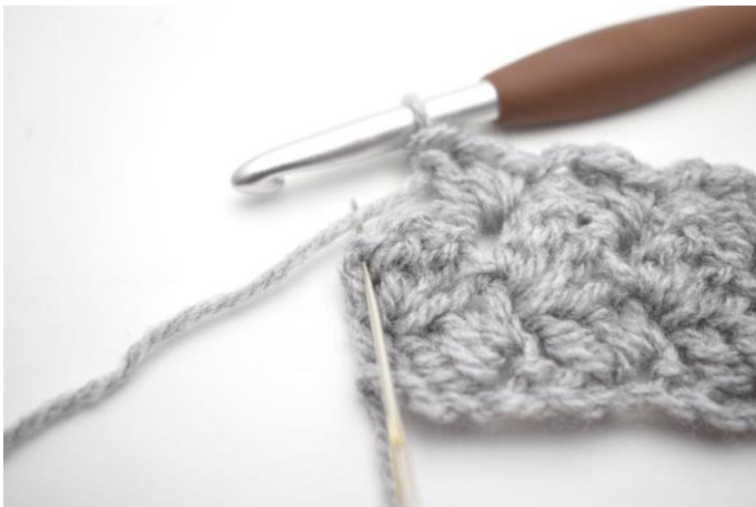
27. Fare 1 mb nell'ultima m.