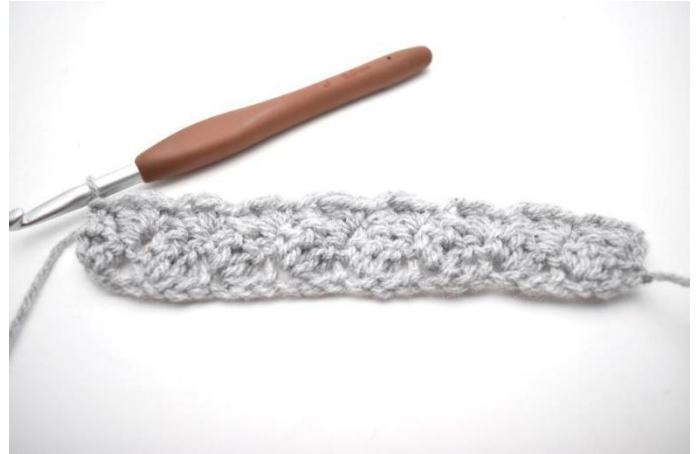
20. In questo modo.