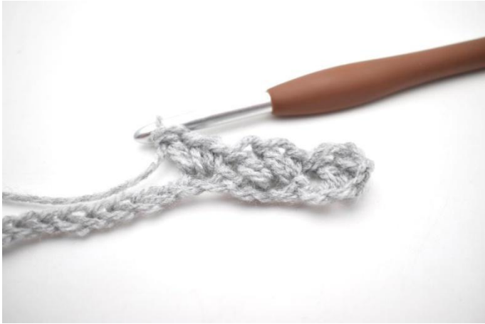
7. In questo modo.