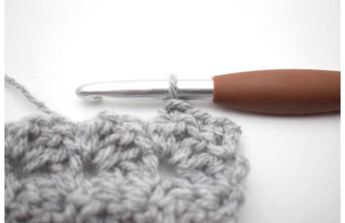
31. mb nelle prime 3 m.