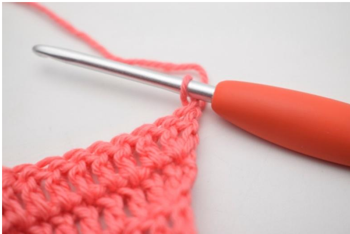
1. 1 cat e gira.