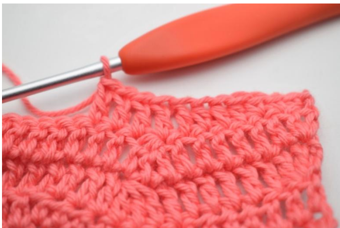
3. ma nelle 5 m succ.