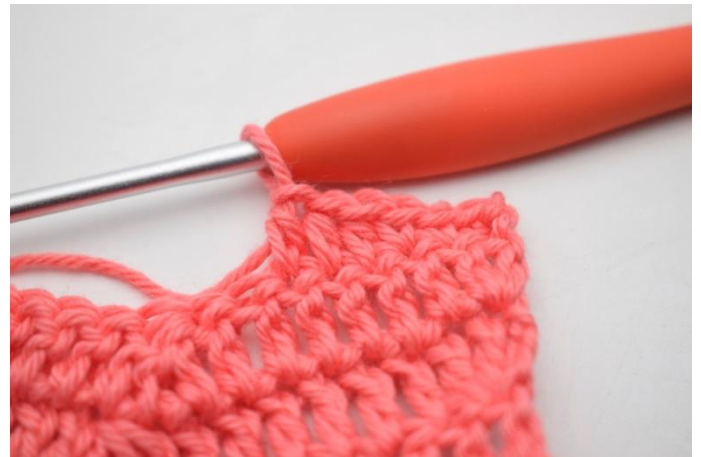
2. mma nelle 3 m succ.