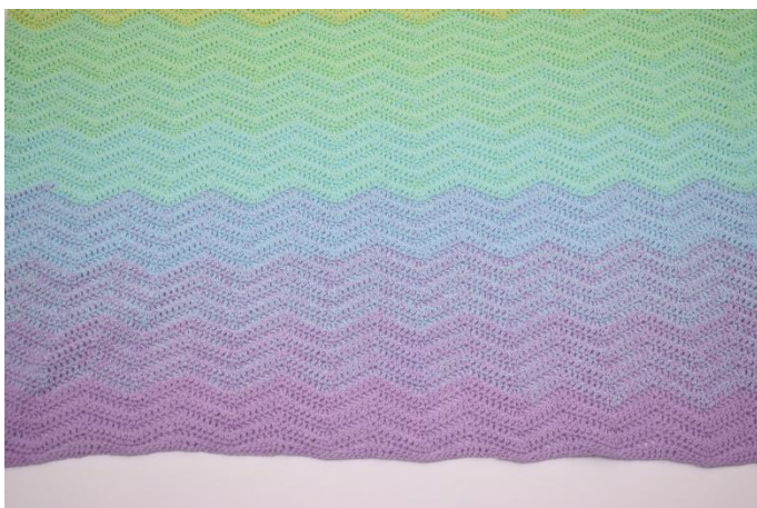
Ripetere il giro del motivo fino a quando hai 90 giri in totale.