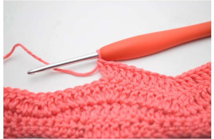
14. 3 ma nella m succ.