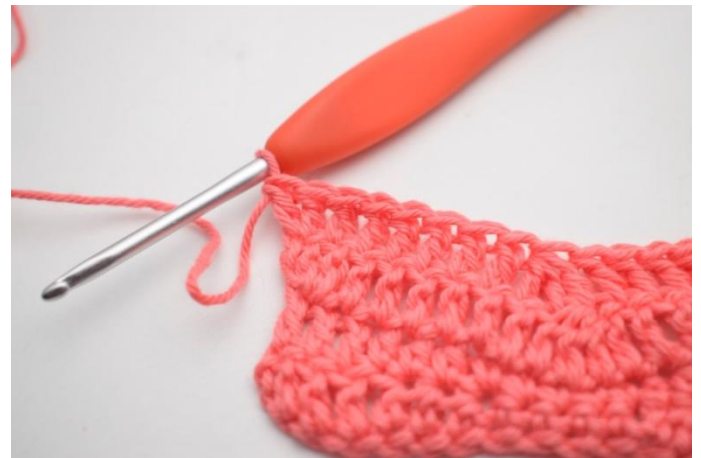
16. In questo modo.