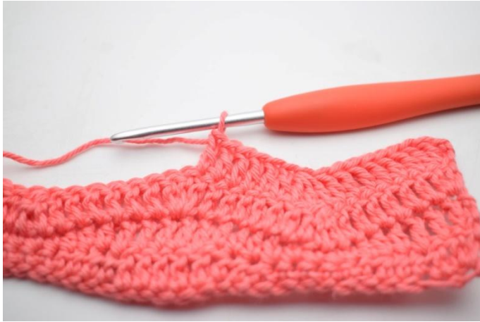
13. ma nelle 6 m succ.