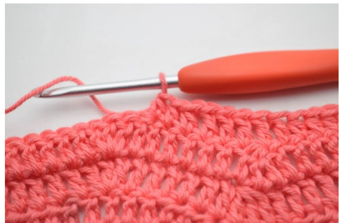
4. mma nelle 3 m succ.