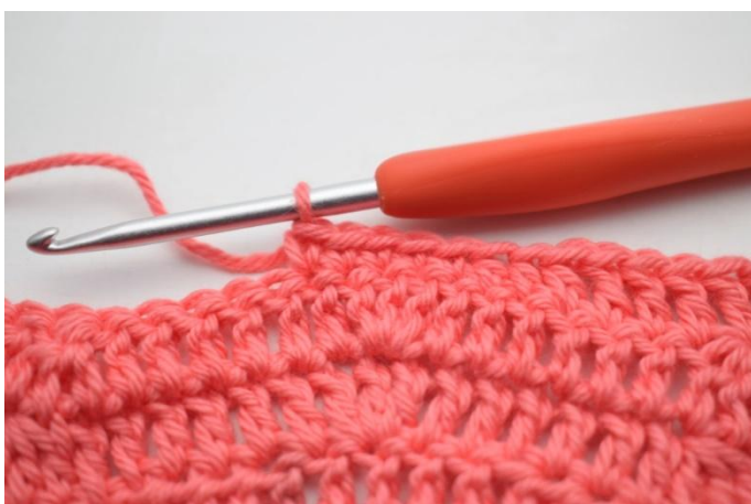
5. mb nelle 5 m succ.