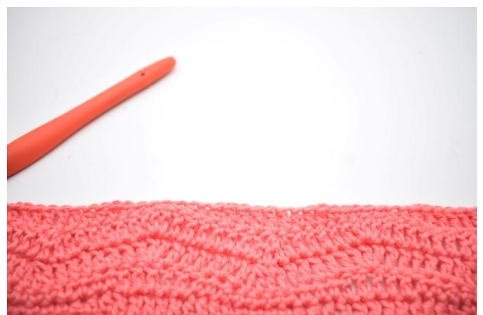
6. * mma nelle 3 m succ, ma nelle 5 m succ, mma nelle 3 m succ, mb nelle 5 m succ *. Ripetere da *a* fino alla fine del giro.