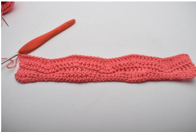
15.* ma nelle 6 m succ, 3 ma ch ins, ma nelle 6 m succs, 3 ma nella m succ*. Ripetere da *a*, ma termina con 2 ma nell'ultima m.