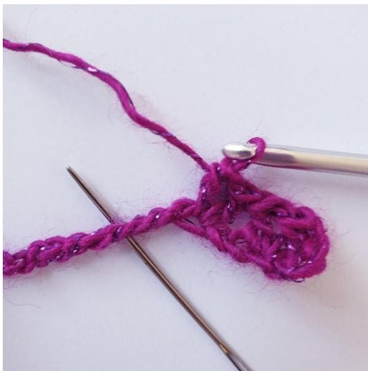
ripetere [saltare 2 m, p-V nella m succ]