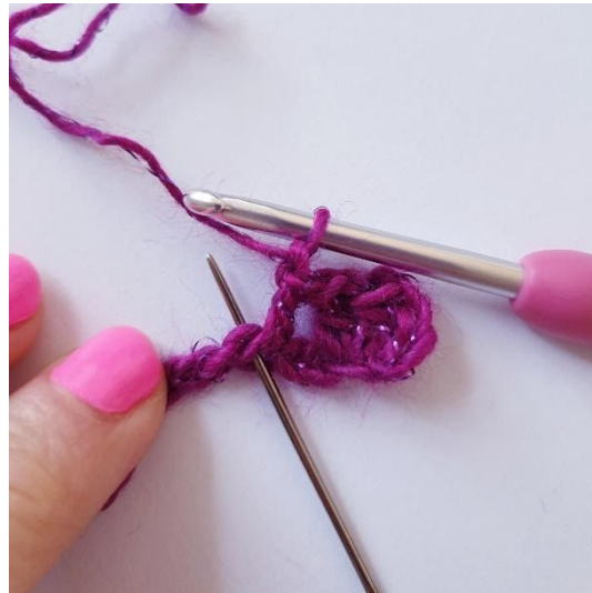
1 cat, 1 ma nella stessa m