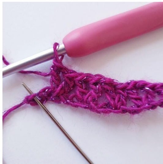
Quando mancano 2 m saltare 1 m