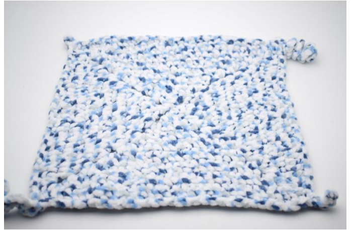
39. Taglia il filo e intrecciare alle estremità.