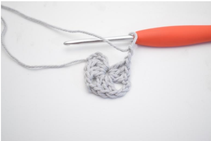
3. Ripetere da * a * 3 volte in totale.