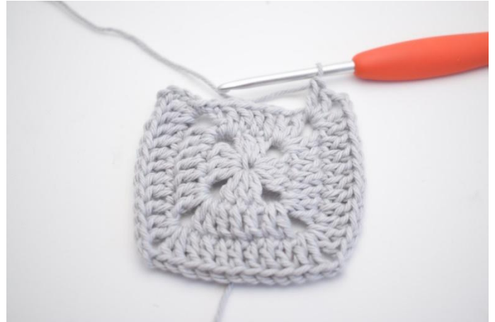
13. Ripetere da * a * 3 volte in totale.