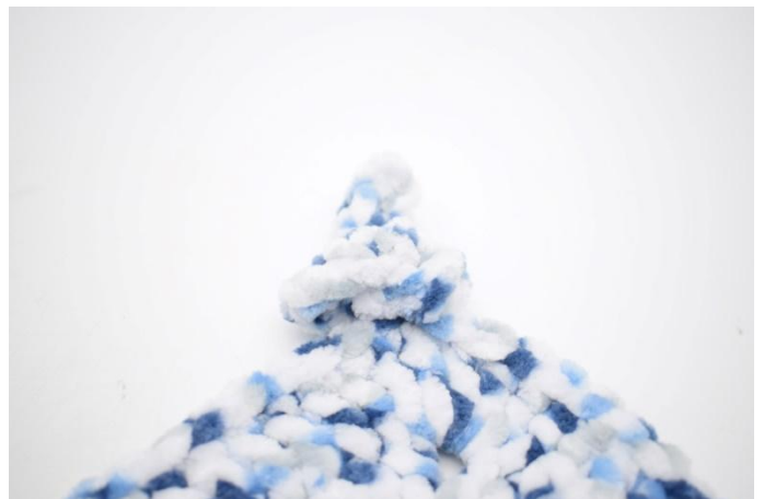
4. In questo modo.