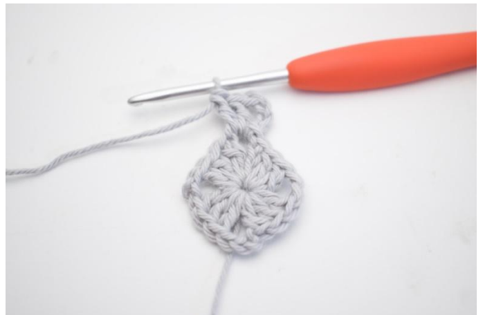
6. 4 cat, 2 ma nello sp-cat.