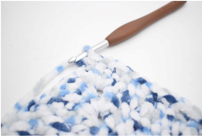
32. 1 mb nelle 32 m succ.