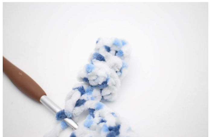
37. In questo modo.