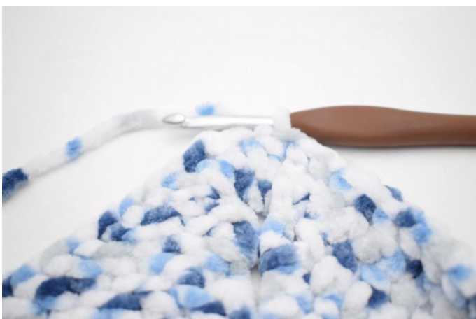
25. Ripetere da * a * 3 volte in totale. 1 ma nelle 27 m succ, 1 ma nello sp-cat dell'inizio del giro. 1 mbss nella 3a cat.