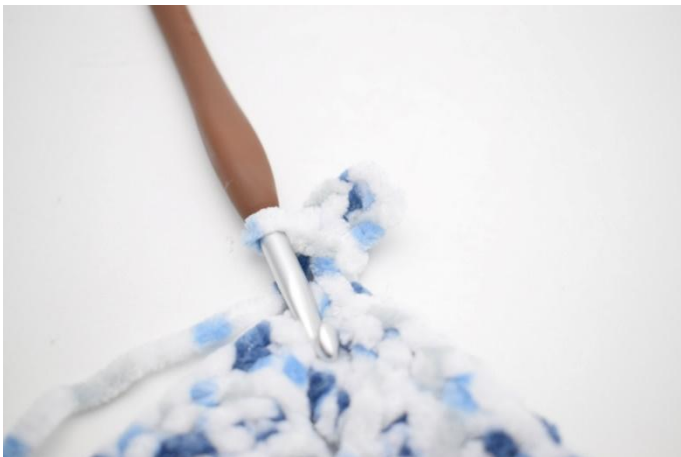
28. In questo modo.