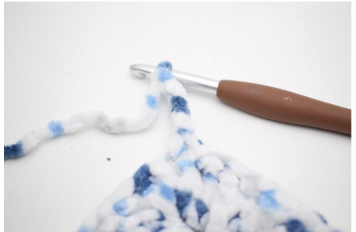
27. 4 cat, 1 mb nella 2 cat dell'uncinetto, 1 mb nelle 2 cat succ.