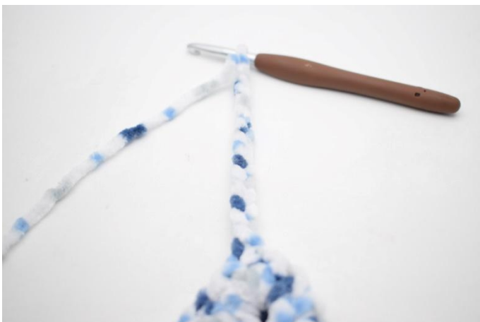
36. 15 cat, 3 mb nella 2a cat dell'uncinetto, 3 mb in ogni 12 cat succ.