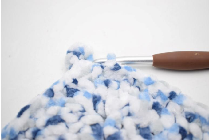
38. 1 mb nelle 30 m succ, 1 mbss.