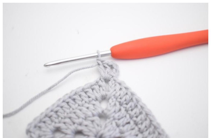
16. 4 cat, 2 ma nello sp-cat.