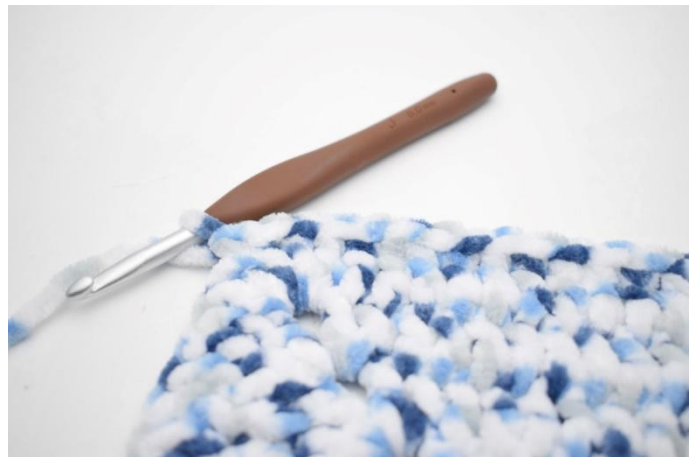
29. 1 mb nelle 32 m succ.