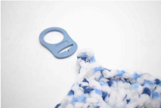
1. Nel primo angolo, collegare l'adattatore salva ciuccio.