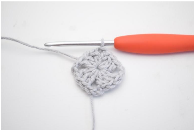
5. 1 mbss nello sp-cat.