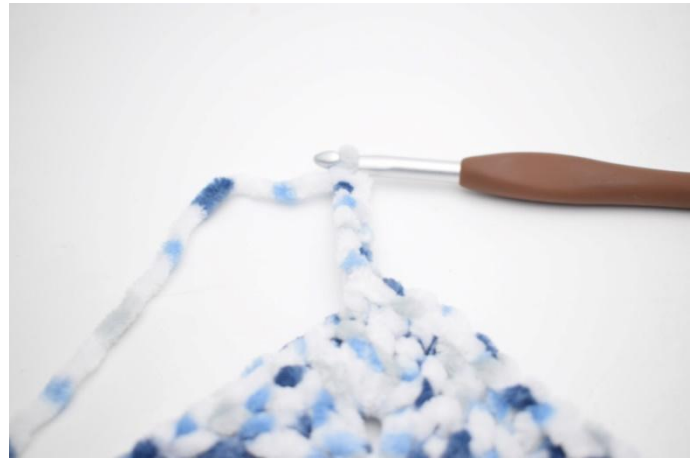
33. 6 cat, 1 mb nella 2a cat dell'uncinetto, 1 mb nelle 4 cat succ.