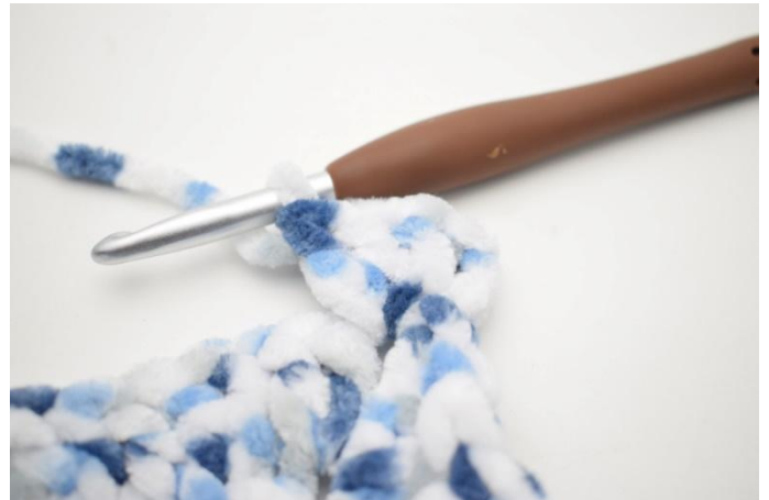
22. 3 ma nello sp-cat.