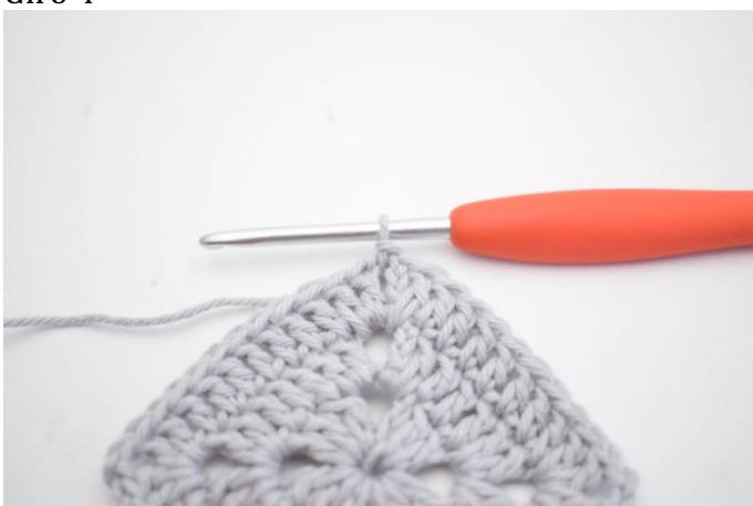
15. 1 mbss nello sp-cat.