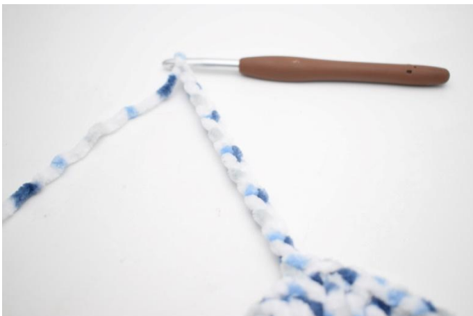
30. 15 cat, 1 ma nella 3a cat dell'uncinetto, 1 ma nelle 12 cat succ.