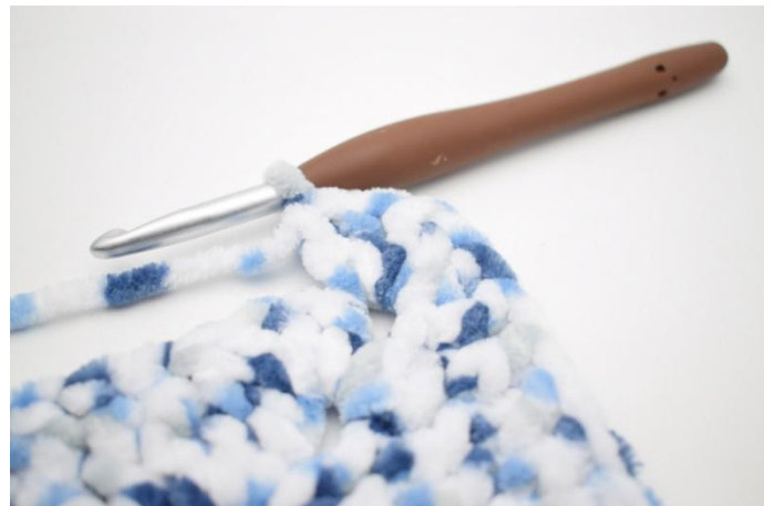
24. 5 ma nello sp-cat*.