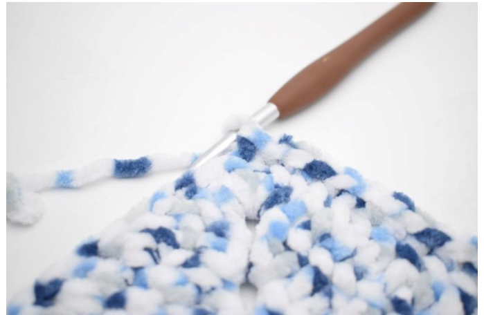
35. 1 mb nelle 32 m succ.