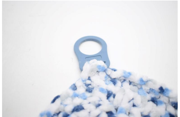
2. Piegare *la punta appuntita* attorno all'apertura e cucire.