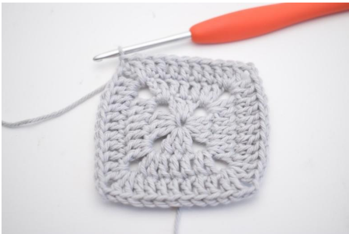
14. 1 ma nelle 7 m succ, 1 ma nello sp-cat dell'inizio del giro. 1 mbss nella 3a cat.