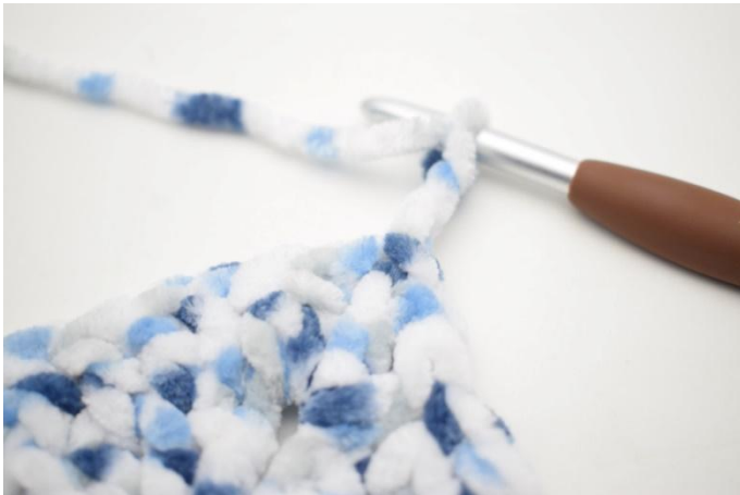
21. 1 mbss nello sp-cat, 3 cat.