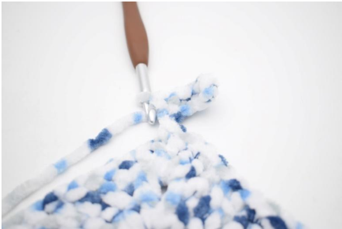
34. In questo modo.