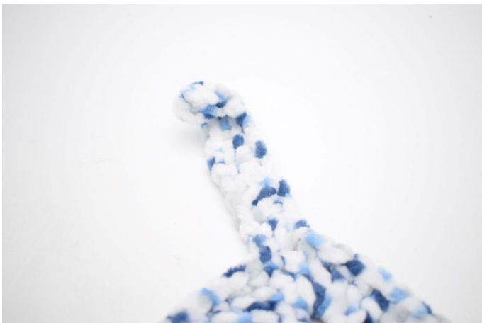
3. Nell'angolo succ, fare un nodo.