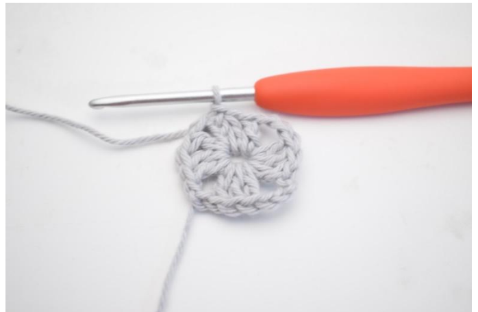
4. 2 ma, 1 mbss nella 3a cat dell'inizio del giro.