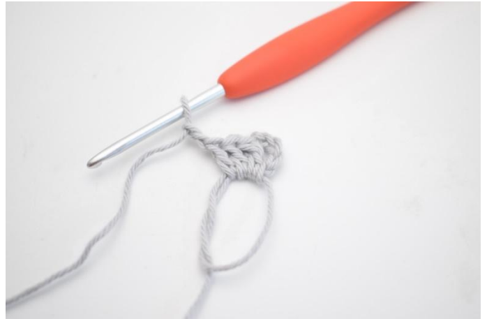
2. *3 ma, 3 cat*.