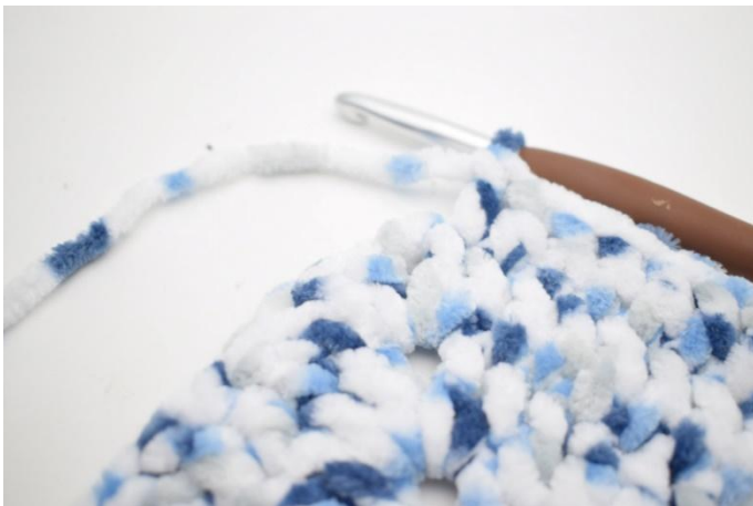
23. **1 ma nelle 27 m succ.