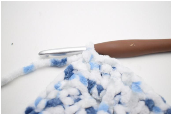
26. 1 cat, 1 sc nella prima m.