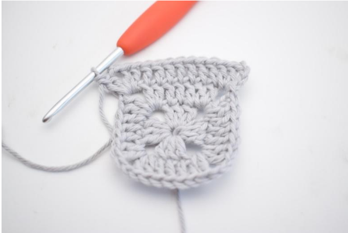
12. *1 ma nelle 7 m succ, 2 dc, 2 cat, 2 ma nello sp-cat*.