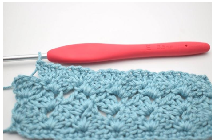
45. Ripetere da * a * 13 volte in totale.