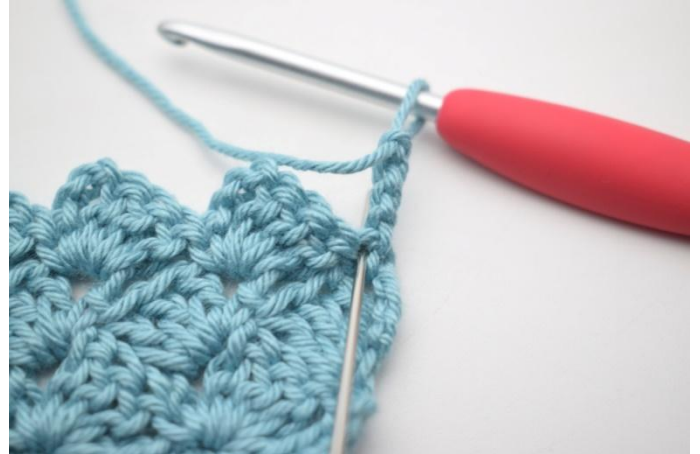
35. 2 ma nella prima m.