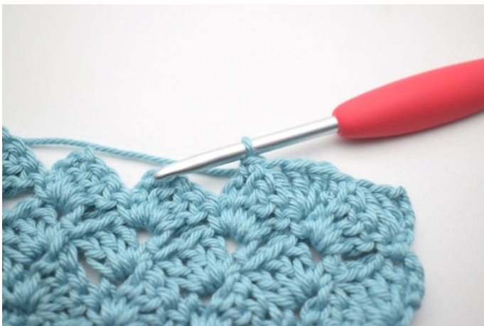
42. In questo modo.