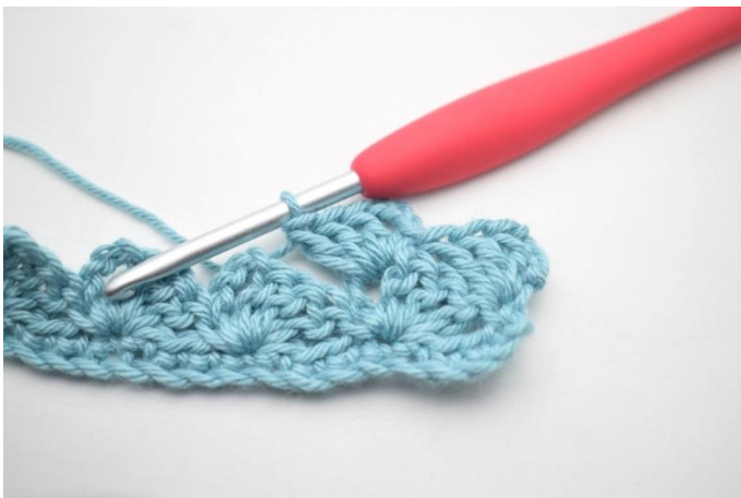
19. In questo modo.