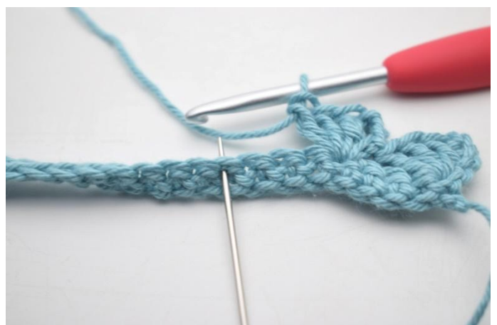
10. *Saltare 3 m, 1 mb, 3 cat, 3 ma nella m succ*.