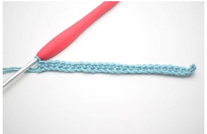
4. 1 mb in ogni m.