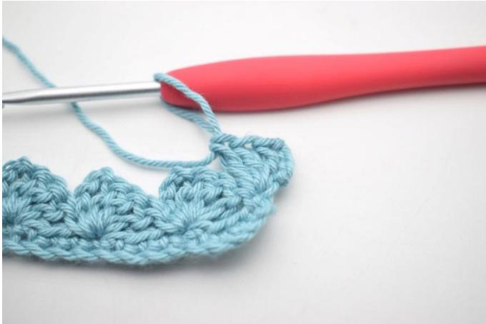
17. In questo modo.