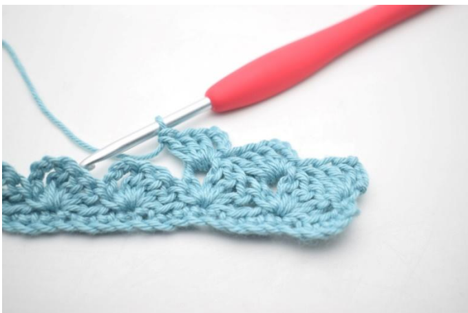
21. In questo modo.