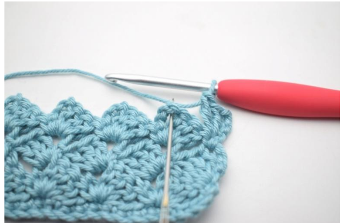
37. *1 mb nello sp-cat succ.