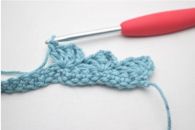
11. In questo modo.