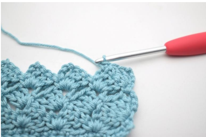
38. In questo modo.