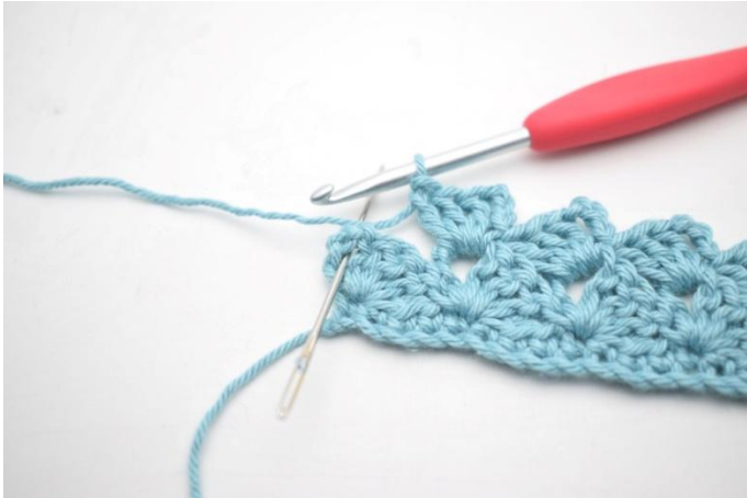
23. 1 mb nello sp-cat.