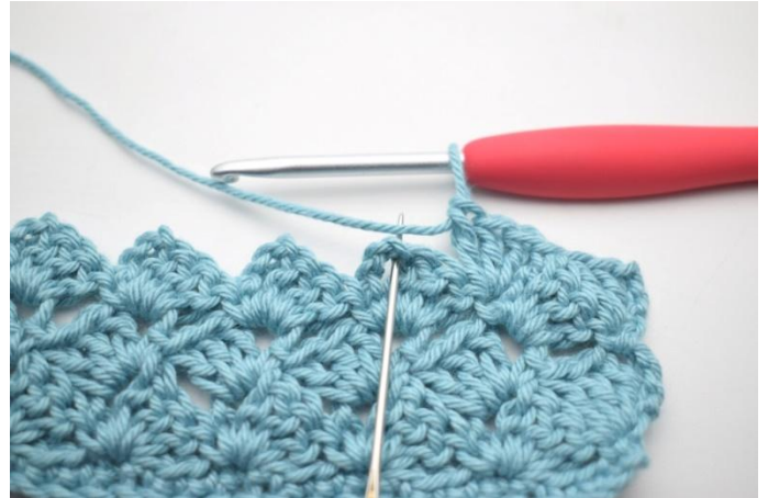
41. * 1 mb nello sp-cat succ.