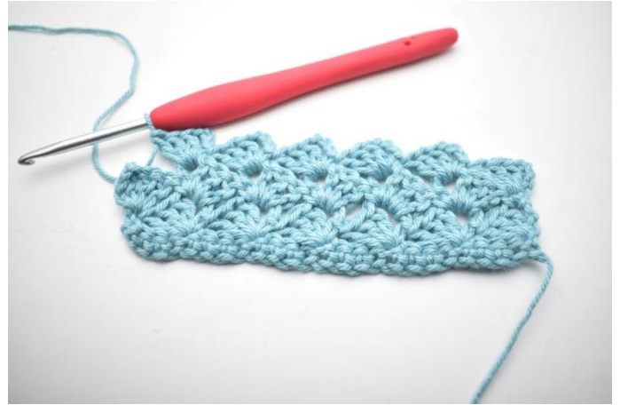
30. *1 mb, 3 cat , 3 ma nello sp-cat succ*. Ripetere da * a * 13 volte in totale. 1 mb nello sp-cat.