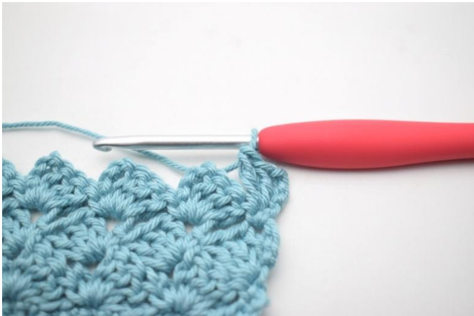
36. In questo modo.