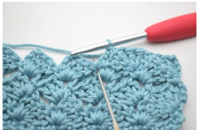
43. 3 ma nella mb del giro prec*.