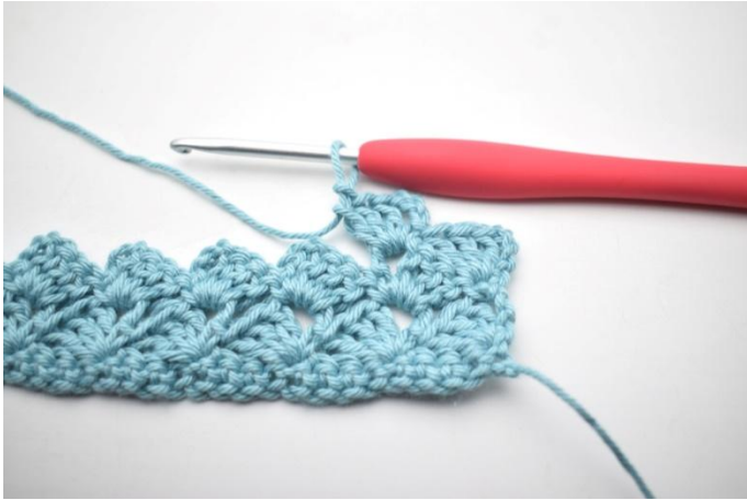
29. In questo modo.