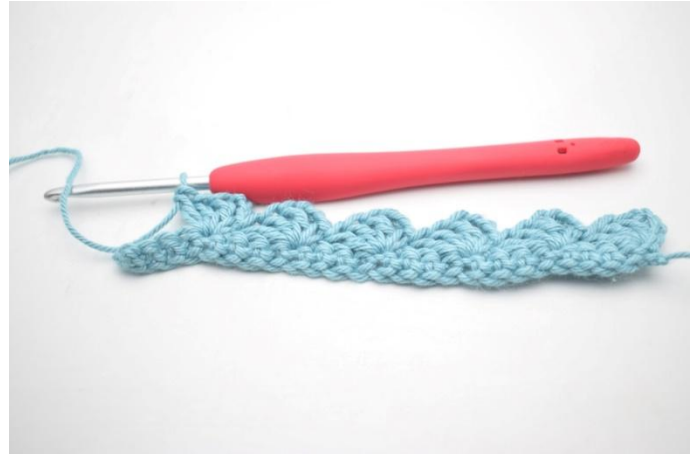
12. Ripetere da * a * fino a quando rimangono 4 m.