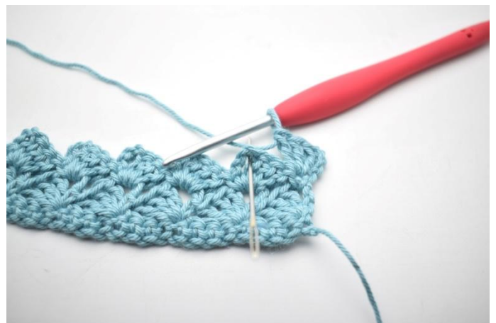
28. *1 mb, 3 cat, 3 ma nello sp-cat*.