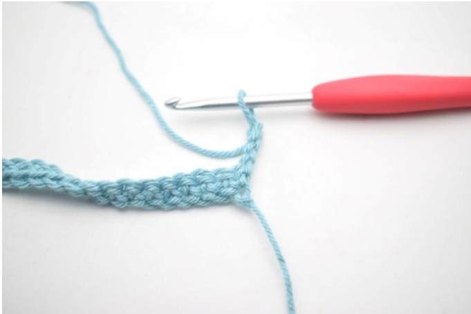
5. Gira, 4 cat.