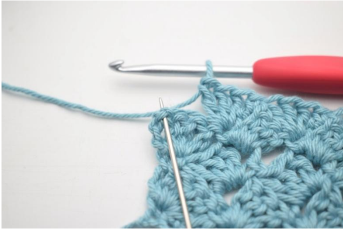
46. 1 mb nello sp-cat.