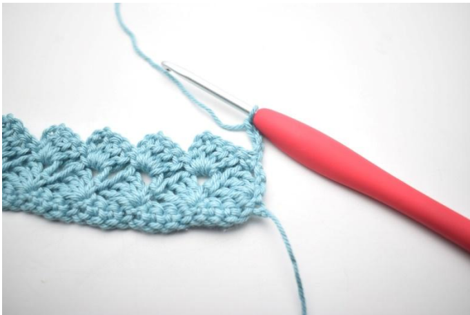
25. Questo giro è lavorato come il giro 3. Gira, 4 cat.