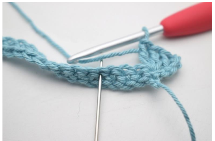
8. *Saltare 3 m, 1 mb, 3 cat e 3 ma nella m succ*