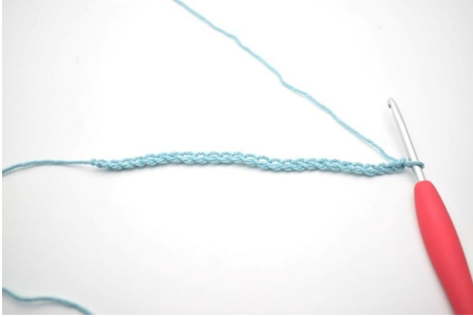
1. 58 cat.