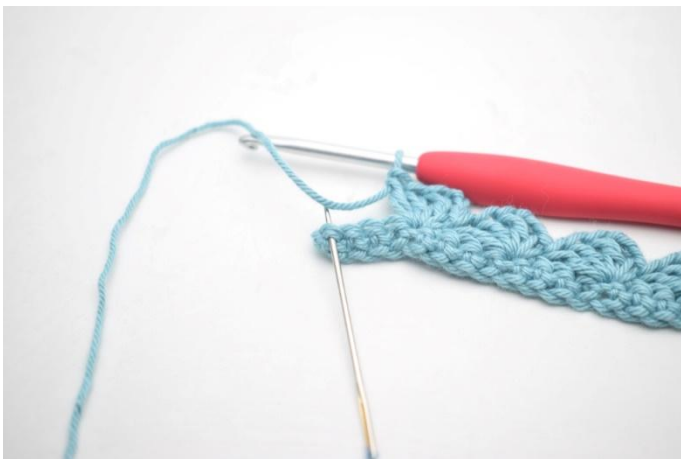
13. Saltare 3 m, 1 mb nell'ultima m.