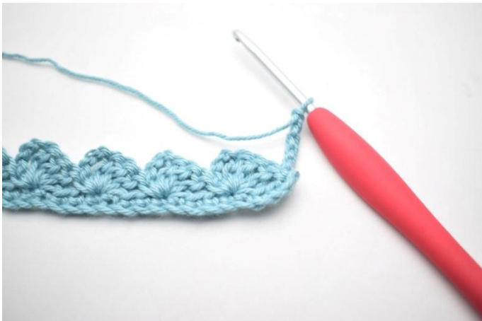
15. Gira, 4 cat.