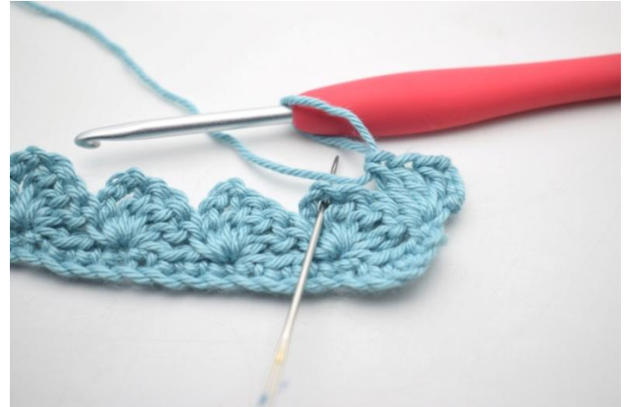
18. *1 mb, 3 cat, 3 ma nello sp-cat*.