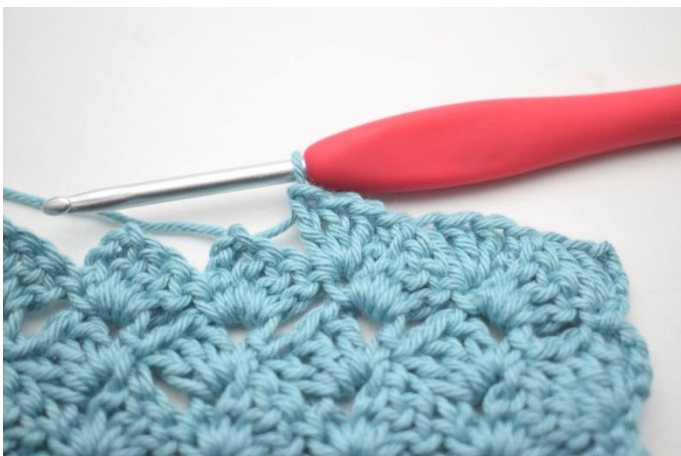
44. In questo modo.