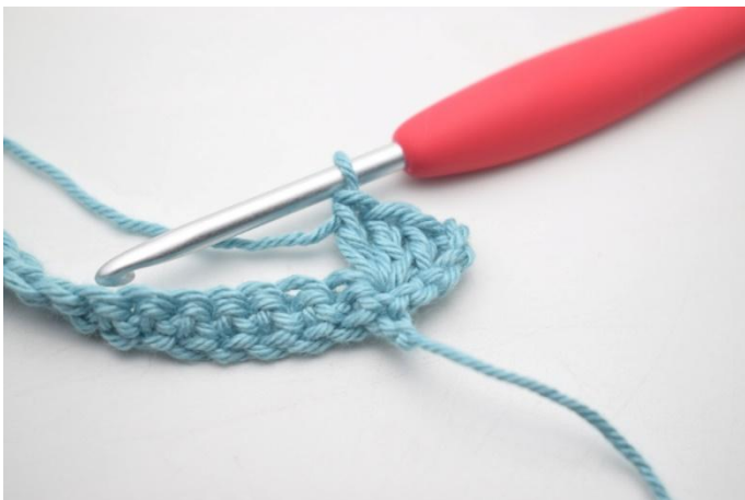
7. In questo modo.