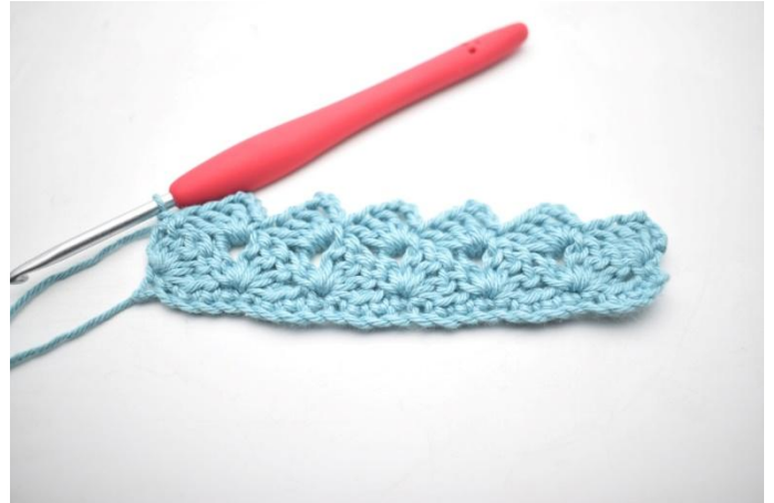
24. In questo modo.