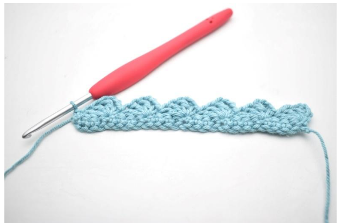
14. In questo modo