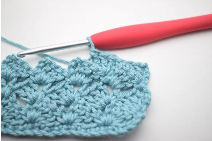
40. In questo modo.