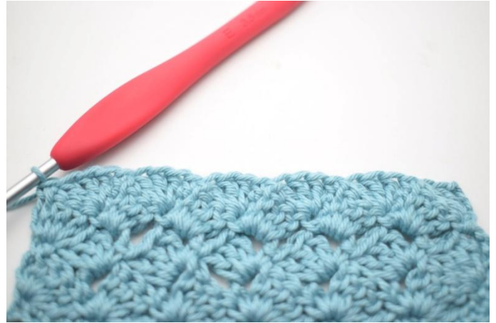
47. In questo modo.