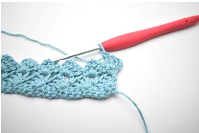
27. In questo modo.