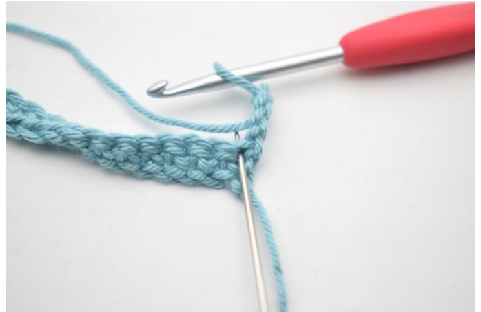
6. 3 ma nella m succ.