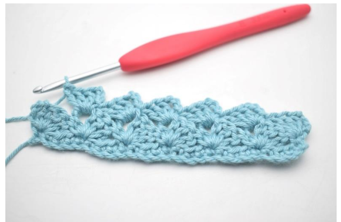
22. Ripetere da * a * 13 volte in totale.