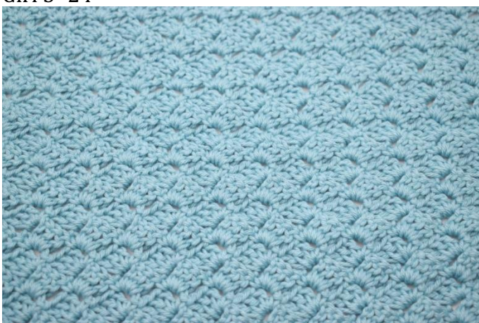
33. Ripetere il giro 3 fino a quando hai 24 giri in totale.