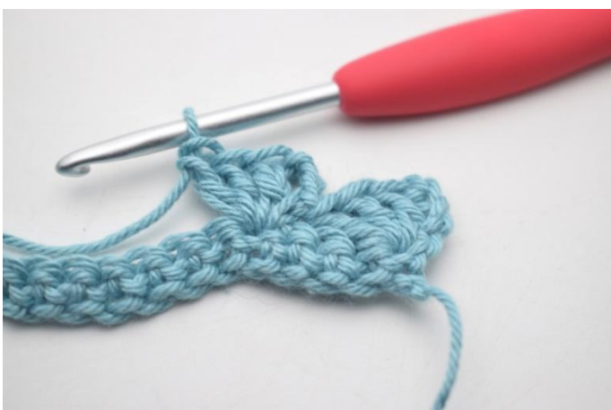
9. In questo modo.