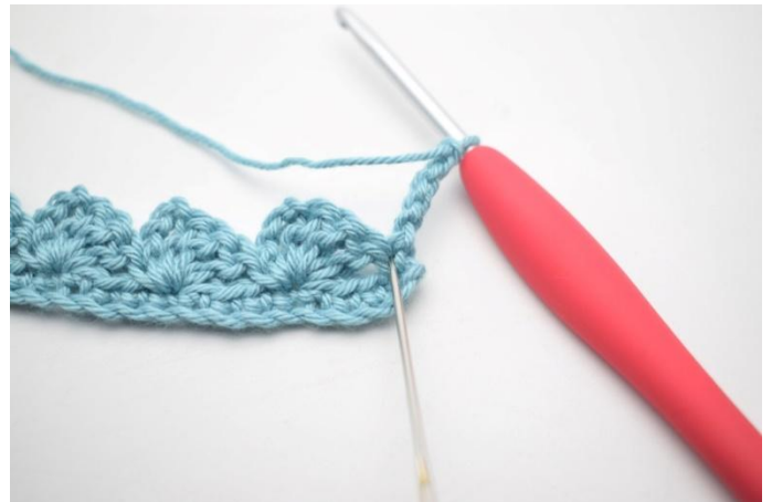
16. 3 ma nella stessa m.