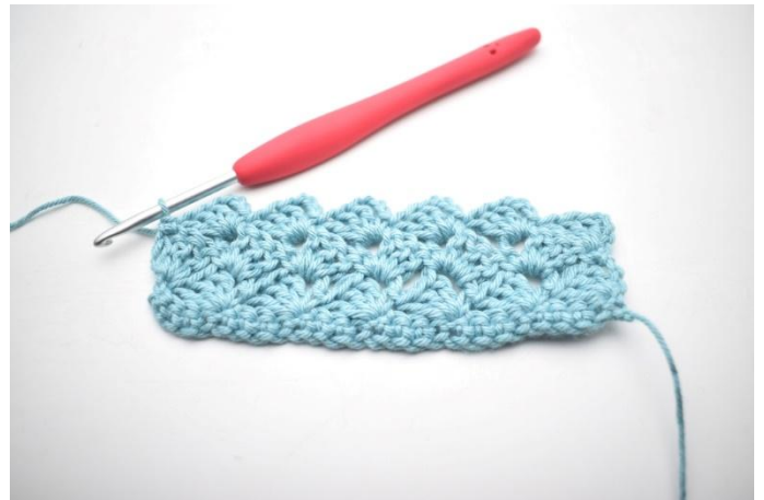
32. In questo modo.