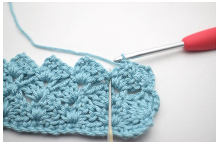
39. 3 ma nella mb del giro prec*.