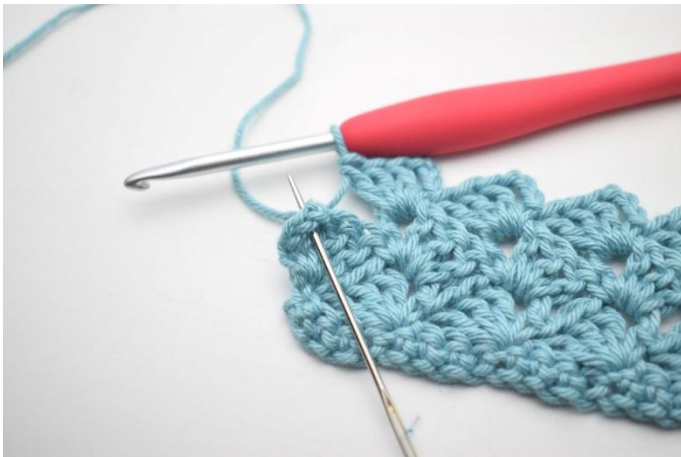
31. 1 mb nello sp-cat.