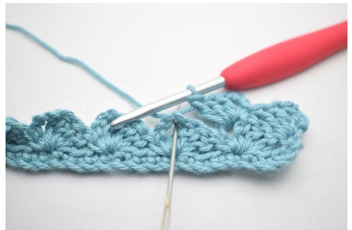
20. *1 mb, 3 cat, 3 ma nello sp-cat*.