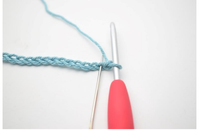
2. 1 mb nella 2a cat dell'uncinetto.