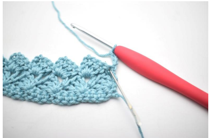
26. 3 ma nella prima m.