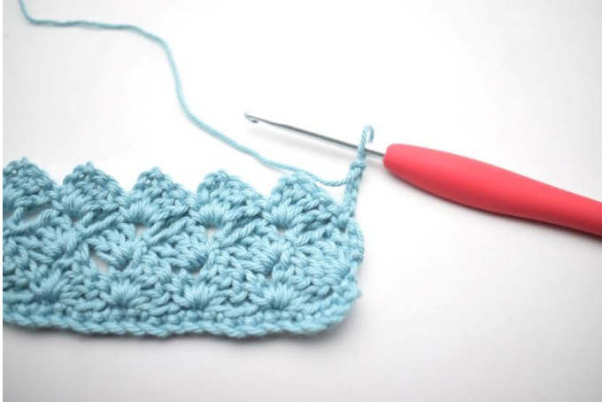
34. Gira, 4 cat.