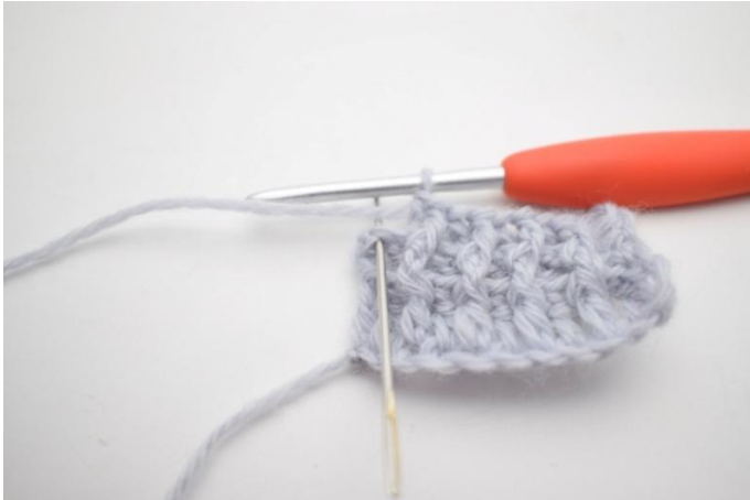
9. Lavora 1 ma normale nella m succ.