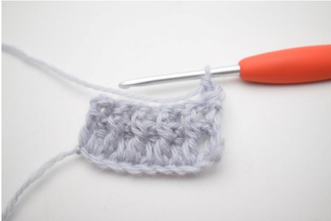
3. In questo modo.