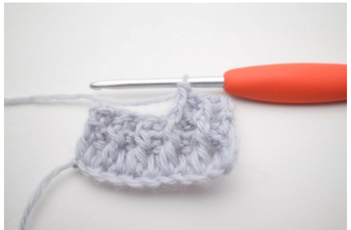
6. "Lavora 1 ma in ril die attorno alla m succ, lavora 1 ma in ril dav attorno alla m succ"