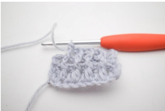
7. Ripetere da "a" fino a quando rimangono 2 m.