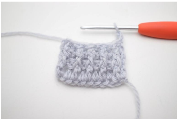
1. Questo giro è uguale al giro 2. Girare con 3 cat.