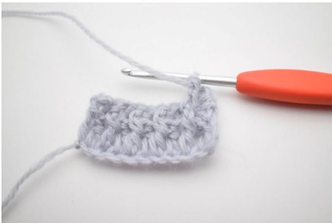
5. In questo modo.