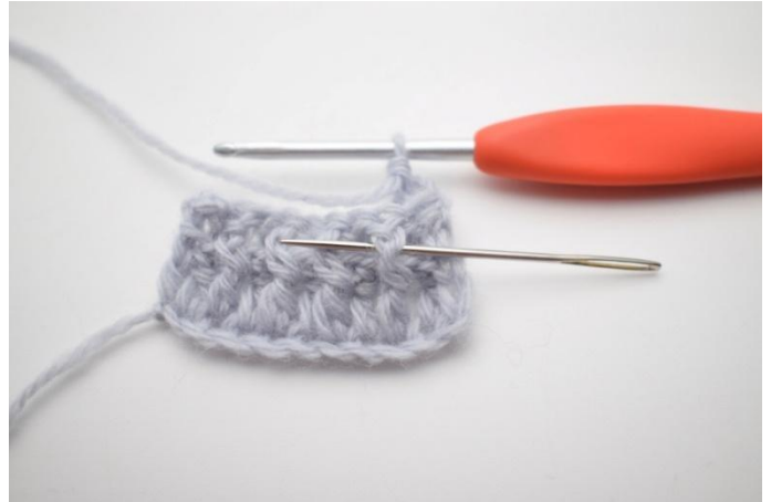
4. Lavora 1 ma in ril dav attorno alla 1a ma. L'ago qui segna come la ma in ril dav deve essere lavorata dalla parte anteriore attorno alla ma del giro precedente.