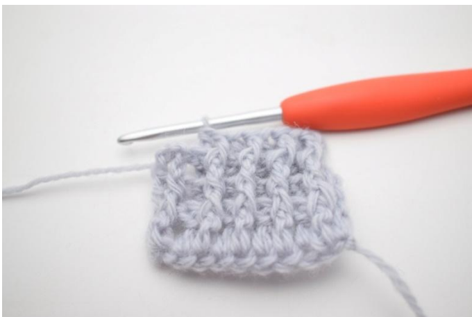
3. Ripetere da "a" fino a quando rimangono 2 m.