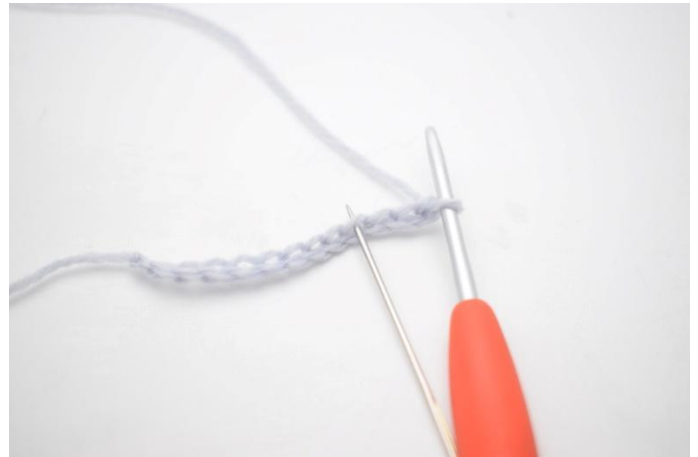
2. Lavora 1 ma nella 4a cat dell'uncinetto.