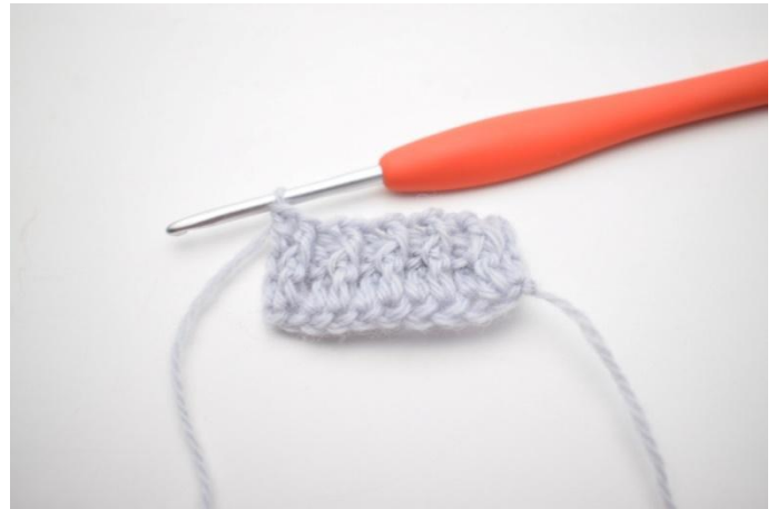
10. In questo modo.