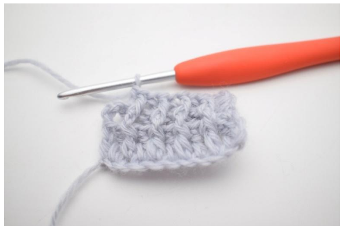
8. Lavora 1 ma in ril die attorno alla m succ.