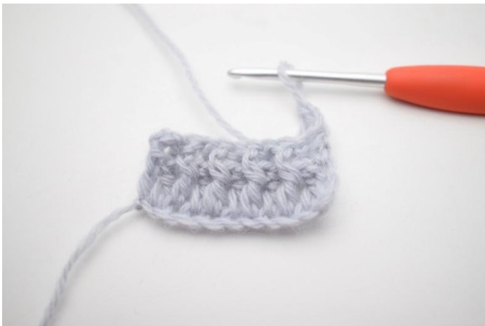
1. Gira con 3 cat.