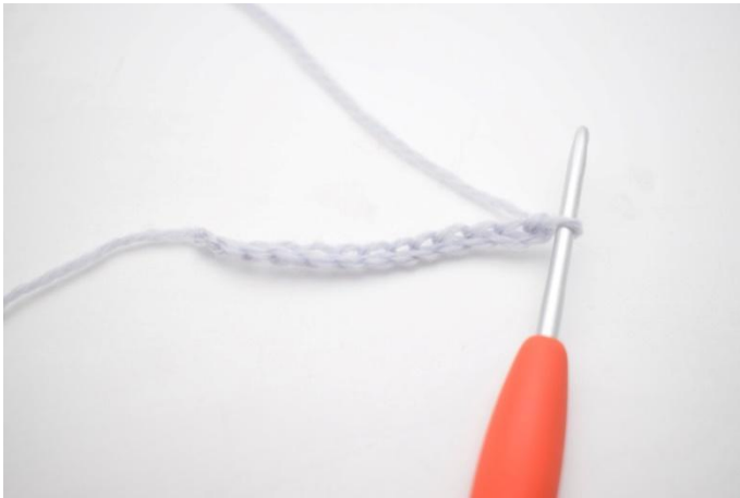
1. 35 cat.