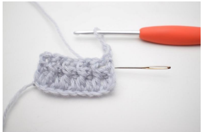
2. Lavora 1 ma in ril die attorno alla m succ. L'ago qui segna come la ma in ril die deve essere lavorata dalla parte posteriore attorno alla ma del giro precedente.