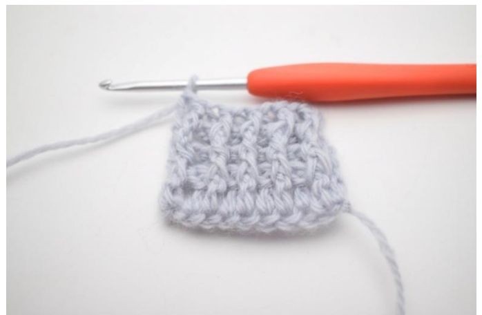
4. Lavora 1 ma in ril dav attorno alla m succ, 1 ma a normale nella m succ.