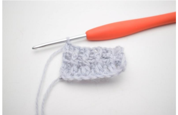
10. In questo modo.