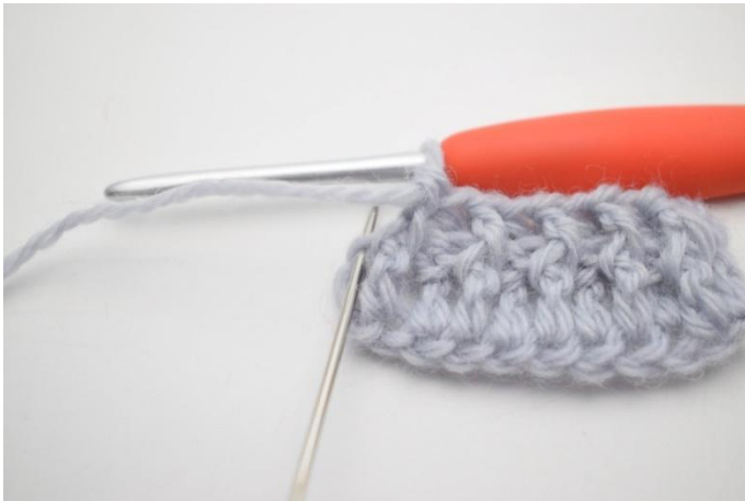
9. Lavora 1 ma normale nella m succ.