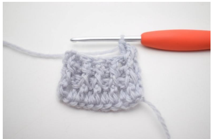
2. "Lavora 1 ma in ril dav attorno alla prima m, lavora 1 ma in ril die attorno alla m succ".