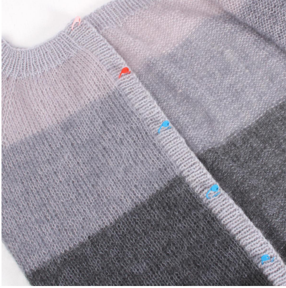
7- Segna il punto in cui devono essere posizionati i bottoni.