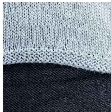
Bordo della vita a legaccio