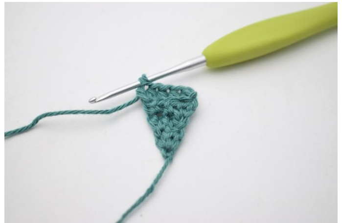
8. Lavora 1 mma in ognuna delle prima 3 m e 2 mma nell'ultima m.