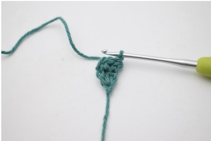
5. 1 Cat per girare.