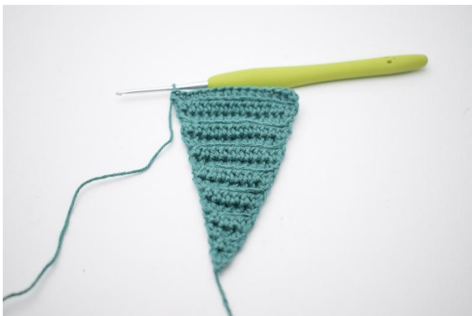
9. Ripeti i giri finché avrai 16 mma.