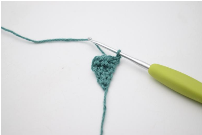
7. 1 Cat per girare.