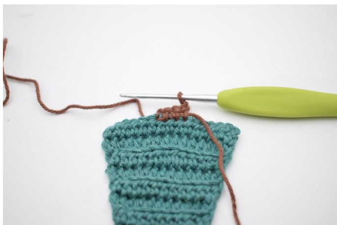
13. 1 Cat per girare.