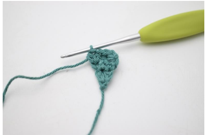
6. Lavora 1 mma in ognuna delle prime 2 m and 2 mma nell'ultima m.