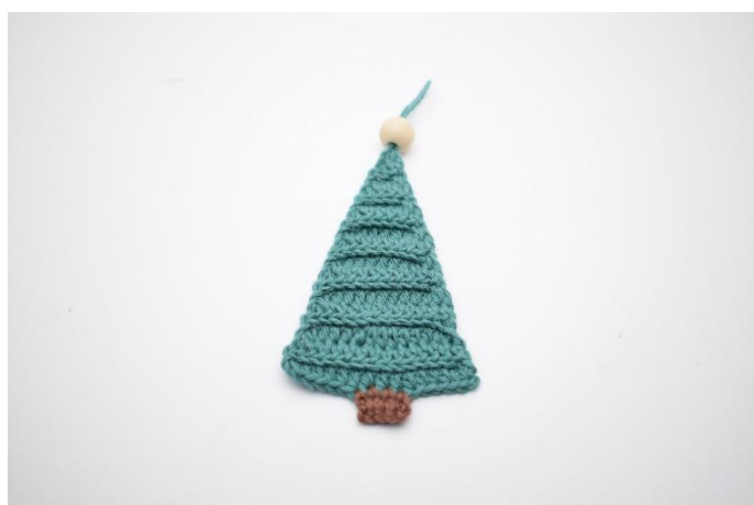
16. Attacca se vuoi una pallina sulla cima dell'albero.