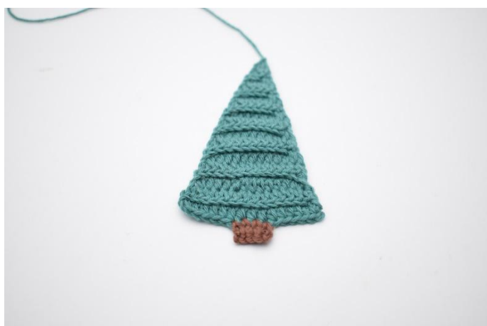
15. Taglia il filo e nascondilo.