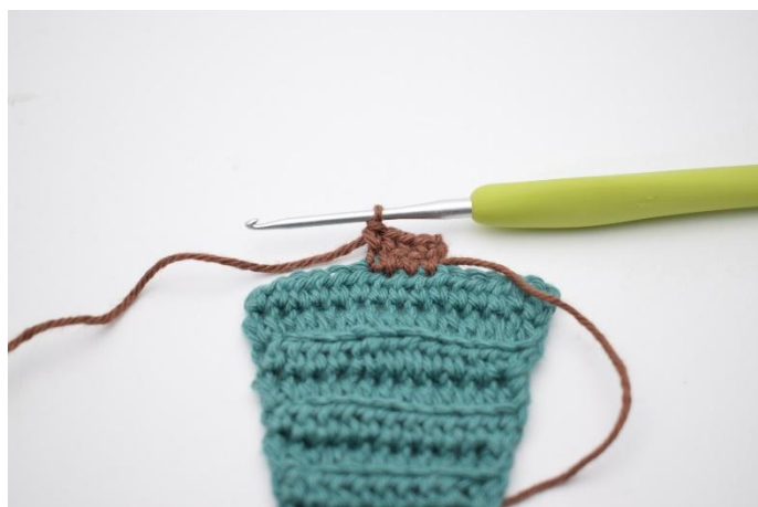
14. Lavora 1 mb nelle 4 m.