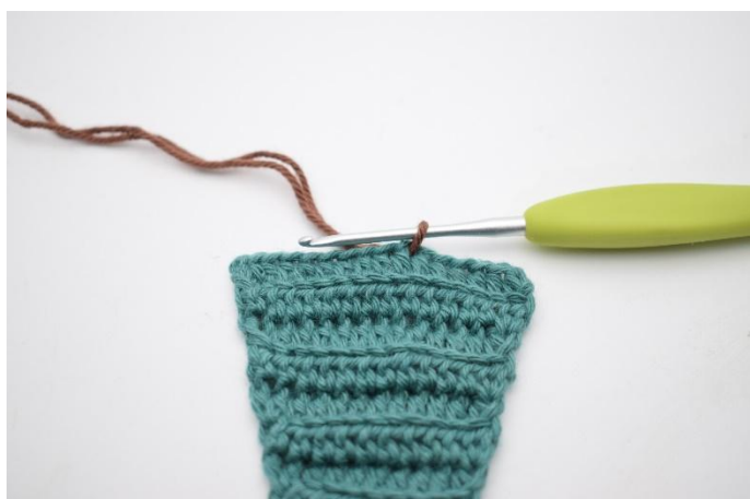
11. Salta 6 m e inserisci il colore per il "tronco".