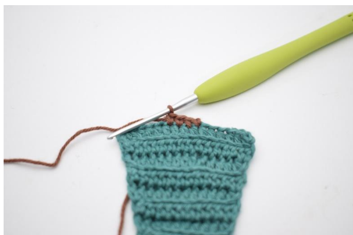
12. Lavora 4 ma.