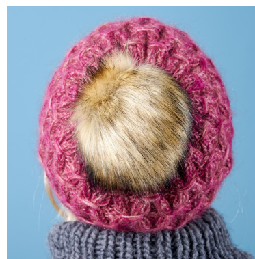
Attacca un Pompon