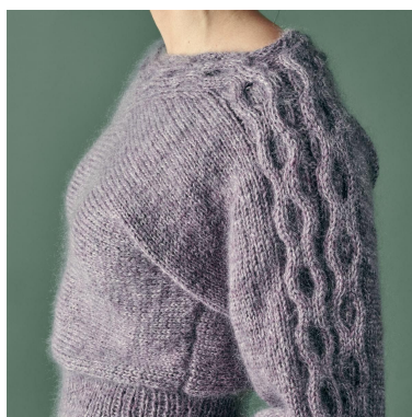
Intreccio lungo la mancia