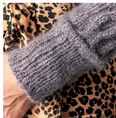
Riprendere le maglie e coste