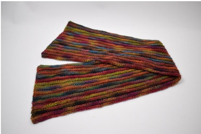
13. Ripetere il 2 giro fino ad avere 26 giri in totale. Taglia il filo e intrecciare le estremità.