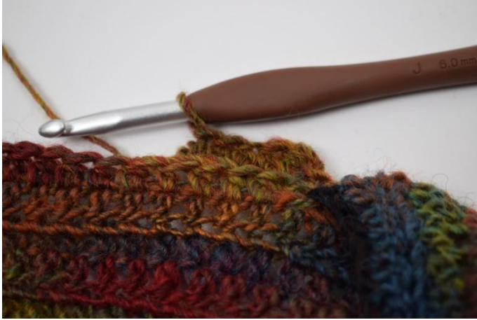
5. 1 cat. Lavora mma post per tutto il giro.