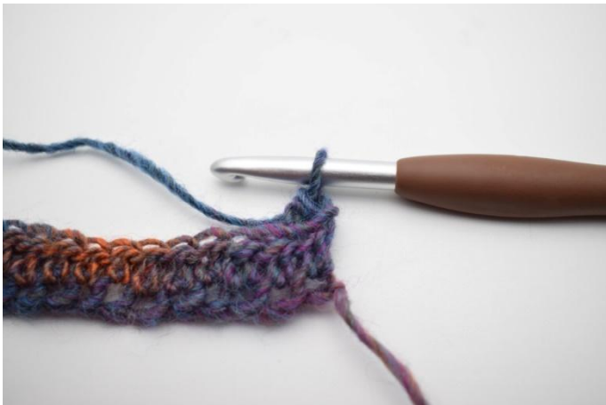
7. In questo modo.