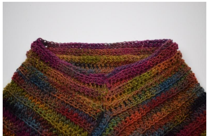
10. Ripetere come descritto del modello fino a quando hai 6 giri in totale.