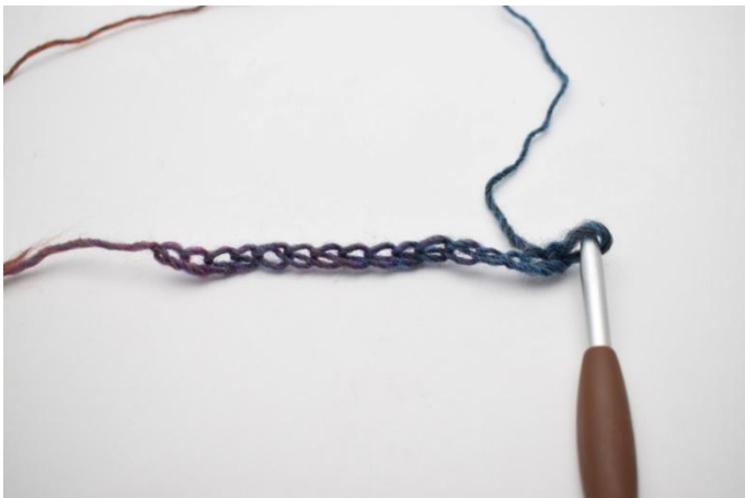
1. Lavora la catenella di base.