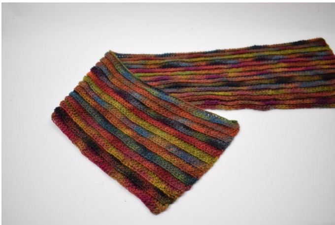
1. Piega un'estremità verso il centro come mostrato nell'immagine qui.