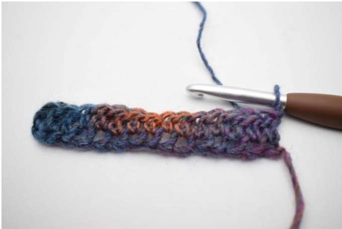
5. Gira con 1 cat.