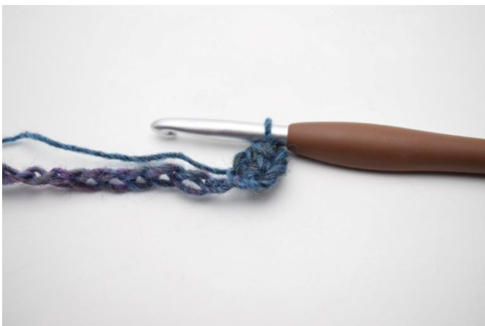
3. In questo modo.