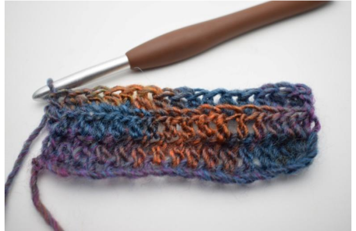
12. Lavora mma post per tutto il giro.