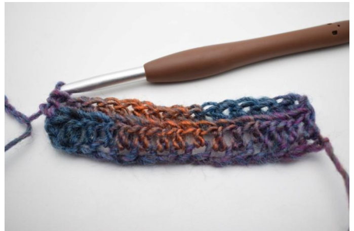
8. Lavora mma post per tutto il gir