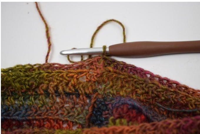
9. Termina con 1 mbss nella prima mma.