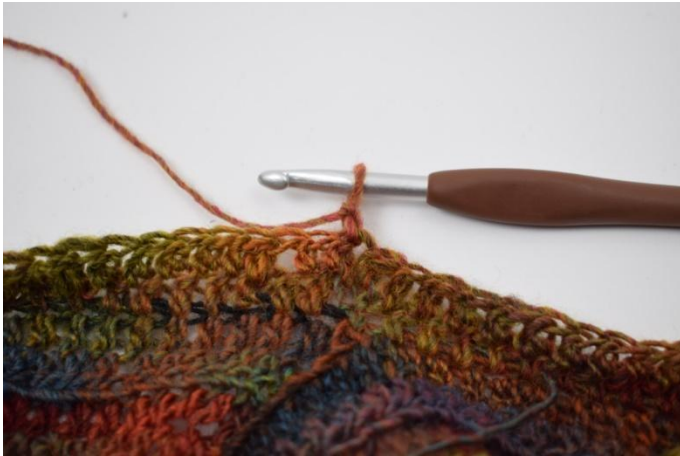
7. Gira il lavoro con 1 cat.