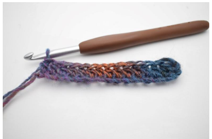
4. Lavora mma in ogni cat per tutto il giro.