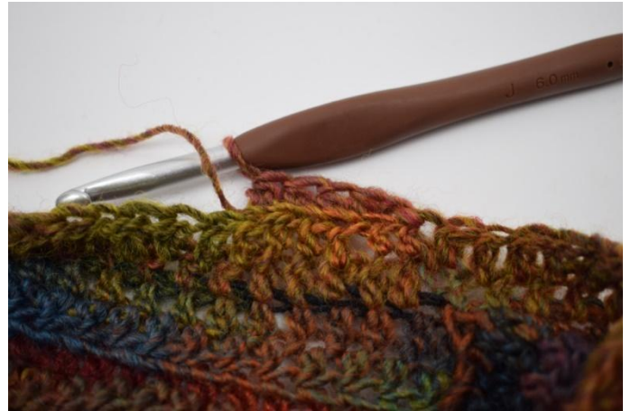
8. Lavora mma post per tutto il giro.