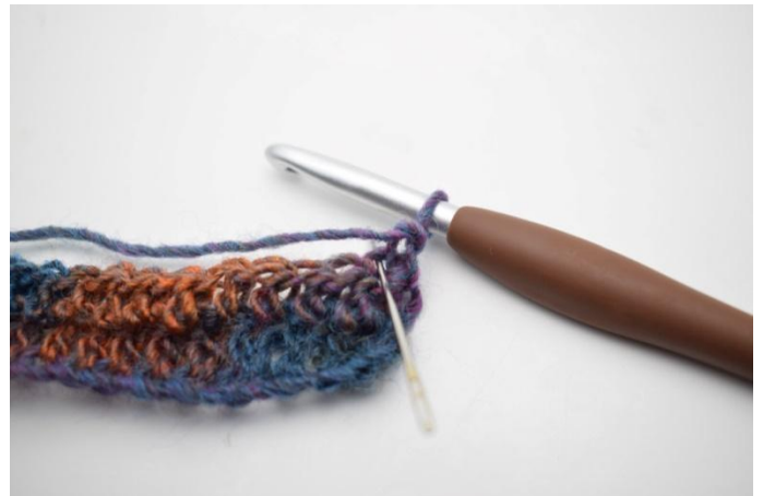
10. Lavora 1 mma post. L'ago segna dove lavorare la mma