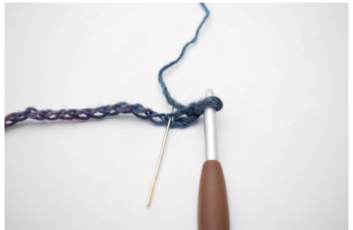
2. Nella 3a cat dell'uncinetto, lavora 1 mma.