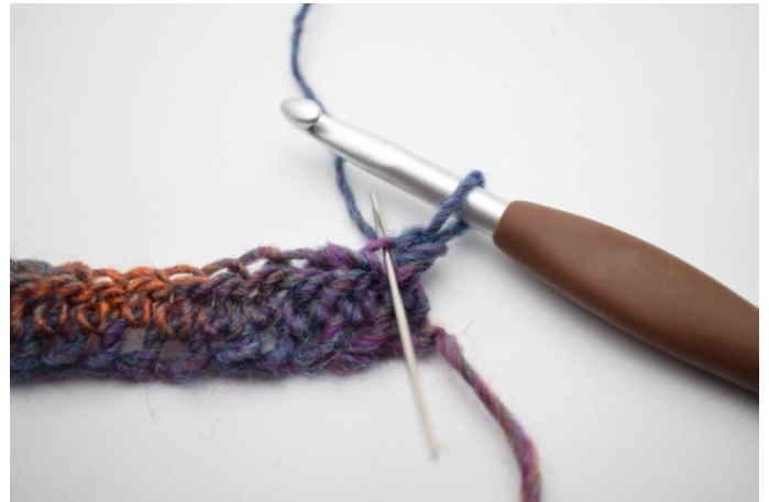
6. Lavora 1 mma post. L'ago segna dove lavorare la mma post.