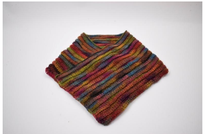
2. Piega l'altra estremità sulla prima estremità, in modo che si sovrappongono con 30 m.