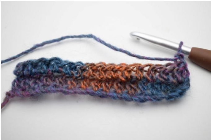
9. Gira con 1 cat.