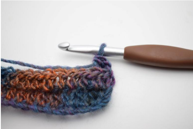
11. In questo modo.