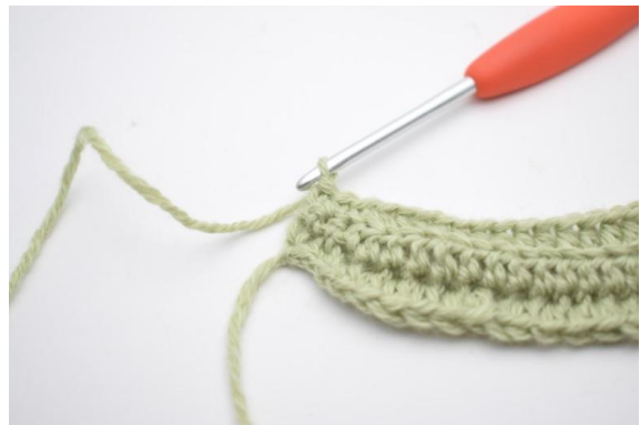
4. Lavora 1 mb nelle ultime 2 (3) m.