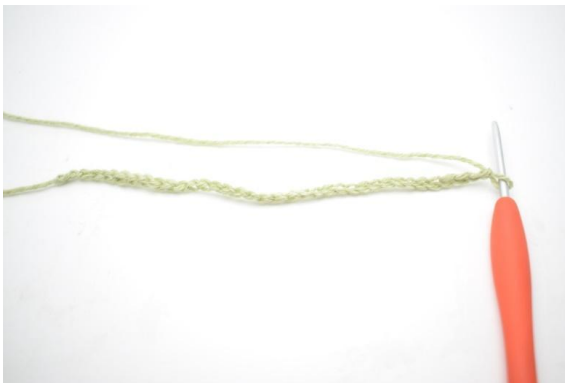
1. 26 (36) cat.