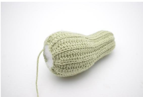
7. Riempi e modella la zucca.