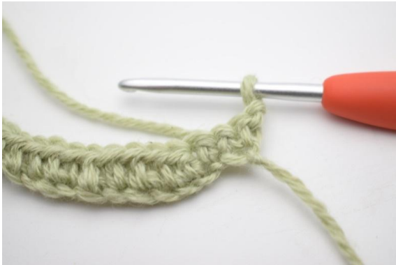
1. Gira con 1 cat.