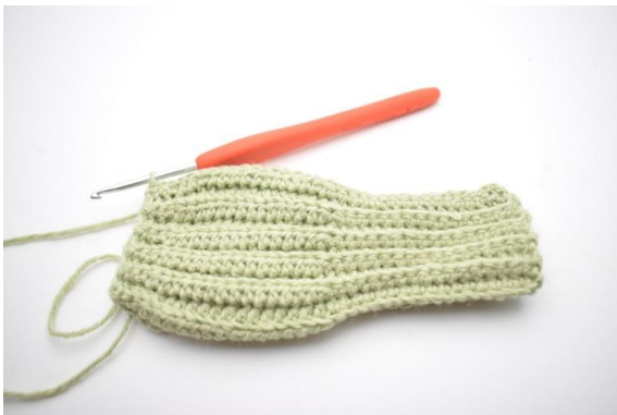
3. In questo modo.