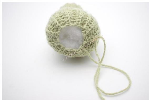
8. Fissare il bordo del fondo della zucca e unire le m in modo che il buco sia chiuso.