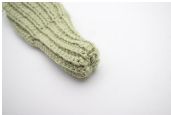
6. Fermare il filo alla fine. Gira l'interno della zucca.