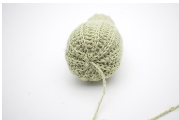
9. In questo modo.