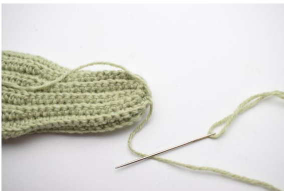
5. Affrancare il bordo e unire le m in modo che il buco sia completamente chiuso.