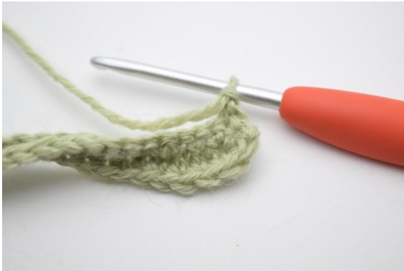
1. Gira con 1 cat.