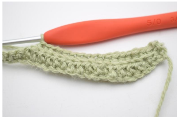
4. Lavora 1 mma nelle succ 11 (15) m