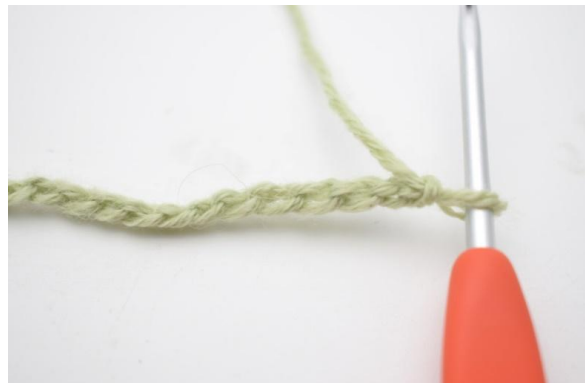
2. Gira la catenella e lavora negli anelli verticali.