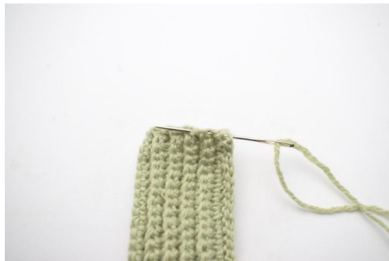
4. Ora cucirai la parte superiore della zucca.