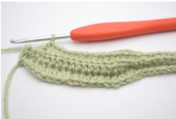
3. Lavora 1 mma nelle succ 11 (15) m.