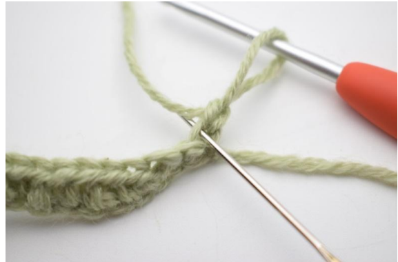
2. D'ora in poi, lavora SOLO nell'asola posteriore.