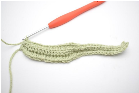
5. In questo modo.