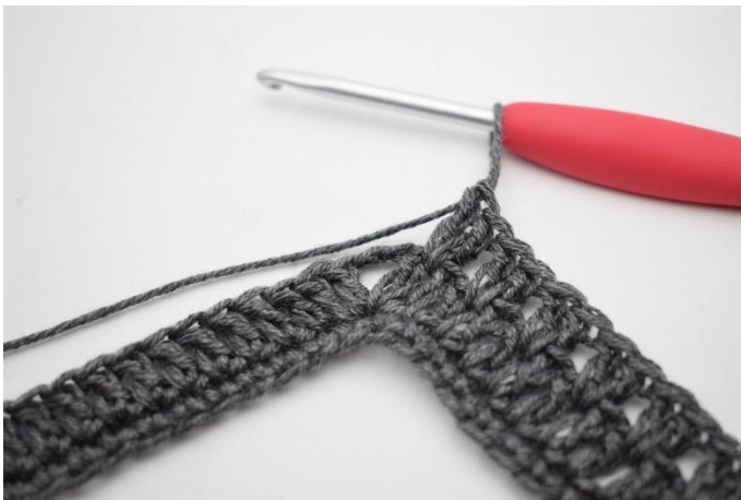
7. Lav "2 ma tra le 2 ma, salta 1 m". Ripeti per 34 volte in totale.