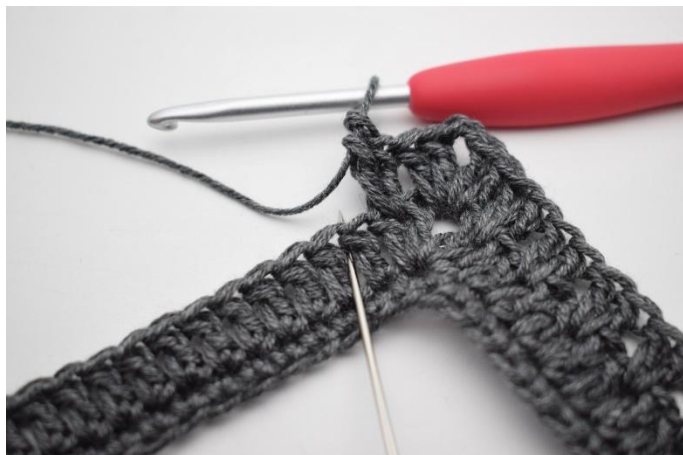
11. Salta 1 m e lav 2 ma tra 2 ma del giro precedente.