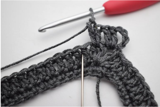
5. Salta 1 m e lav 2 ma tra le 2 ma del giro precedente.