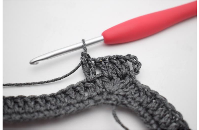
6. In questo modo.