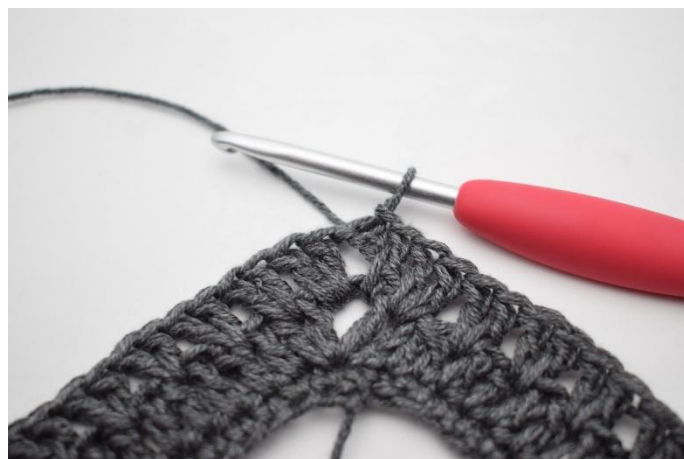
16. Finisci con 1 m bss.