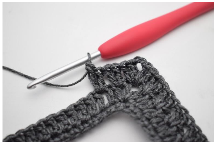
12. In questo modo.