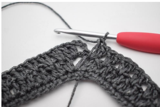
13. Lav "2 ma tra le 2 ma, salta 1 m". Ripeti per un totale di 34 volte.