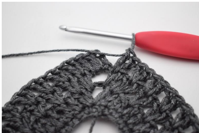
8. Lav "2 ma tra le 2 ma, salta 1 m". Ripeti per un totale di 36 volte.