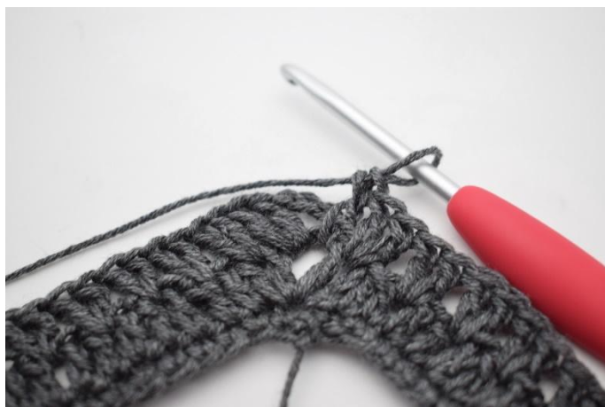
15. In questo modo.