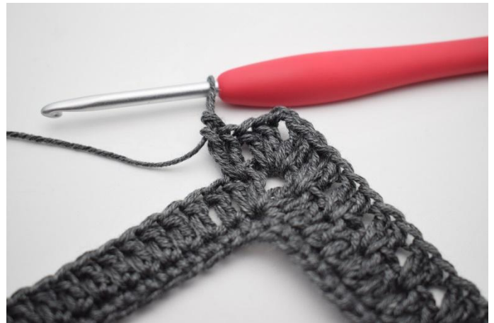
10. In questo modo