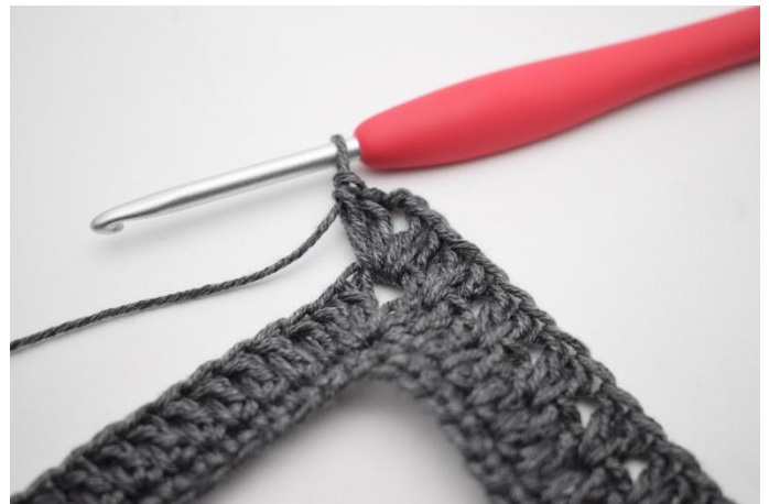
8. Lav "2 ma 2 cat 2 ma" nello spazio di 3 cat.