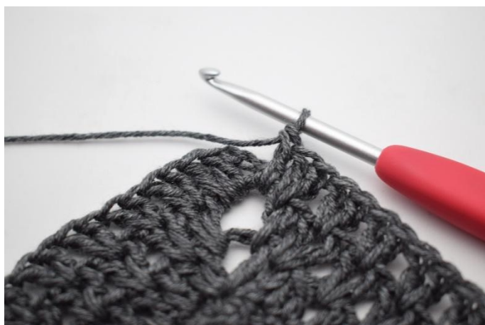
10. In questo modo.