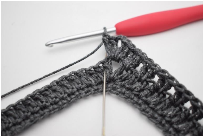
9. Lav 2 ma tra le 2 ma del giro precedente. In questa immagine l'ago indica dove lavorare la ma.