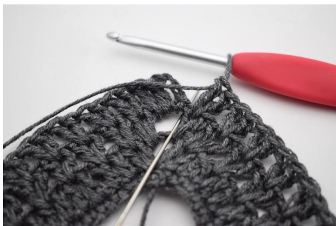
9. Lav 1 ma nello spazio delle cat.