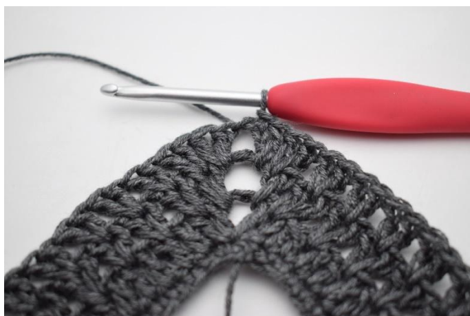
11. Finisci con 1 mbss.