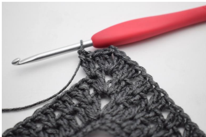
7. In questo modo.