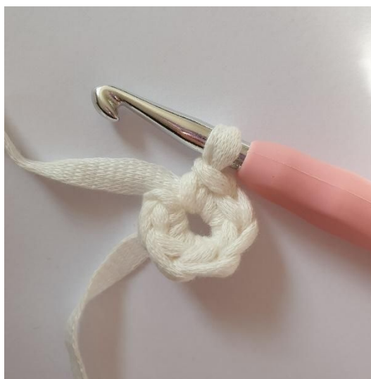
2. lavora 6 mb nella 2 cat dell'uncinetto.