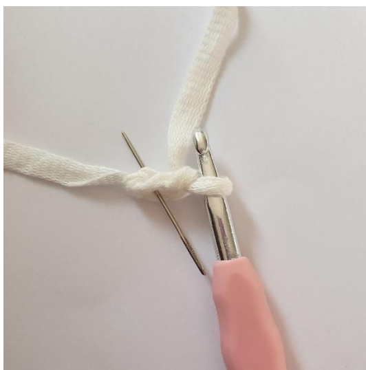
1. 2 cat, inizia dalla 2° cat dell'uncinetto.

Termina con 2 mbss. Taglia il filo e intreccia le estremità.