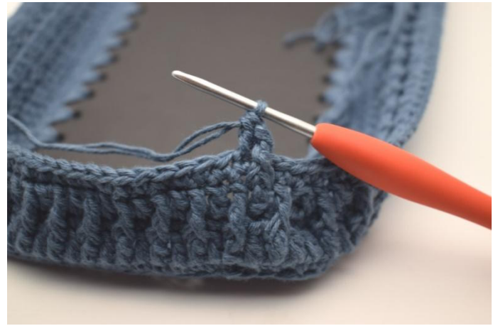
4. Lavora 1 ma nella prossima m.