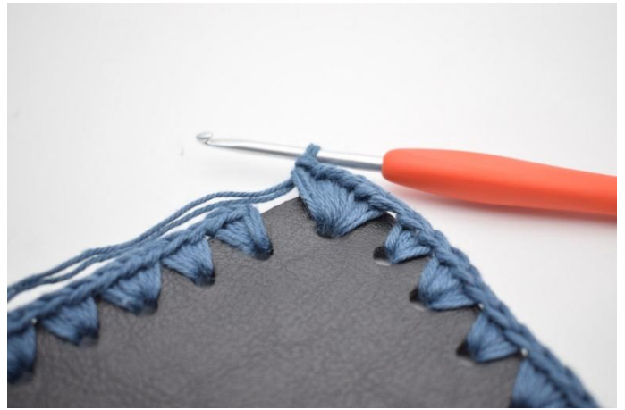
12. Lavora 6 mb nel foro succ.