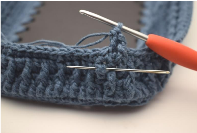
5. Lavora 1 ma in ril dav attorno alla ma della riga prec