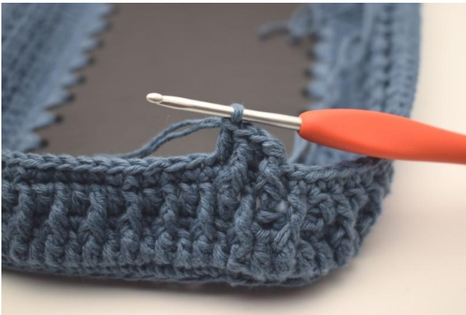
7. Lavora 1 ma nella prossima m.