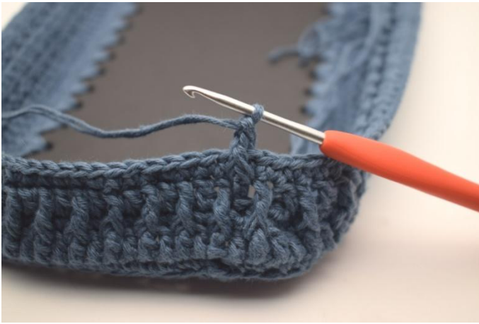
3. In questo modo.