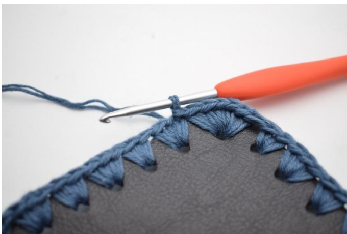
13. Finisci con 1 mbss (160)