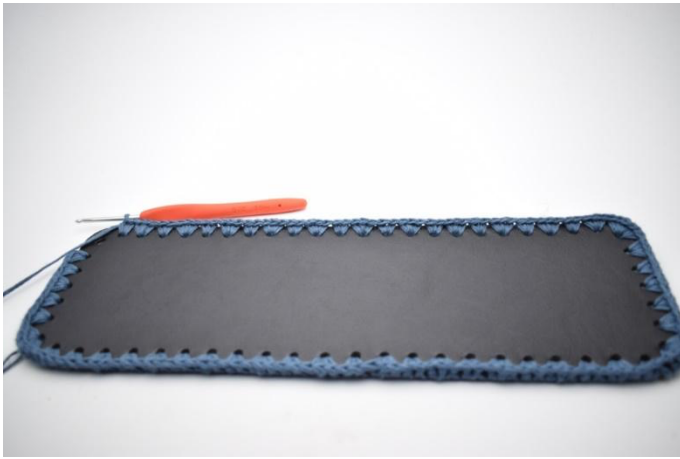
11. Lavora *3 mb nel foro succ, 2 mb nel foro succ* Ripeti da *a* 11 volte