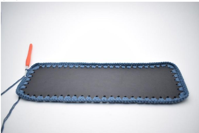
1. 1 cat. Lavora 1 mb in ogni m fino alla fine del giro. Termina con 1 mbss (160)