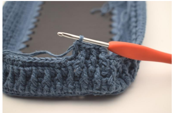
8. Lavora *1 ma in ril dav nella prossima ma del giro prec e 1 ma nella prossima m*