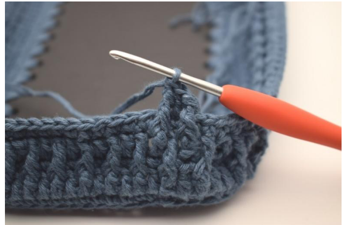
6. In questo modo.