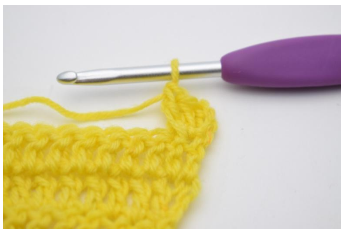
5. In questo modo.