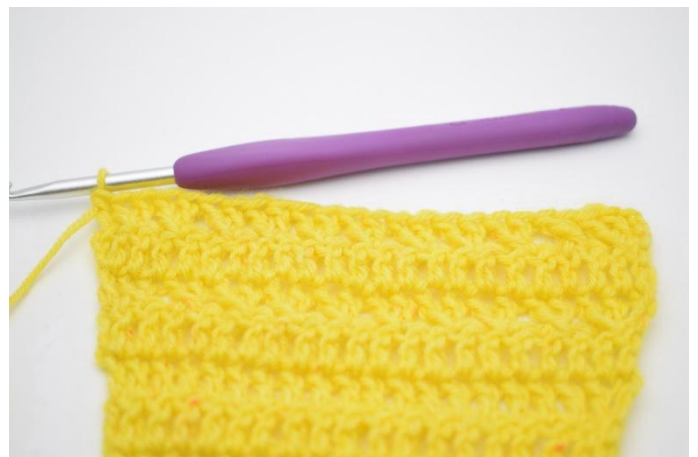
12. Ora Lav un nuovo giro del motivo dello schema.

24. 3 cat per girare. Lav 1 m.a nella prima m. e 1 m.a in ogni m. dell'intero giro." (25)