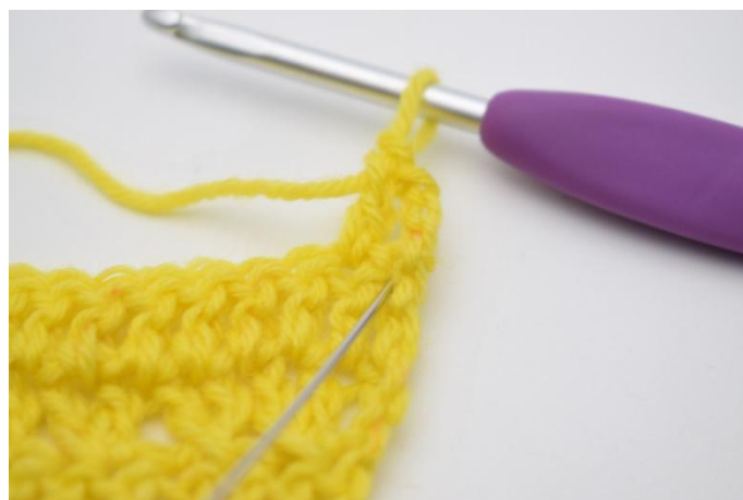
4. Lav 1 m.a nella m. saltata.