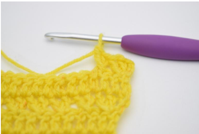
9. In questo modo.