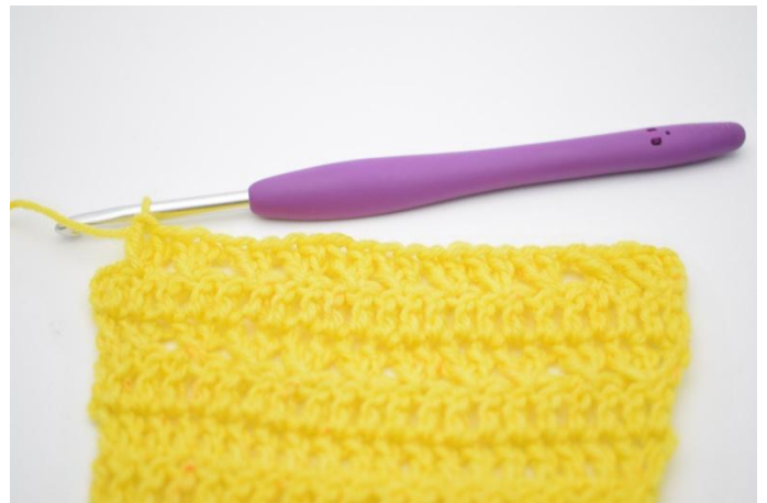
10. Ripeti le ma inc finché non ti rimanen 1m.