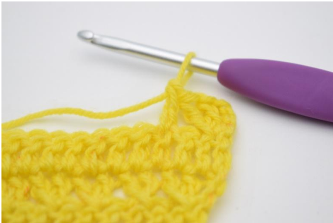
7. Lav. ma.