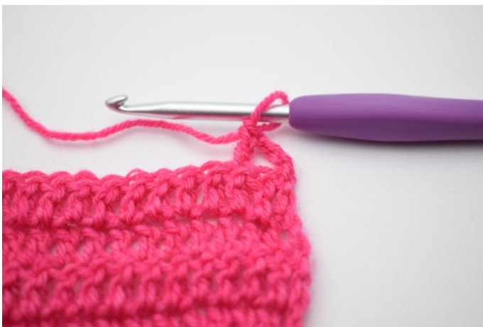
3. Lavora 1 ma.