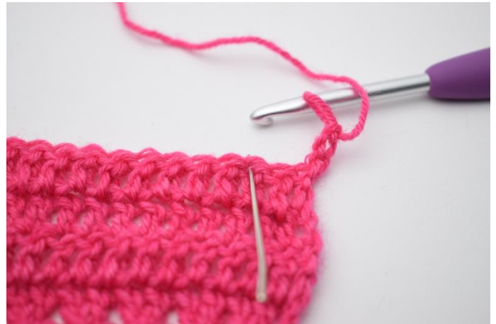
2. Salta 2 m.