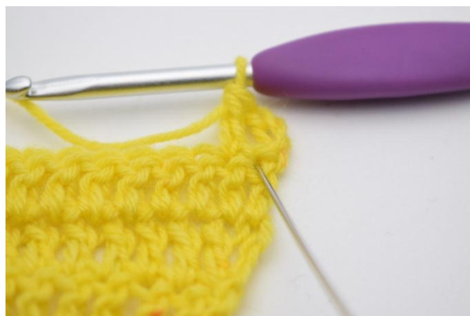
4. Lav 1 m.a nella m. saltata.