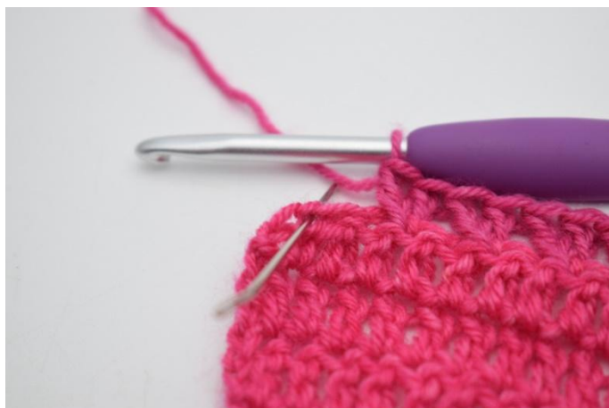
7. Salta 1 m.