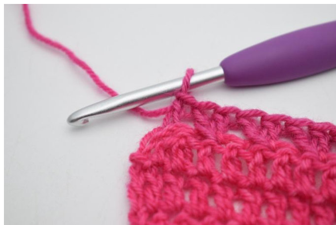
8. Lavora 1 ma