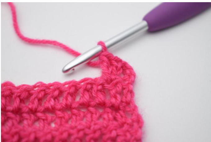
5. In questo modo.