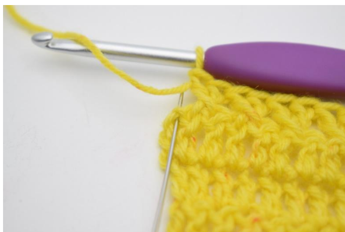
11. Lav 1 m.a nella m. successiva.