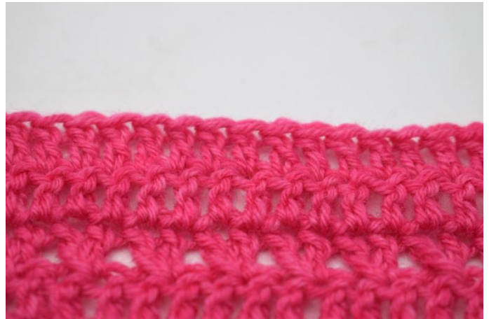
4. Lav 1 m.a in ogni m. sottostante.

98. 3 cat per girare, 1 a Dim e Lav 1 m.a in ogni m. sottostante (95)