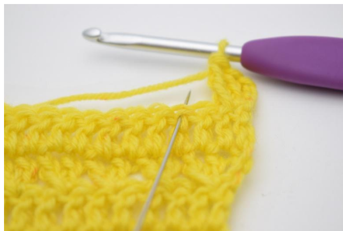
6. Salta 1 m.