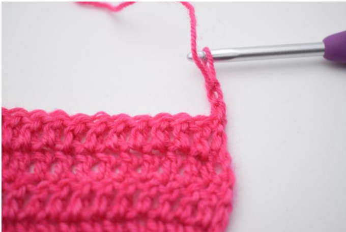
1. 3 cat per girare.