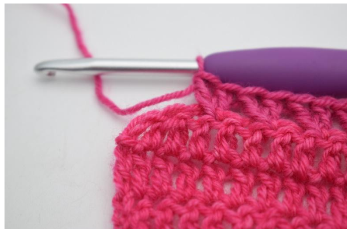
6. Ora Lav il motivo come prima. "salta 1 m. e una m.a nella m. successiva, 1 m.a nella m. saltata" Ripeti da "a" su tutta la riga fino a quando rimangono 2 m.