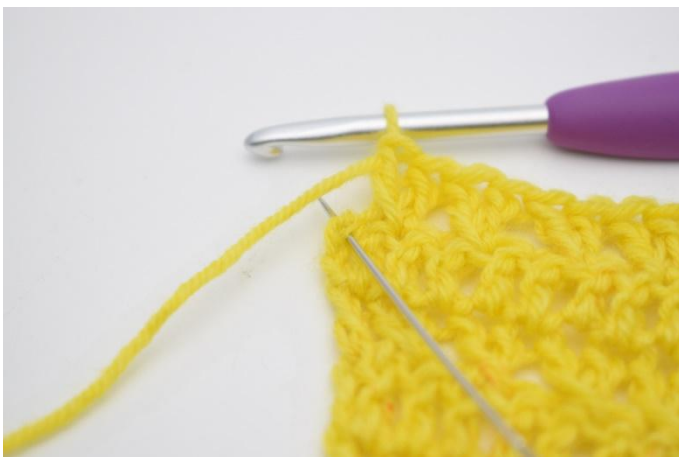
11. Lav 1m.a nella m. successiva.