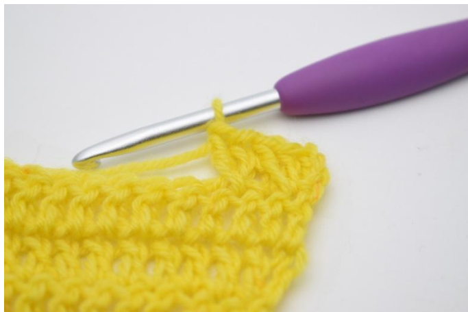
9. In questo modo.