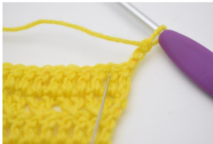
2. Salta 1 m.