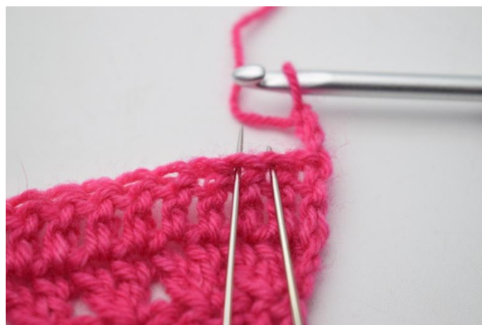
2. Lav 1 Dim. Lav insieme la 2°m. e la 3°m.