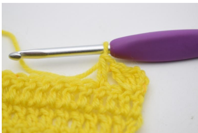
7. Lav. 1 ma