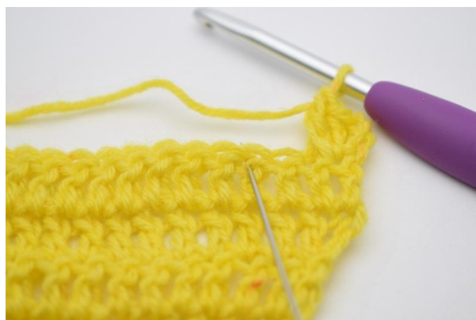
6. Salta 1 m.