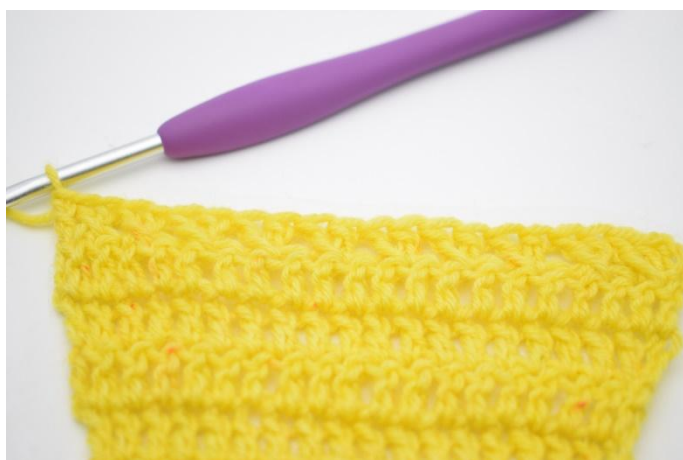
12. In questo modo

22. Ora Lav 1 giro di ma e aum come prima. 3 cat per girare e Lav 1 m.a nella prima m. Lav 1 m.a in ogni m. dell'intera riga.