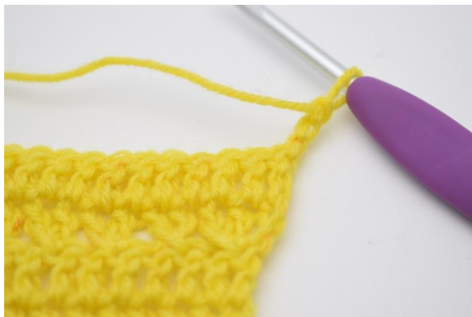
1. 3 cat per girare.

23. Ora Lav un altro giro del motivo dello schema, 3 cat per girare. “salta 1 m e lavora 1 m.a nella succ. Lav 1 m.a nella m. saltata”. Ripeti da “a” per tutto il giro fino a quando rimane 1 m. Lav 1 m.a nell’ultima m. (24)