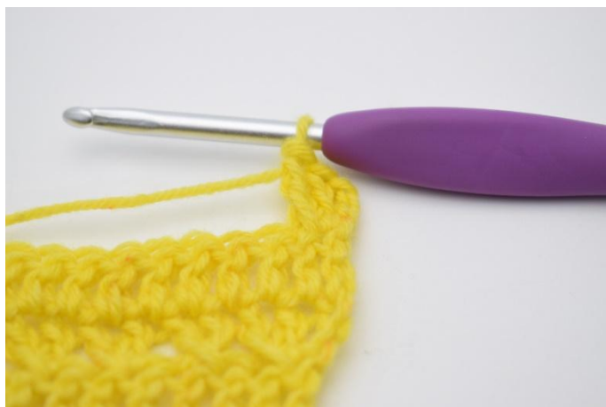
5. In questo modo.