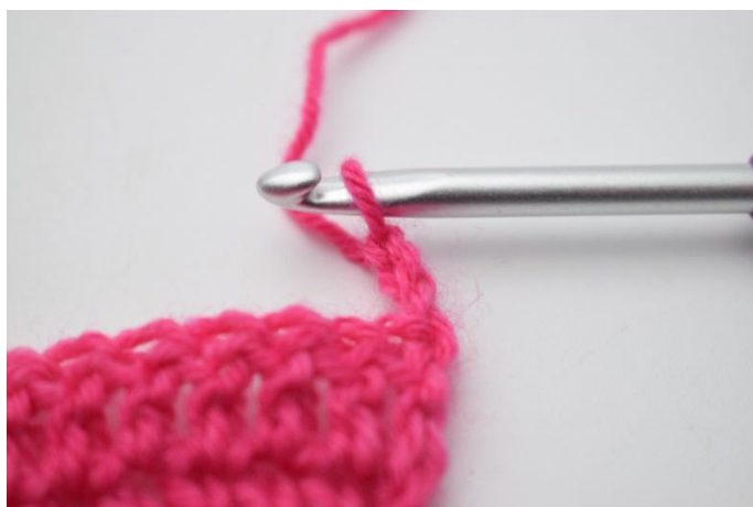
1. 3 cat per girare.

97. 3 cat per girare. Lav insieme le 2 m. succ. (dim.) e 1 m.a in ogni m. succ. (96)