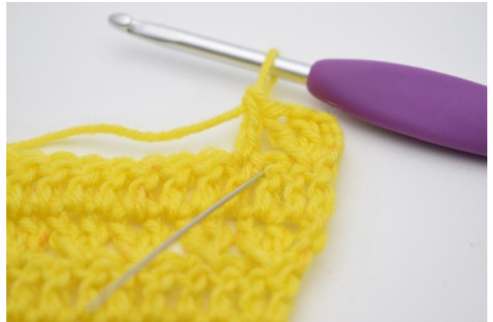
8. Lav 1 ma nella m. saltata.