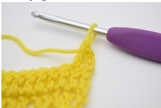
3. Lav 1 m.a.