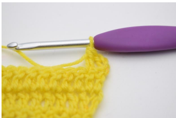
3. Lav 1 ma