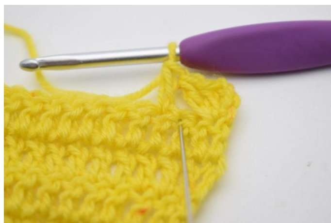
8. Lavora 1 ma nella m saltata.