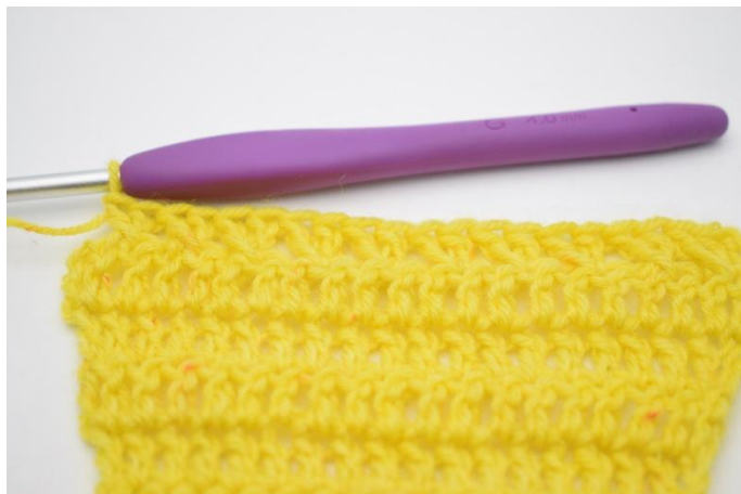
10. Ripeti facendo le m.a incrociate fino a quando rimane 1 m.