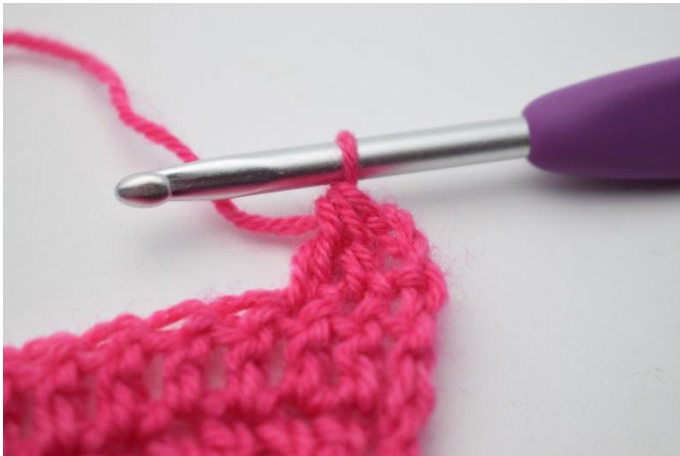
3. In questo modo.