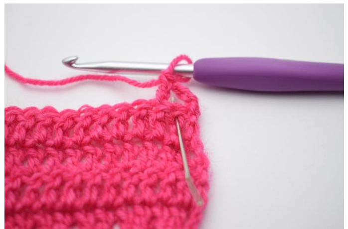
4. Lavora 1 m.a nella 2° m. che hai saltato.