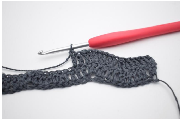
6. Lavora 1 m.a. nelle prossime 3 m.