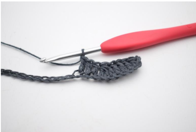
5. Lavora 1 m.a. nelle prossime 3 cat.