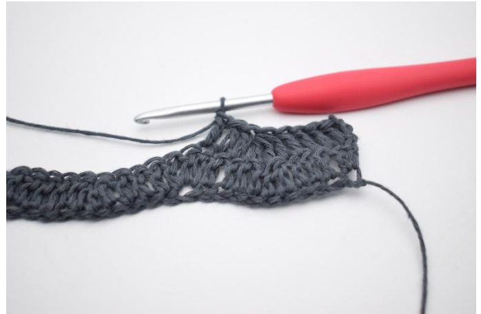
4. Lavora 1 m.a. nelle prossime 3 m.