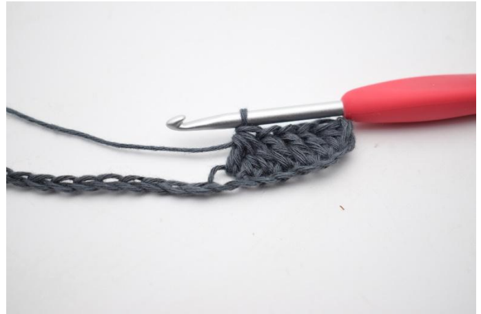
4. Lavora 3 m.a. ins. nelle prossime 3 cat.