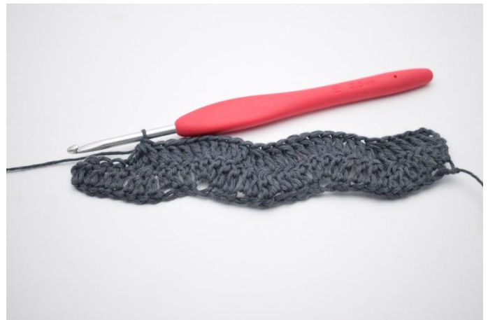
8. Ripeti da * a * come spiegato nelle istruzioni