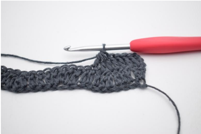
3. Lavora 3 m.a. ins. nelle prossime 3 m.