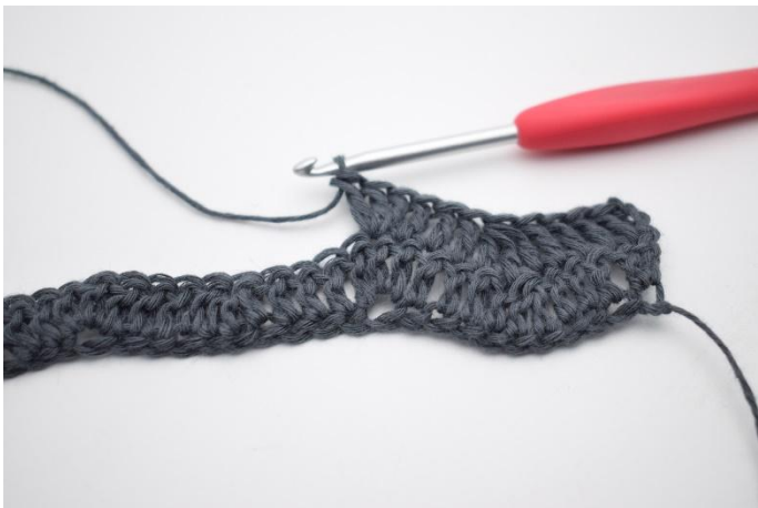
5. Lavora 3 m.a. nella prossima m.