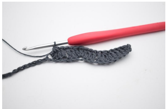
8. Lavora 3 m.a. ins. nelle prossime 3 cat.