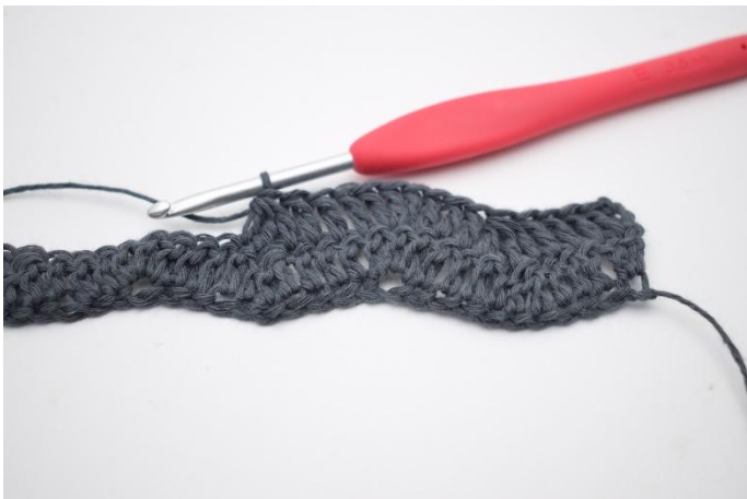
7. Lavora 3 m.a. insieme nelle prossime 3 m.