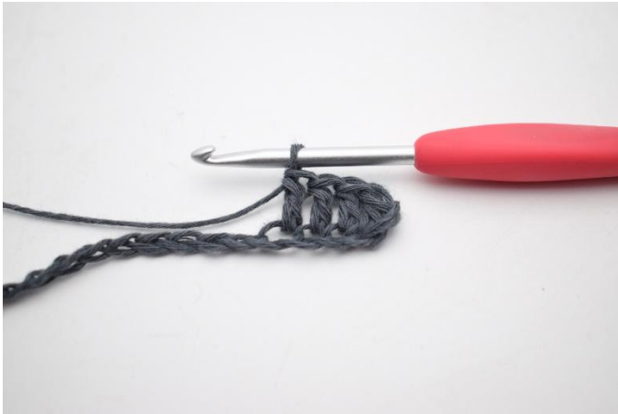
3. Lavora una m.a. nelle prossime 3 cat.