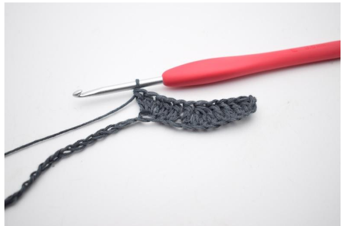
6. Lavora 3 m.a. nella stessa m.