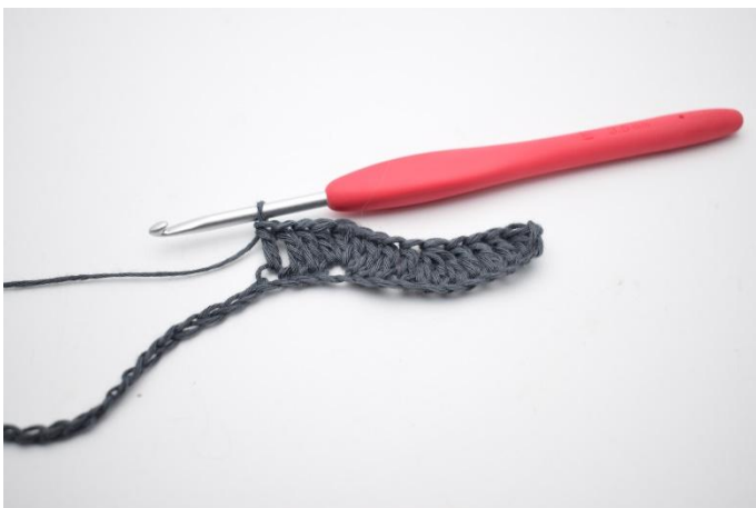
7. Lavora 1 m.a. nelle prossime 3 cat.