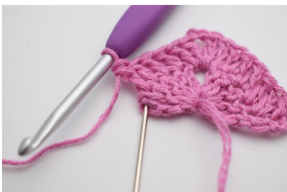
7. Nell'ultima m lavora 2 ma e 1 mad.