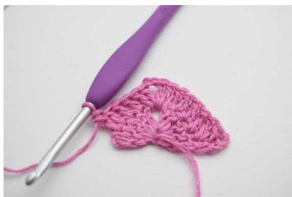
6. Lavora 1 ma nelle 4 m succ.