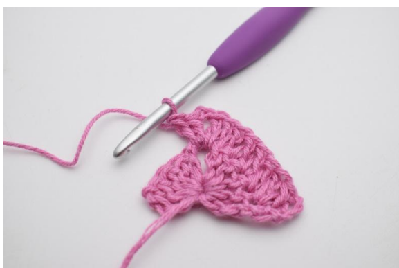
5. In questo modo.