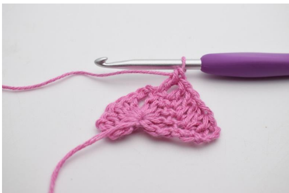
3. Lavora 1 ma nelle 4 m succ.