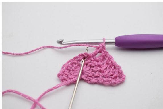
4. Nello sp-cat, lavora 2 ma, 2 cat, 2 ma.