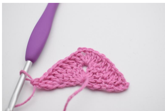
8. In questo modo.