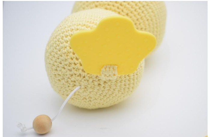
4. Cuci il cinturino sul fondo dell'anatra.