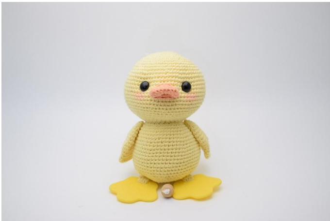
3. Ripeti dall'altra parte.