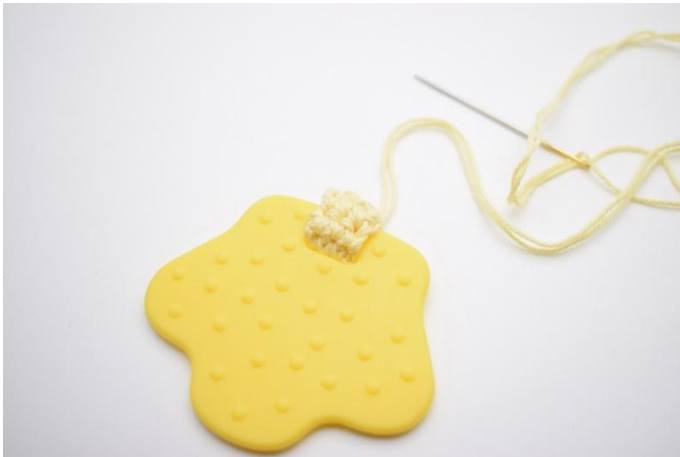
3. Cuci insieme il cinturino