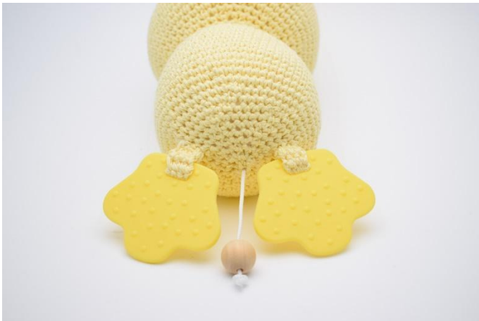
5. Ripeti con l'altro massaggiagengive.