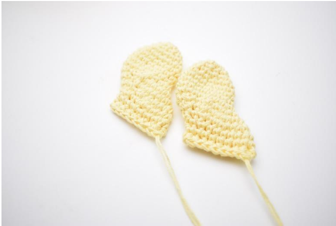
1. Le ali sono pronte per essere attaccate.

Piega l'ala e lavora insieme i due lati. Non riempire l'ala.