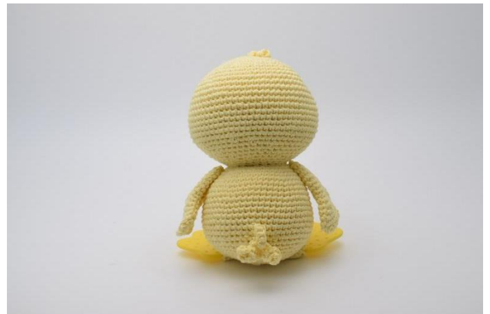
2. E dalla parte posteriore dell'anatra.