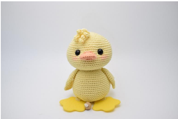
1. Attaccare i riccioli sopra la testa.