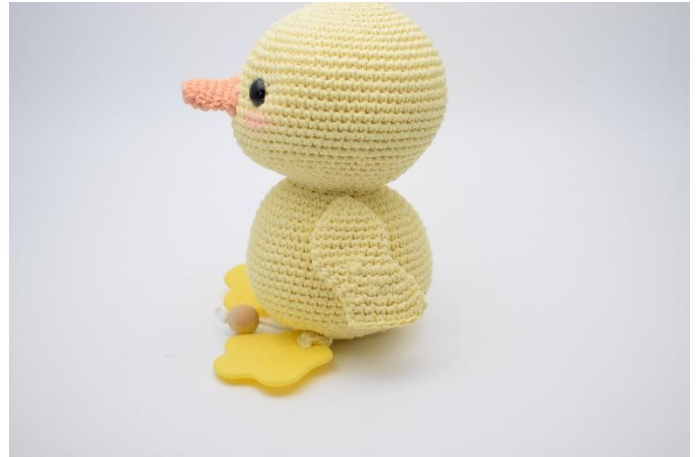
2. Cucire l'ala sul lato del corpo, per circa 3 giri dal collo.