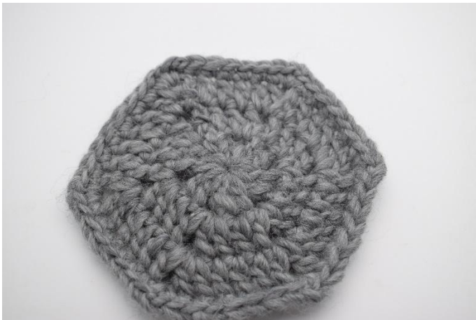
Ecco come appare il pezzo prima dell'infeltrimento Circa. 12 cm di diametro

Lavare i sottobicchieri a ciclo caldo in lavatrice. L'infeltrimento funziona meglio se ci sono altri oggetti nel carico con i sottobicchieri (ad esempio: asciugamani o un paio di jeans). Se non sono abbastanza infeltriti dopo il primo ciclo, potrebbe essere necessario eseguirlo una seconda volta. La quantità di infeltrimento può variare da lavatrice a lavatrice, quindi potrebbe essere una buona idea realizzare un pezzo di prova prima di infeltrire il prodotto finale.