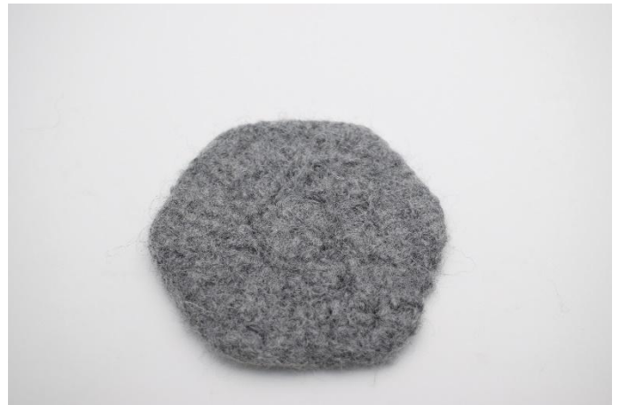
Dopo l'infeltrimento Circa 10 cm di diametro