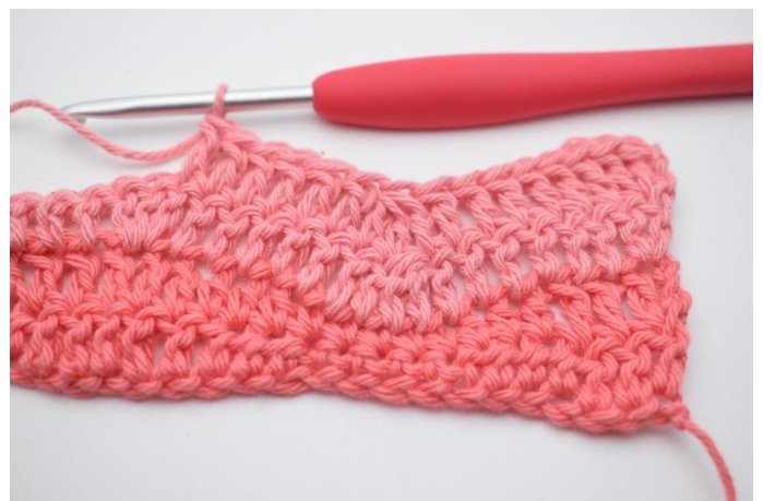
12. Lavora 1 ma nelle 6 m succ.