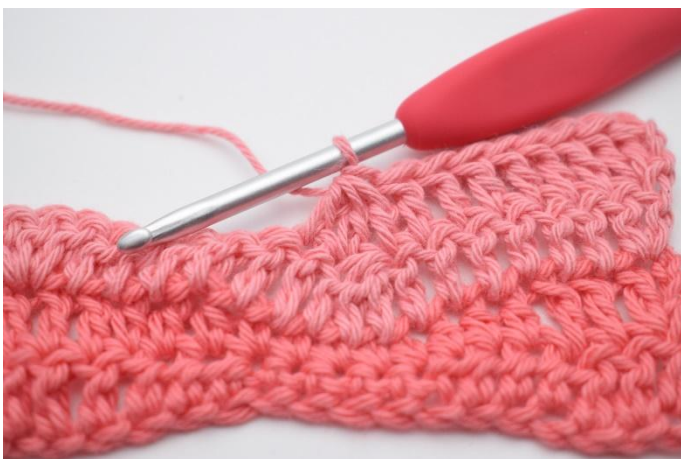
11. Lavora 3 m ch ins.