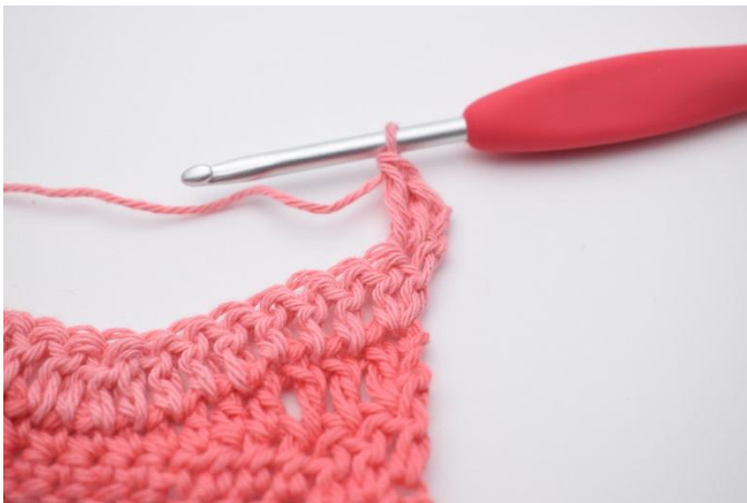
9. Lavora 2 ma nella prima m.