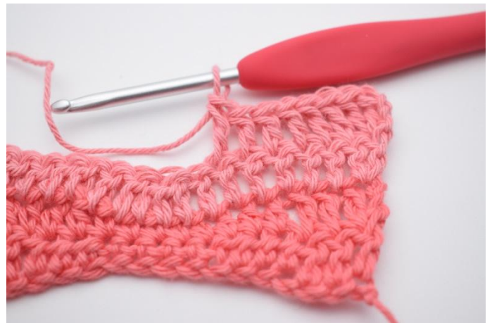
10. Lavora 1 ma nelle 6 m succ.