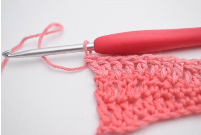
7. ma terminare con 2 ma nell'ultima m.