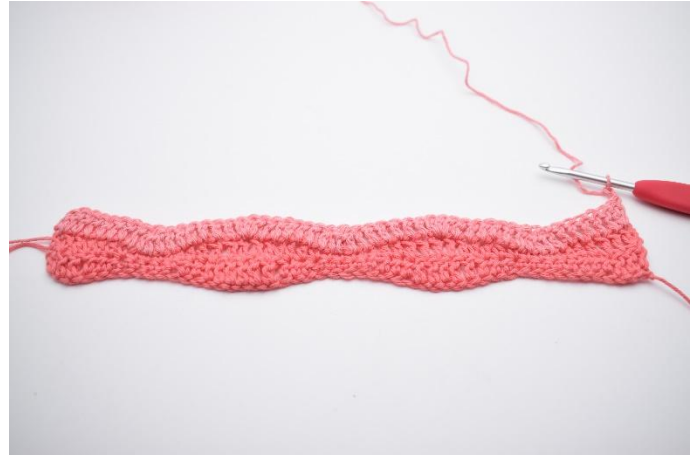
8. Gira con 2 cat.