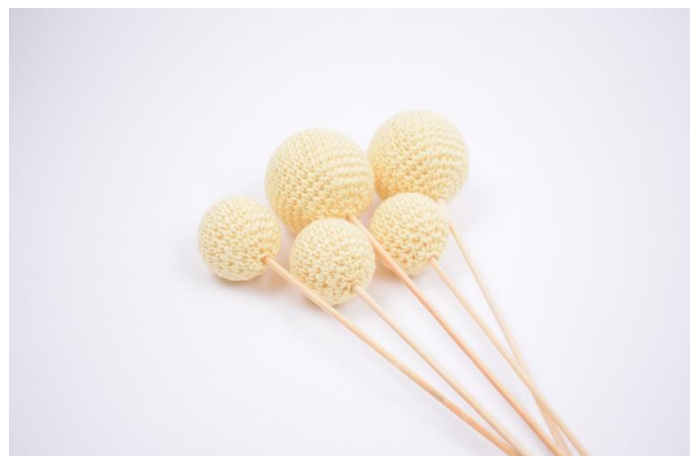
6. Ora sono pronti per decorare la tua casa 😊