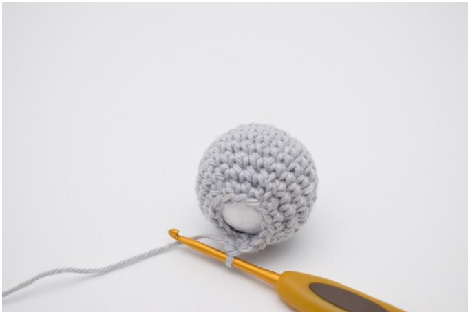
3. Continuare a lavorare attorno alla palla.