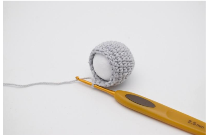
2. Posizionare la pallina di polistirolo nel pezzo.