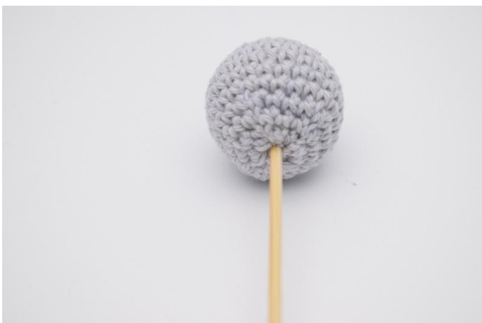
5. Inserire il bastoncino nella parte inferiore della palla.