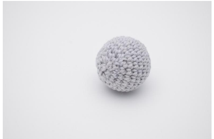
4. Cucire il buco e intrecciare le estremità.