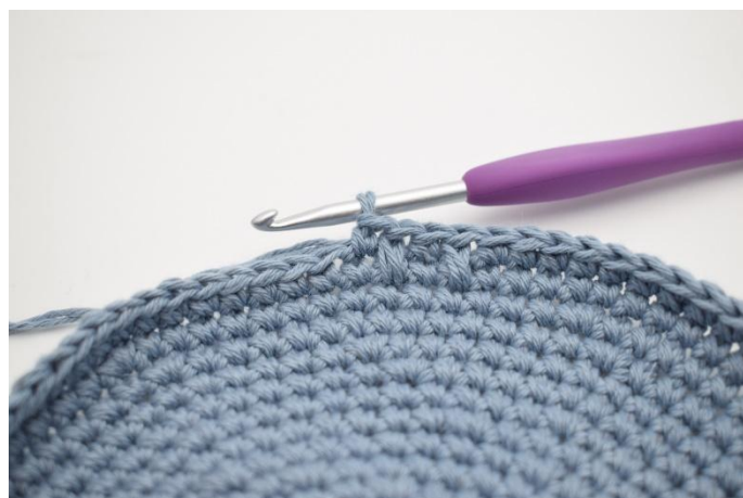
8. In questo modo. Questo si ripete per tutto il giro.