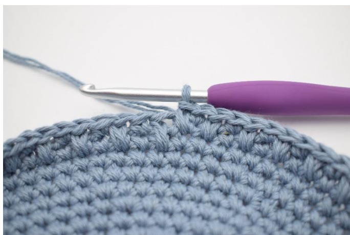
9. Ripetere per tutto il giro e termina con 1 mbl.