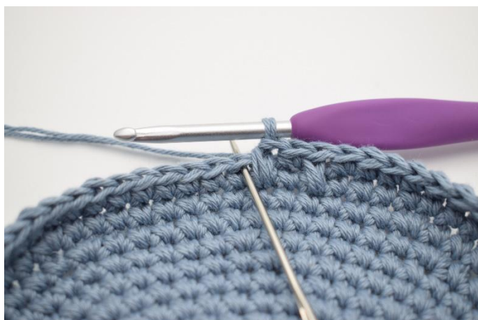
7. Lavora 1 mb normale nella m succ.