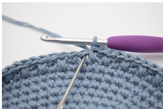
10. Quando si esegue il giro successivo, lavorare in senso opposto, quindi iniziare il giro con 1 mb, seguito da 1 mbl. Ciò significa che lavori mb in mbl del giro precedente e mbl in mb del giro precedente. Ripetere i 2 giri in questo modo come descritto nel modello.