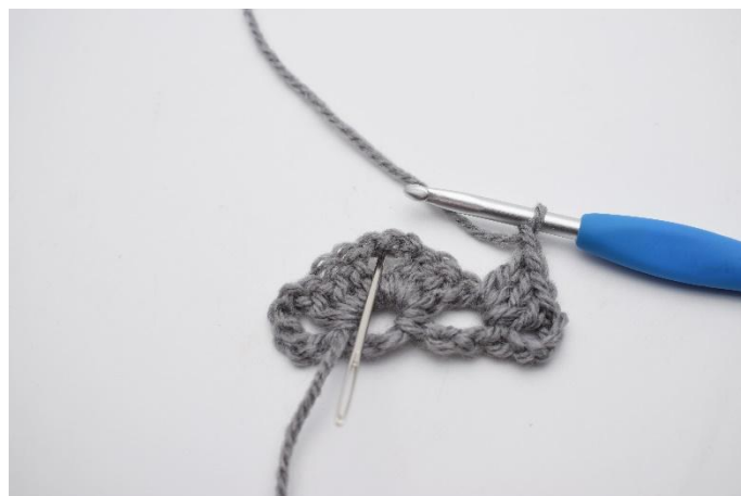
10. 1 Cat. Il successivo gruppo di m chiuse insieme è fatto nello spazio tra le cat come mostra l'ago.