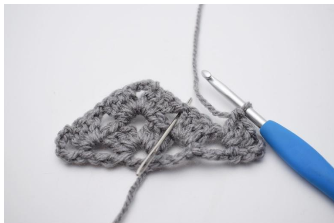
21. 1 Cat. Il successivo gruppo di m chiuse insieme è fatto nello spazio tra le cat come mostra l'ago.