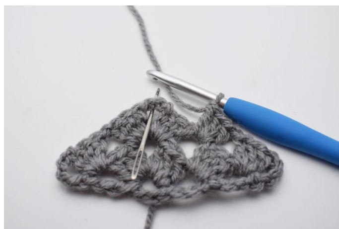
23. 1 Cat. Il successivo gruppo di m chiuse insieme è fatto nello spazio tra le cat come mostra l'ago.