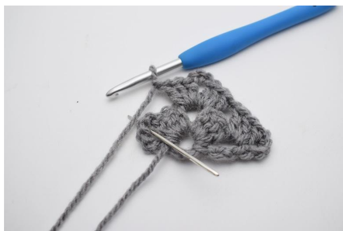
14. 1 Cat. Il successivo gruppo di m chiuse insieme è fatto nello spazio tra le cat come mostra l'ago.