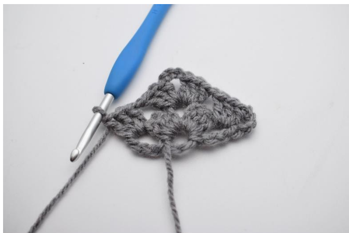
15. Lavora 1 gruppo di ma insieme.