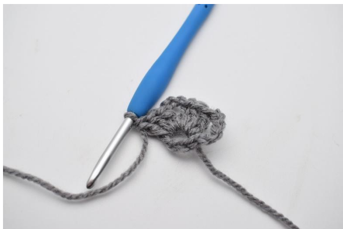
5. Lavora 3 ma nell'anello.