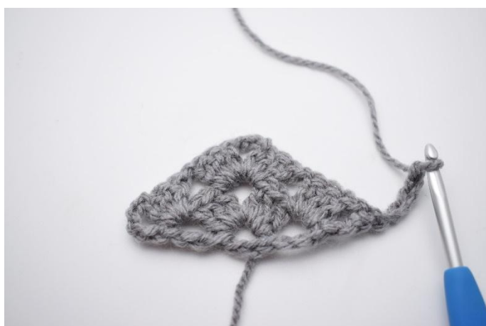
18. 5 Cat e gira il lavoro.