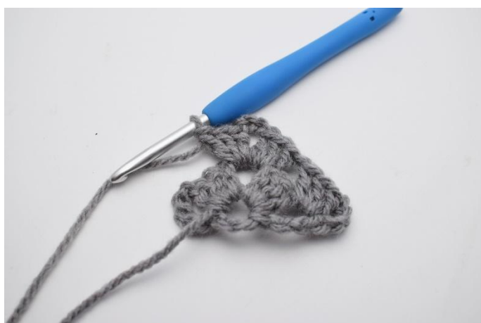
13. Lavora 1 gruppo di ma insieme.