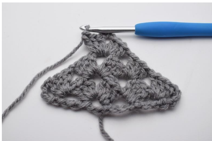
24. Lavora 1 gruppo di ma insieme, 3 cat, 1 gruppo di ma insieme nello spazio tra le cat.