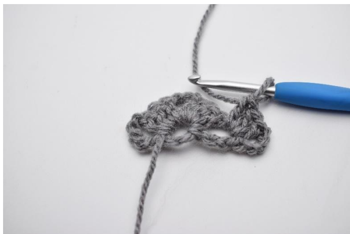
9. Lavora 1 gruppo di ma insieme.