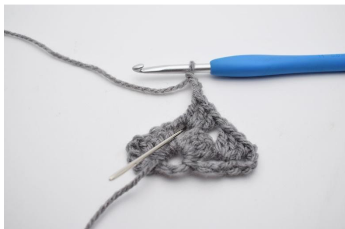
12. 3 Cat. Lavorerai nello spazio tra le cat come prima.