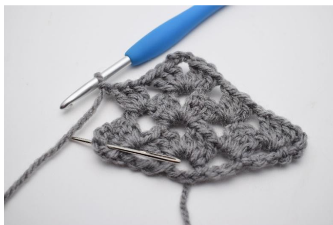
27. 1 Cat. Il successivo gruppo di m chiuse insieme è fatto nello spazio tra le cat come mostra l'ago.