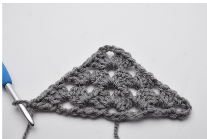
29. 1 Cat e lavora 1 mad nella 4° cat del giro precedente.