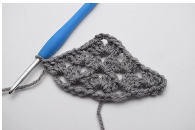
28. Lavora 1 gruppo di ma insieme.