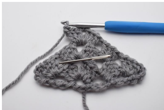
25. 1 Cat. Il successivo gruppo di m chiuse insieme è fatto nello spazio tra le cat come mostra l'ago