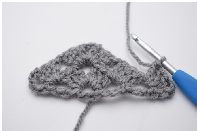
20. Lavora 1 gruppo di ma insieme.