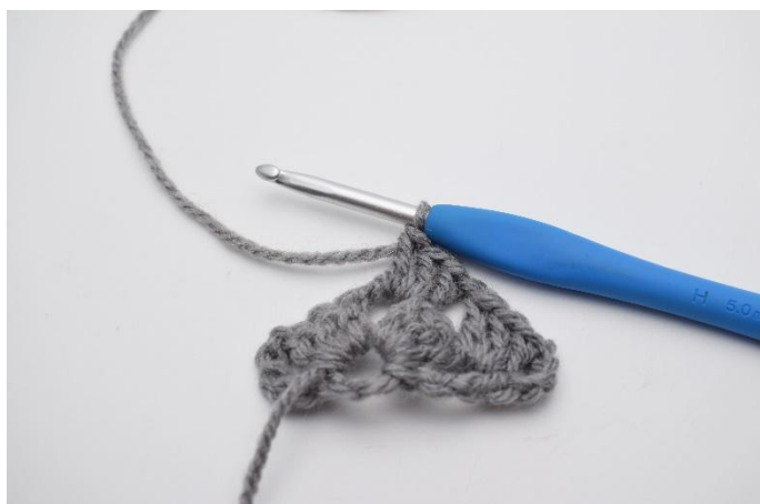
11. Lavora 1 gruppo di ma insieme.