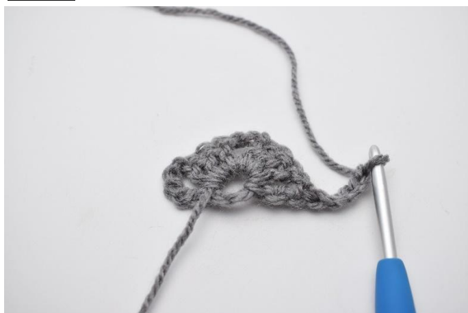
7. 5 Cat e gira il lavoro.