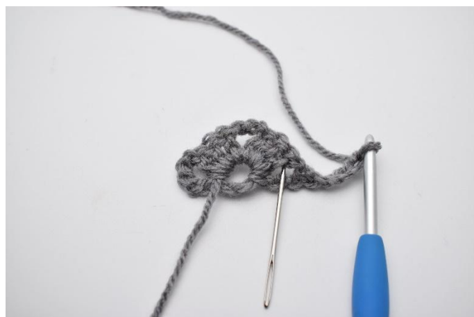
8. Il successivo gruppo di m chiuse insieme è fatto nello spazio tra le cat come mostra l'ago.