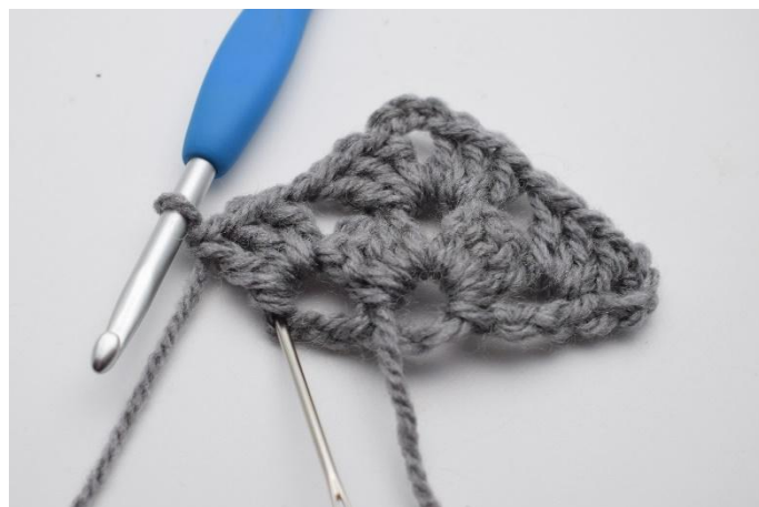
16. 1 Cat. L'ago mostra la 4° cat del giro precedente.