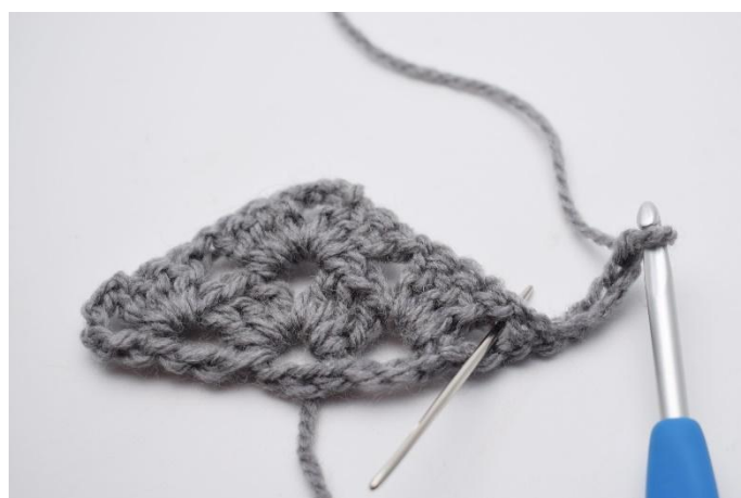
19. Il successivo gruppo di m chiuse insieme è fatto nello spazio tra le cat come mostra l'ago.