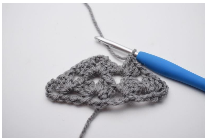
22. Lavora 1 gruppo di ma insieme.