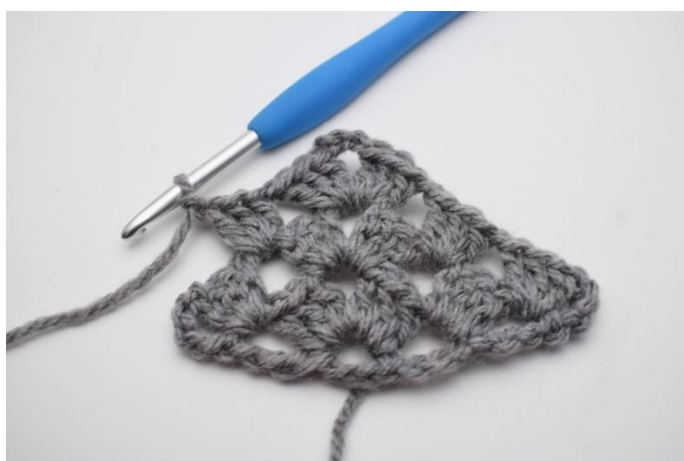
26. Lavora 1 gruppo di ma insieme.