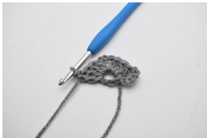
6. 1 Cat e lavora 1 mad nell'anello.