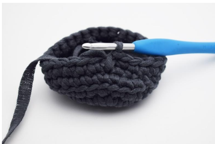
3. In questo modo. Ora hai creato la tua prima mbl.