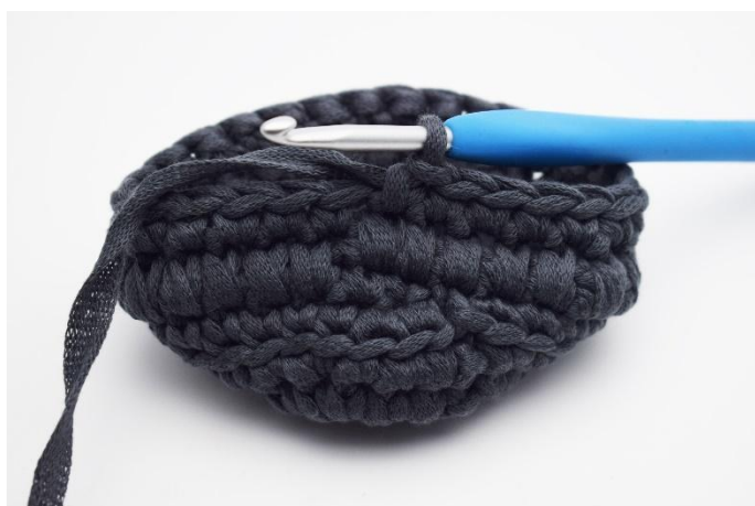
5. Lavora 1 giro di mb come al solito.