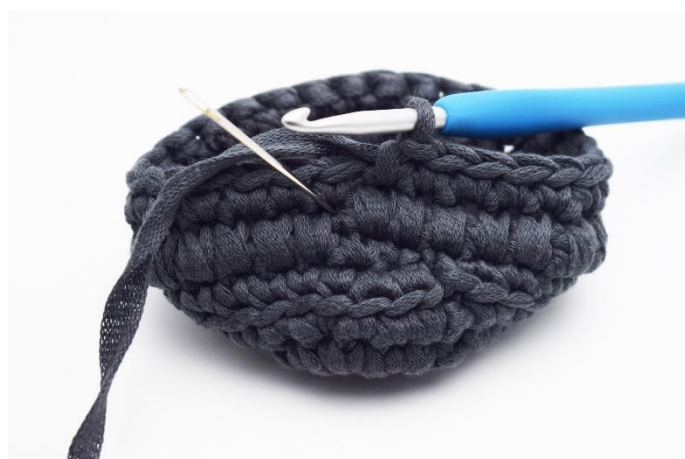
6. Ora lavorare di nuovo un giro di mbl. Qui l'ago segna dove lavorare la tua prossima mbl.