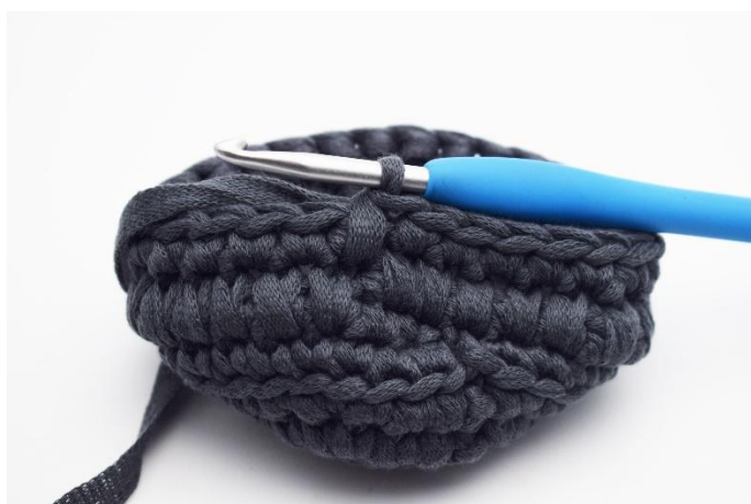
7. In questo modo.