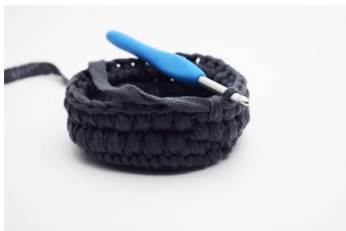
8. Ripetere per tutto il giro.