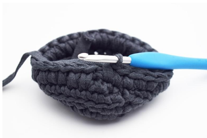
4. Ripeti in questo modo usando mbl.