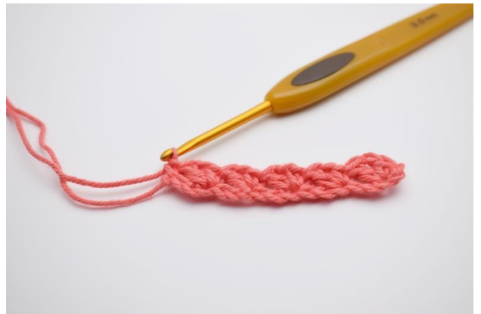
8. Nell'ultima cat, lavora 1 mb.