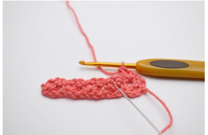
12. Passare al succ arch.