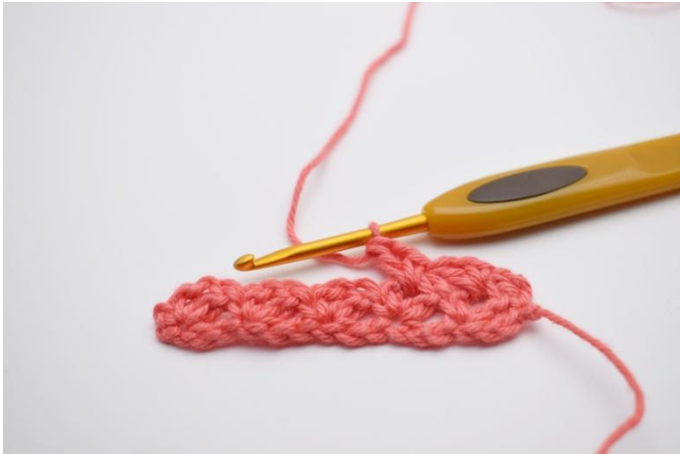
13. Lavora "1 mb, 1 cat, 1 ma" nel primo arch.