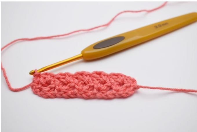
15. Nella cat per girare lavorare 1 mb. Ora ripeti questo giro fino a ottenere la dimensione desiderata del tuo panno.