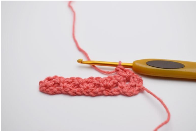
11. Lavora "1 mb, 1 cat, 1 ma" nel primo arch.