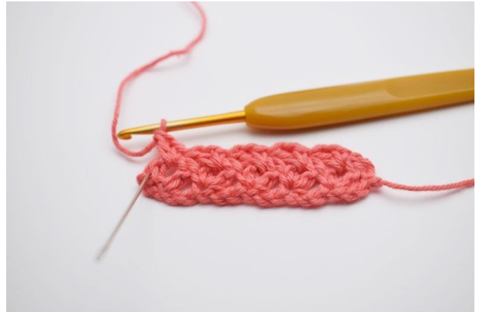
14. Ripetere per tutto il giro.