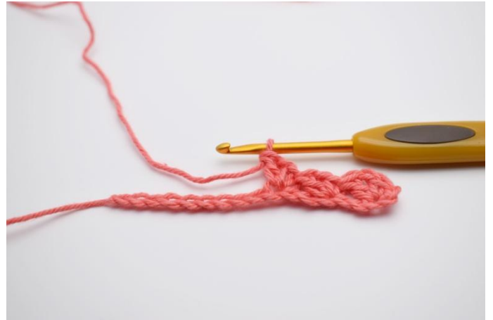
6. Lavora "1 mb, 1 cat e 1 ma" nella m succ.