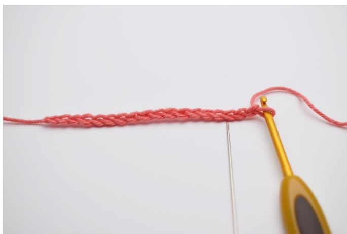
1. Inizia con la catenella di base. Le prime m sono fatte nella 3a cat dell'uncinetetto.