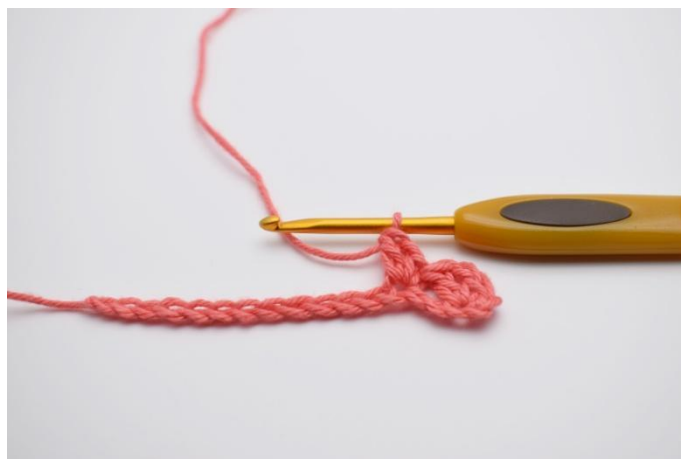
4. Lavora "1 mb, 1 cat e 1 ma" nella m succ.