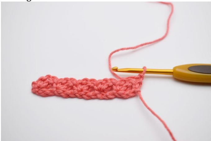
9. Gira con 1 cat.