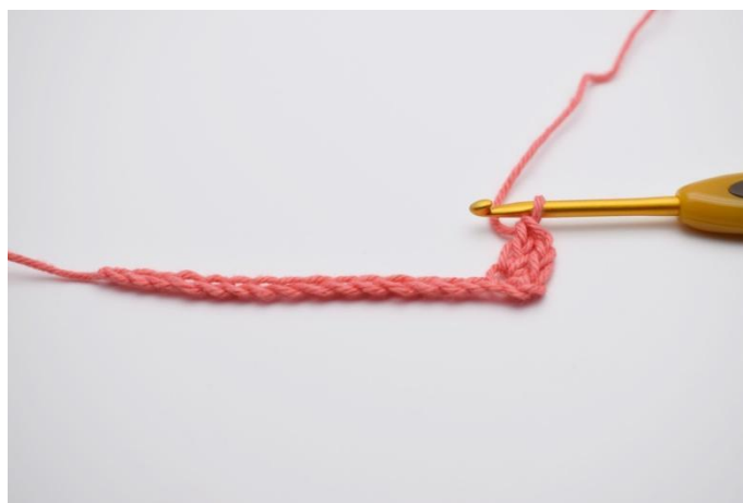
2. Lavora "1 mb, 1 cat, 1 ma" nella 3a cat dell'uncinetetto.