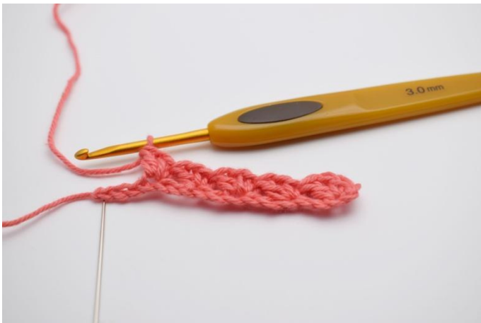
7. Ripetere "saltare 2 m, lavora "1 mb, 1 cat e 1 ma" nella m succ per tutto il giro fino a quando rimangono 3 m.