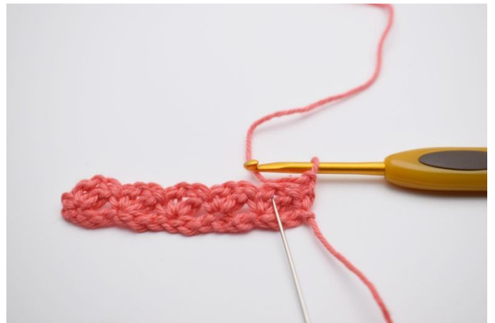
10. Ora lavorare negli arch di cat del giro precedente.