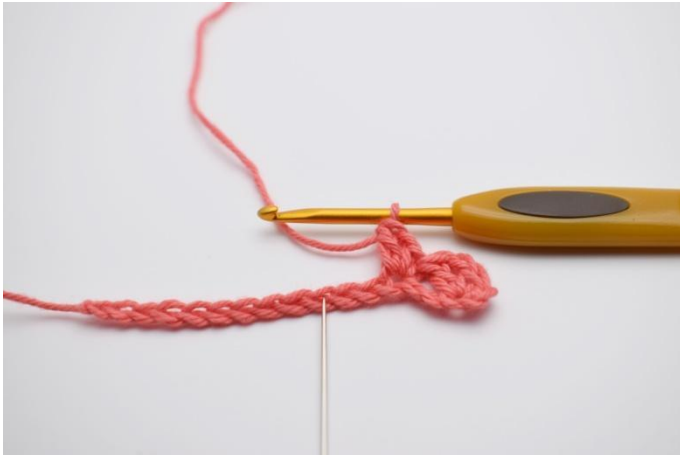
5. Saltare 2 m.