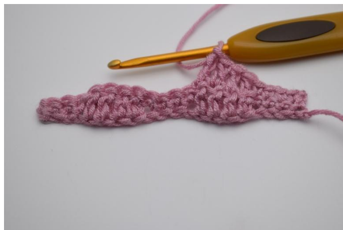
8. Lavora 1 ma nelle 4 m succ.