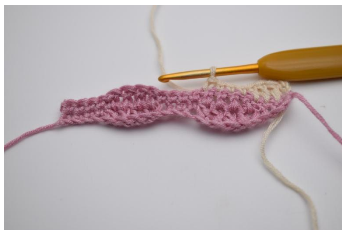
12. Lavora 1 mb nelle 4 m succ.