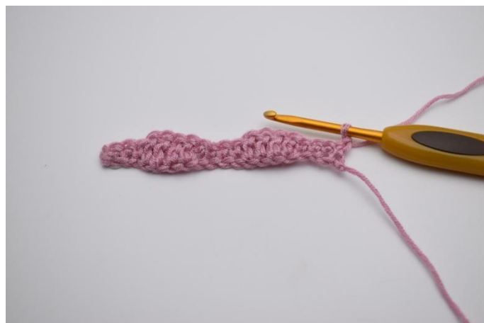
6. 1 cat e gira.