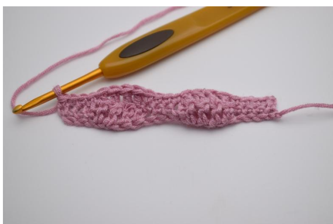
9. Lavora *1 mb nelle 4 m succ, 1 ma nelle 4 m succ* ripetere da *a* fino alla fine del giro, e termina con 1 mb nelle 4 m succ.