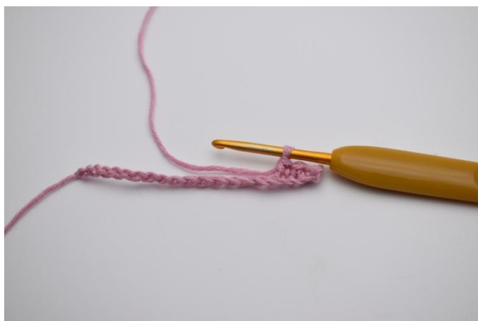
3. Lavora 1 mb nelle 3 cat succ.