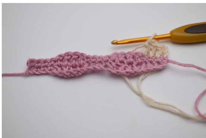
11. Lavora 1 ma nelle 3 m succ.