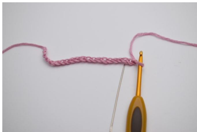
2. Saltare le prime 2 cat, lavora nella 3a cat dell'uncinetto.