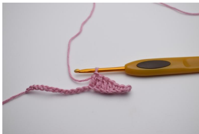
4. Lavora 1 ma nelle 4 cat succ.