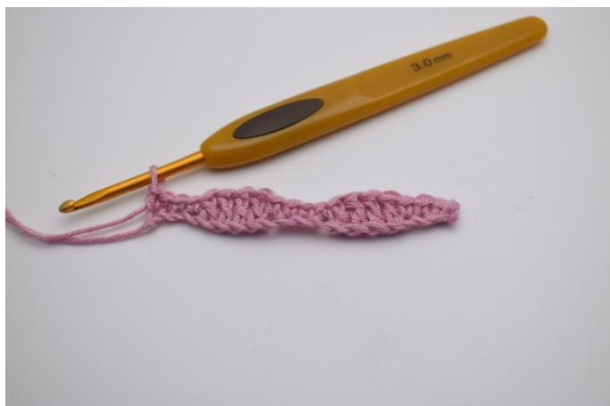
5. Lavora *1 mb nelle 4 m succ, 1 ma nelle 4 m succ* ripetere da *a* fino alla fine del giro, e termina con 1 mb nelle 4 m succ.