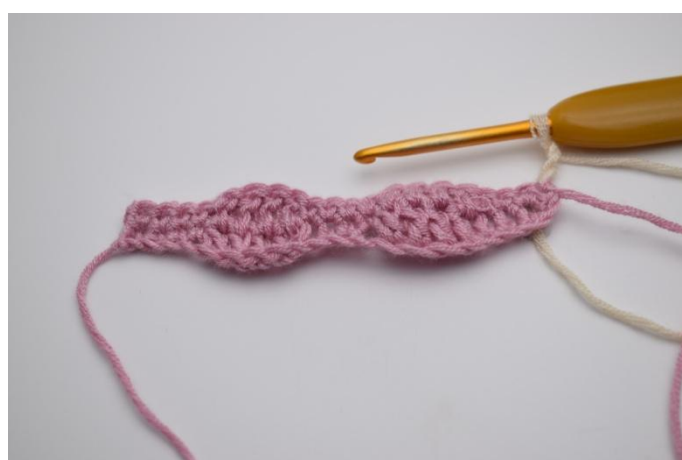
10. Passare al colore 2. 3 cat. Conta come 1 ma.