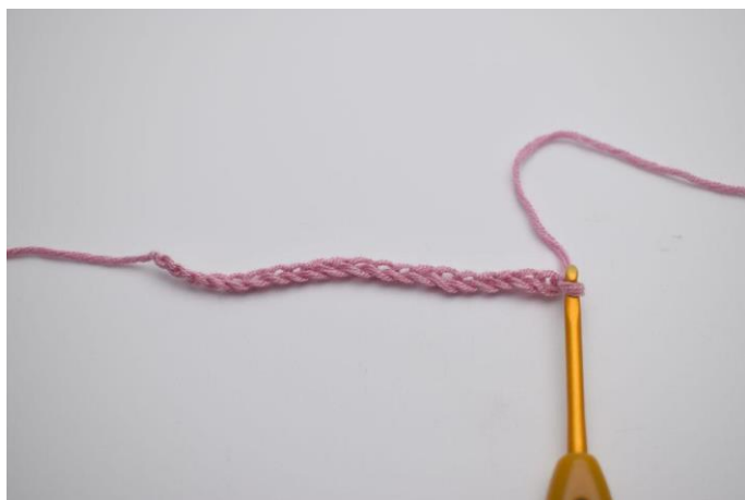
1. Inizia con la catenella di base.