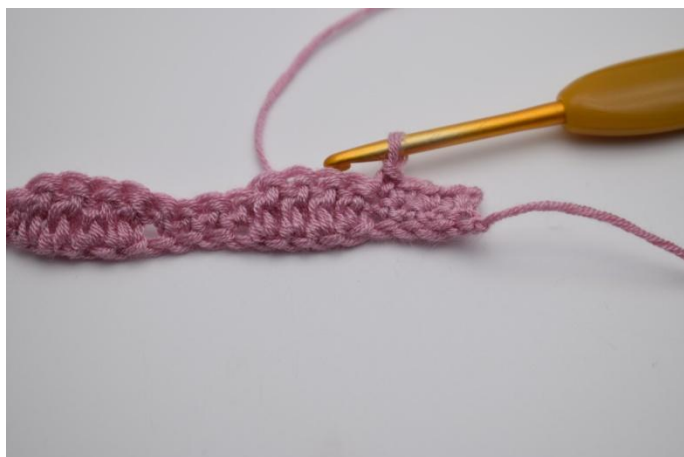
7. Lavora 1 mb nelle 4 m succ.